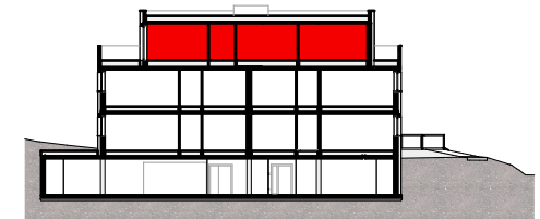
Lage der Wohnung im Schnitt

2 Stellplätze in der Tiefgarage 8,99 m 2 Kellerabteil