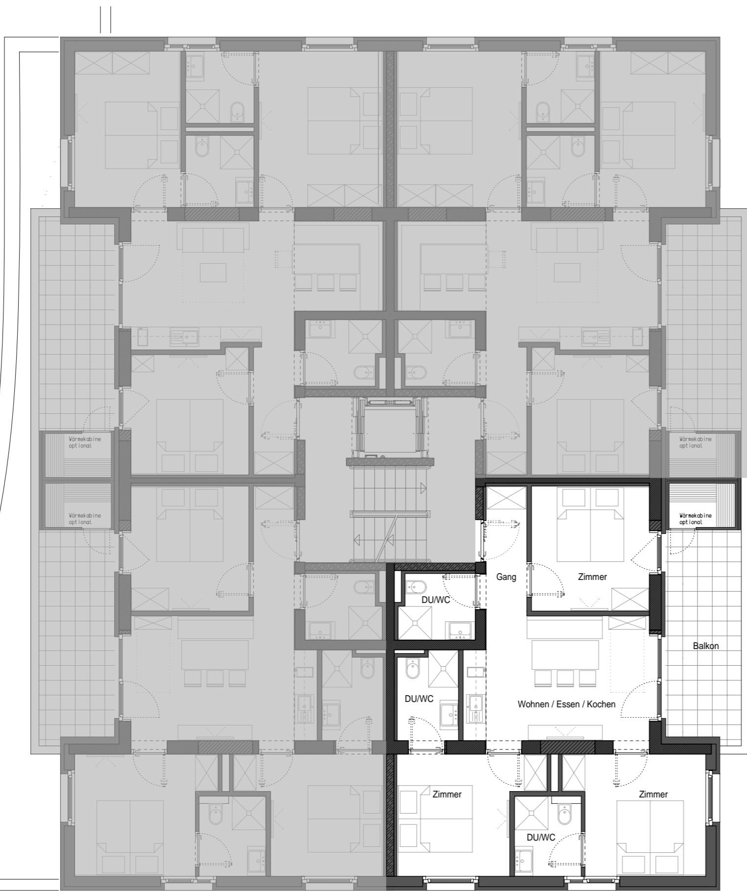
Grundriss Haus 3 E+2 M 1:100