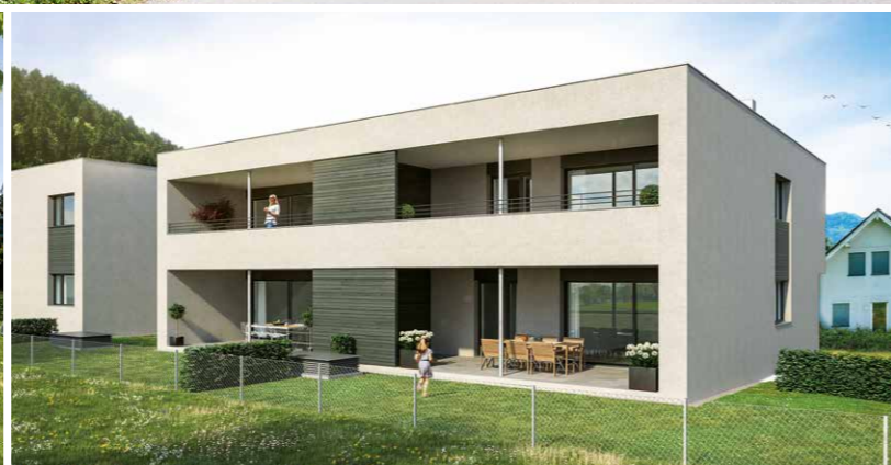
Ruhige und attraktive Wohnanlage im Grünen