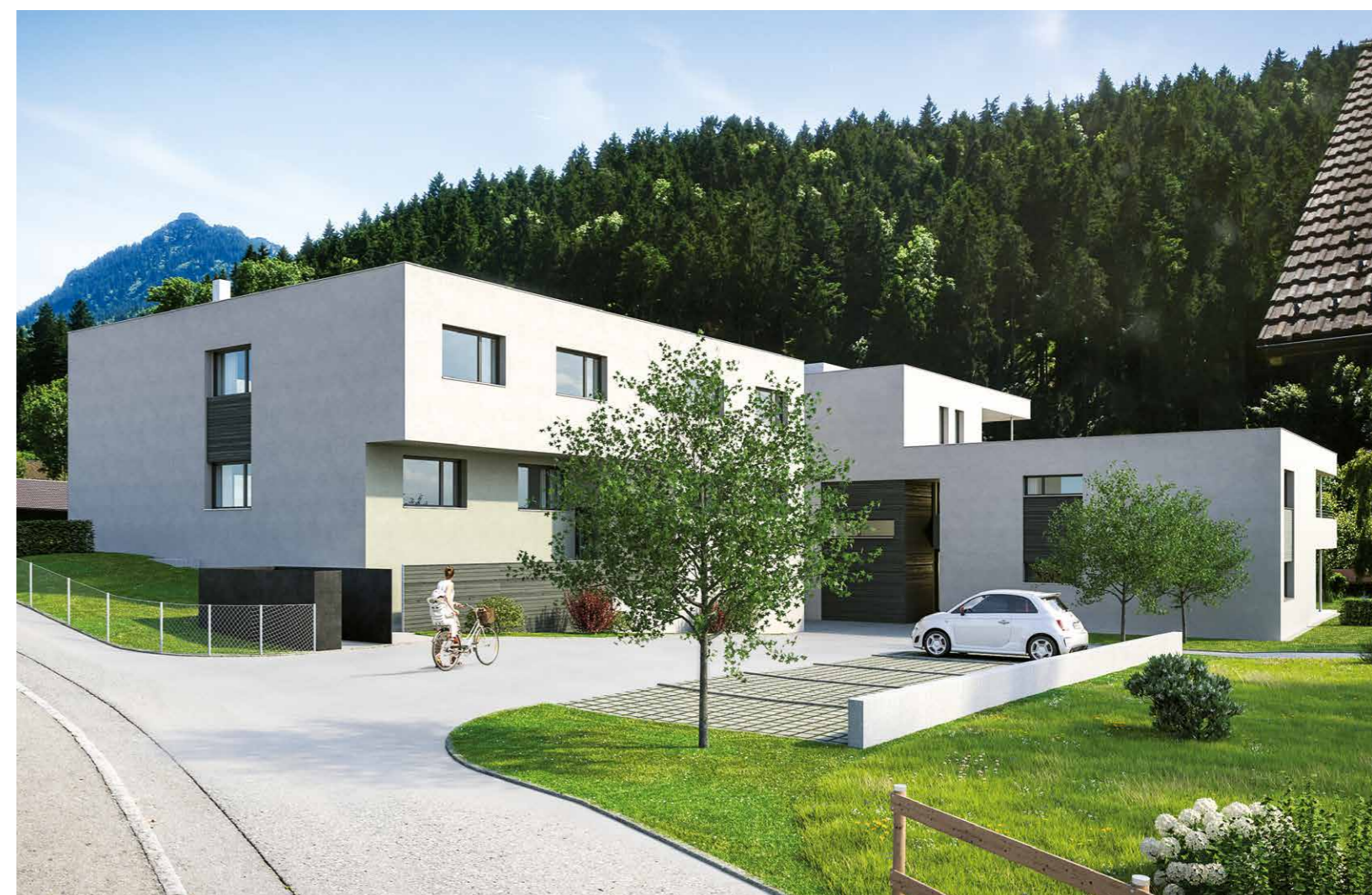
Mehr Lebensqualität in der Kreuzgasse in Frastanz