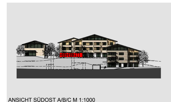
ANSICHT SÜDOST A/B/C M 1:1000