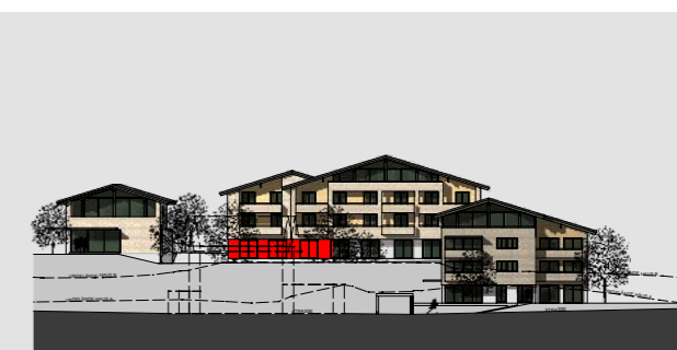
ANSICHT SÜDOST A/B/C M 1:1000