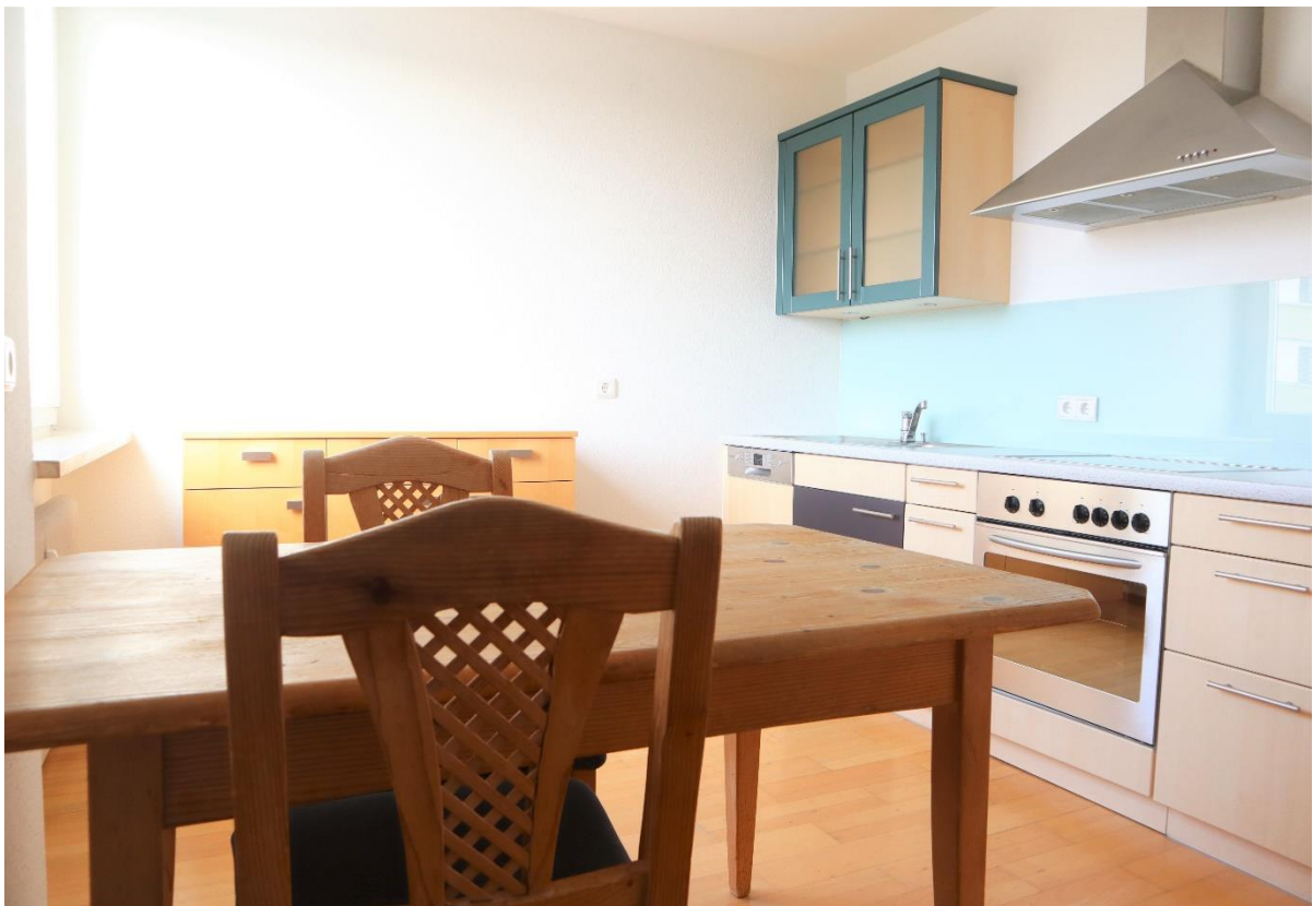
Kochen / Essen