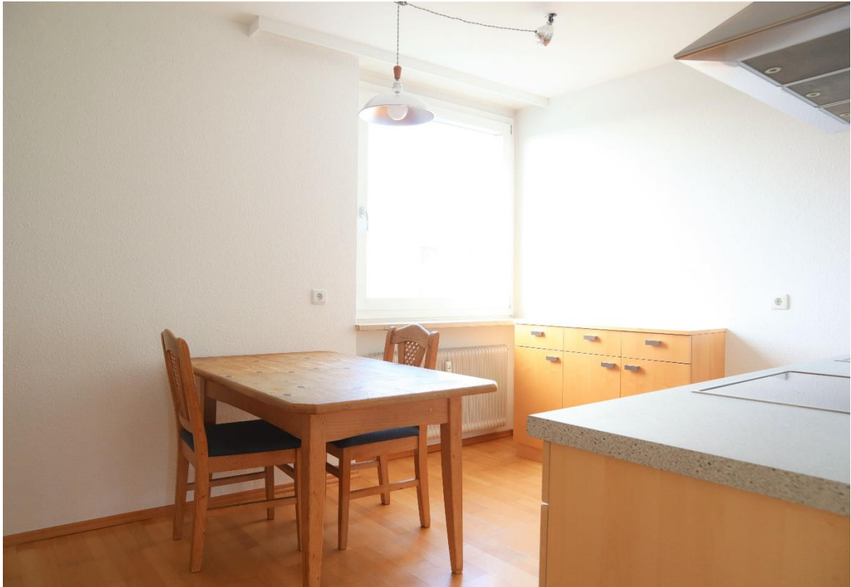
Kochen / Essen