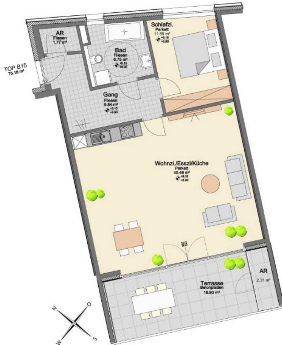
Grundriss ohne Maßstab