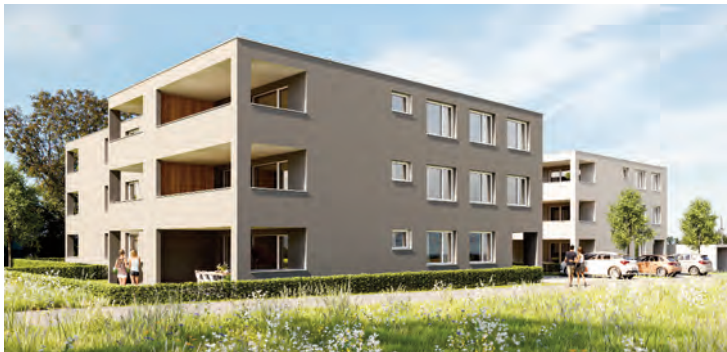
Haus B Tops 13-24