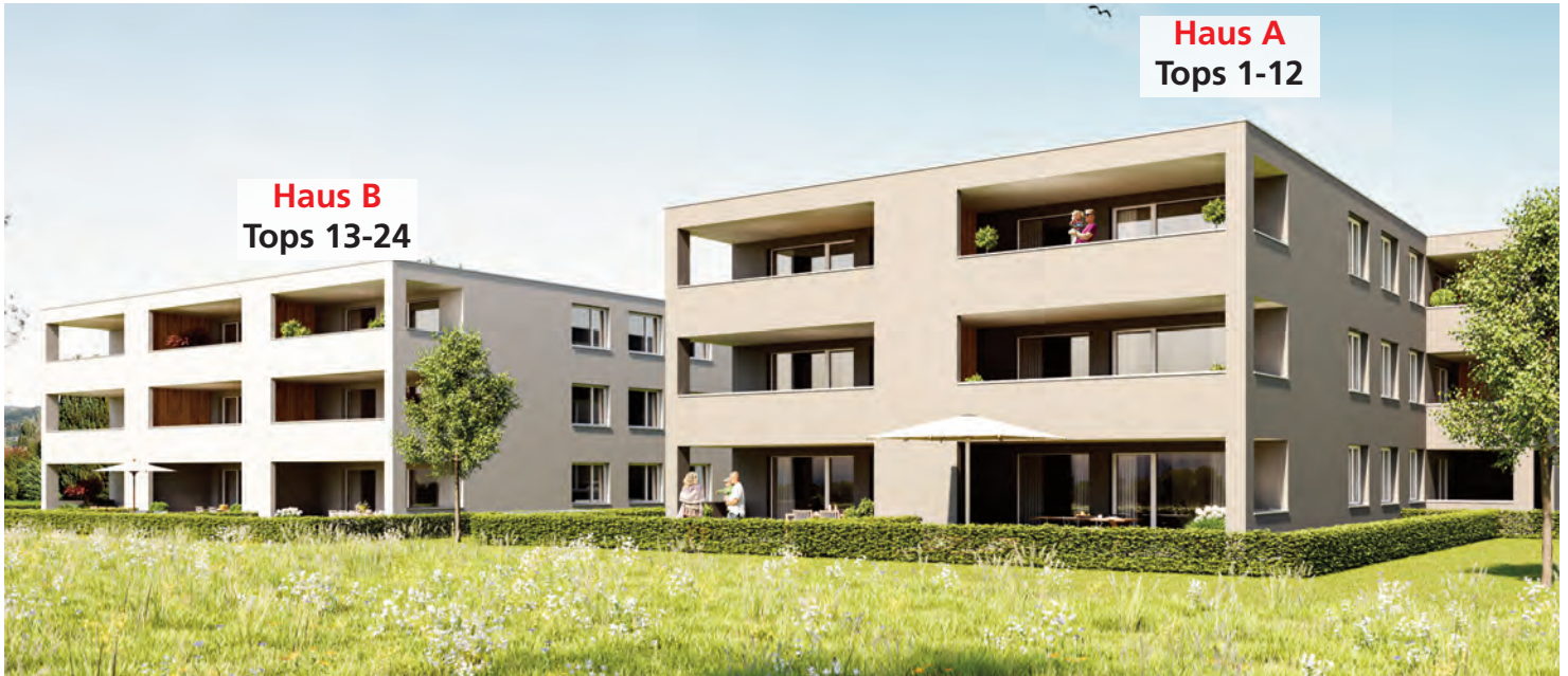
Haus A Tops 1-12