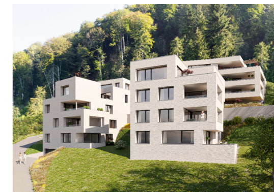
Vier Baukörper in einzigartiger Lage am Pfänderhang