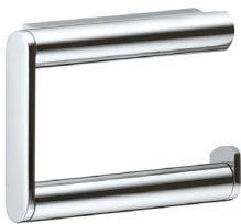
Keuco Papierhalter Plan verchromt