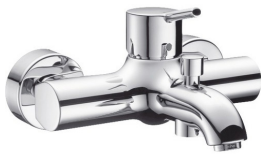
HG Talis S Einhebel-Badewannenmischer