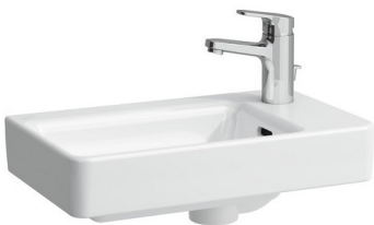
Laufen Handwaschbecken Pro S 48x28cm: HL rechts; weiß