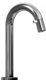
Standventil Hansanova Styleatempira Style verchromt