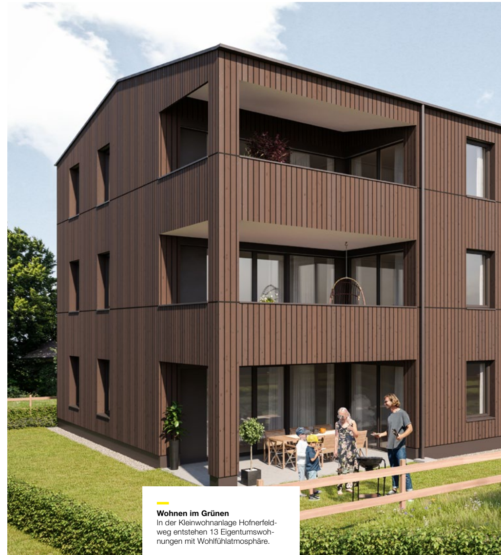
Wohnen im Grünen In der Kleinwohnanlage Hofnerfeldweg entstehen 13 Eigentumswohnungen mit Wohlfühlatmosphäre.

heim+müller architektur GmbH Nachbauerstraße 13 A-6850 Dornbirn