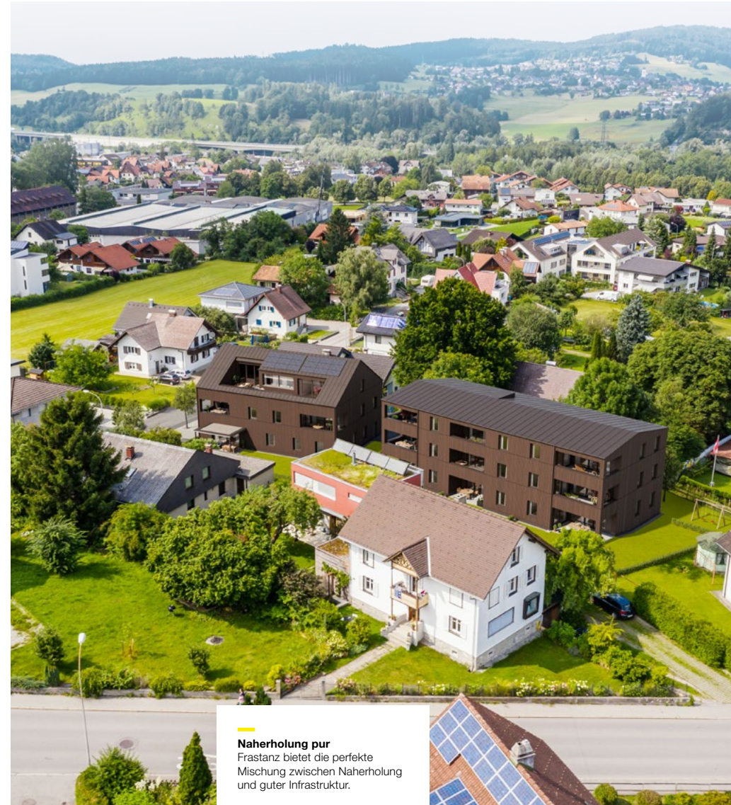
Naherholung pur Frastanz bietet die perfekte Mischung zwischen Naherholung und guter Infrastruktur.