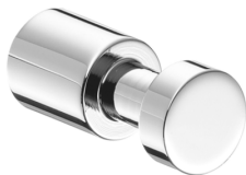
Handtuchhaken Style verchromt