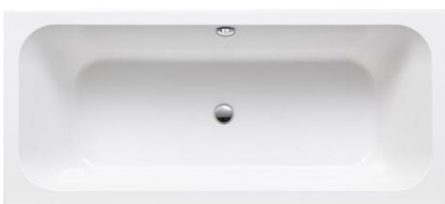
Mittelablaufwanne Acryl 180 x 80 cm weiß