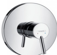
HG Talis S Einhebel-Brausemischer Unterputz