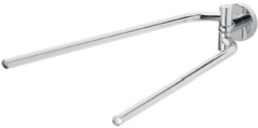
Smaragd Livio Handtuchhalter 2-arm verchromt