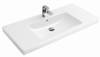
V & B Waschtisch Subway 2.0 - 80cm