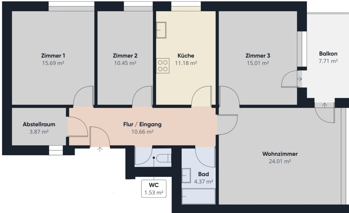
Grundriss ohne Maßstab