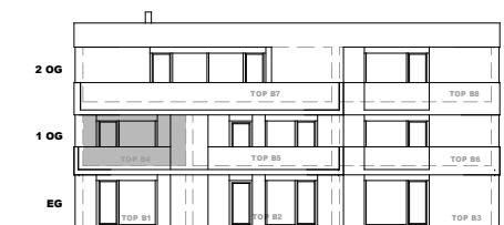
HAUS B - Südwestansicht