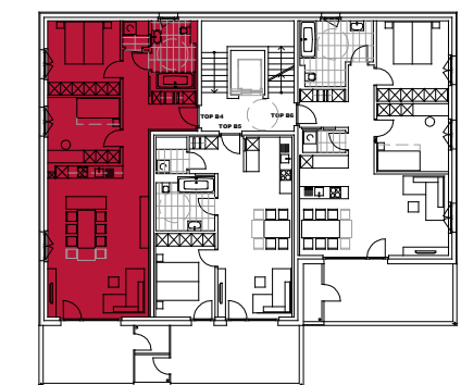
HAUS B_1 OBERGESCHOSS