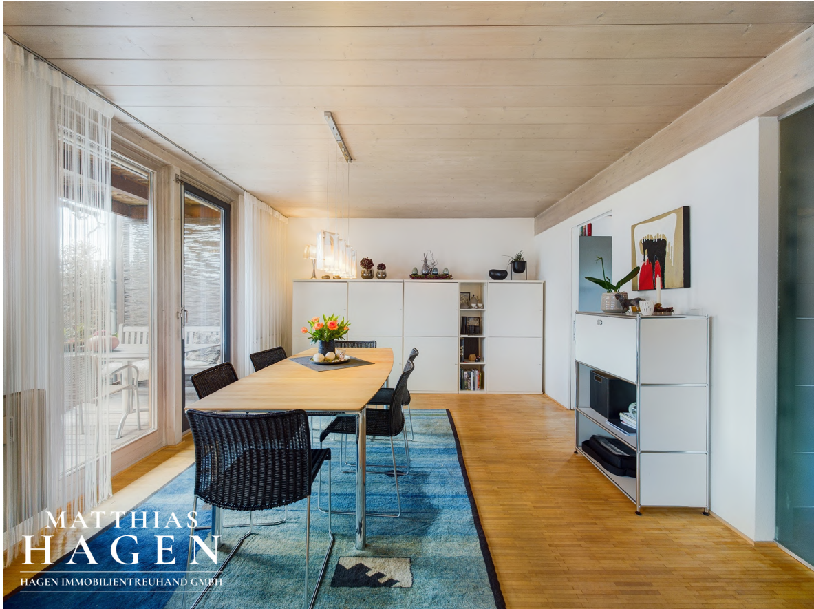
Blick zum Essbereich