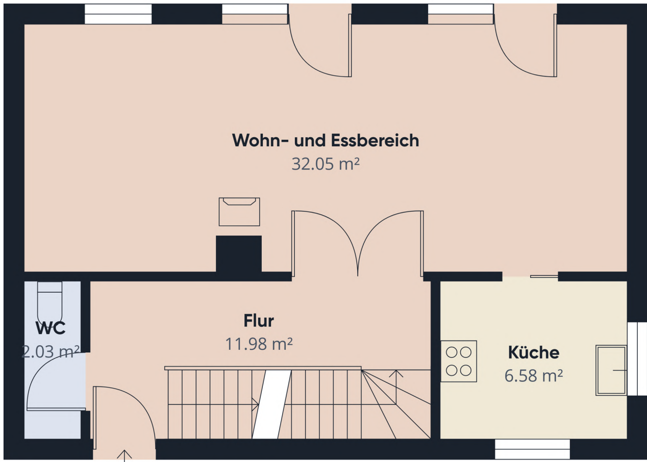
Grundrissplan ohne Maßstab EG