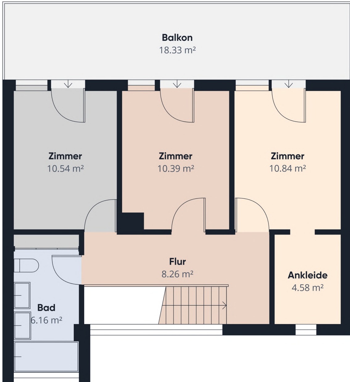
Grundrissplan ohne Maßstab OG