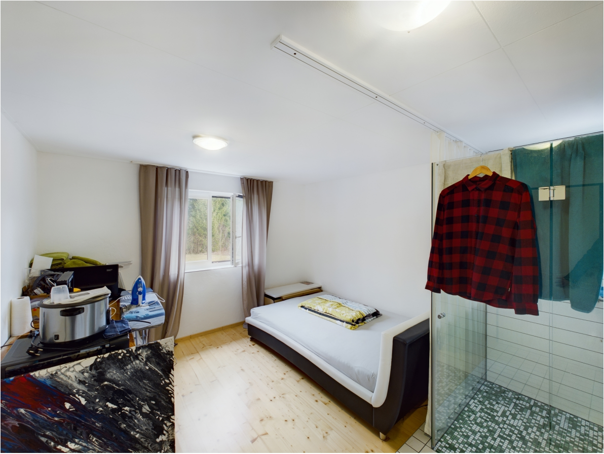
Schlafzimmer Top 1