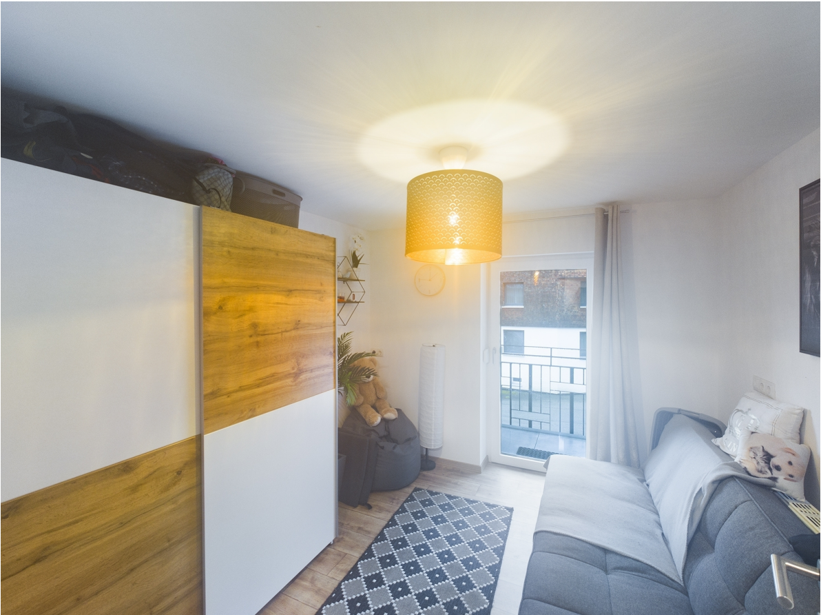
Büro Top 2