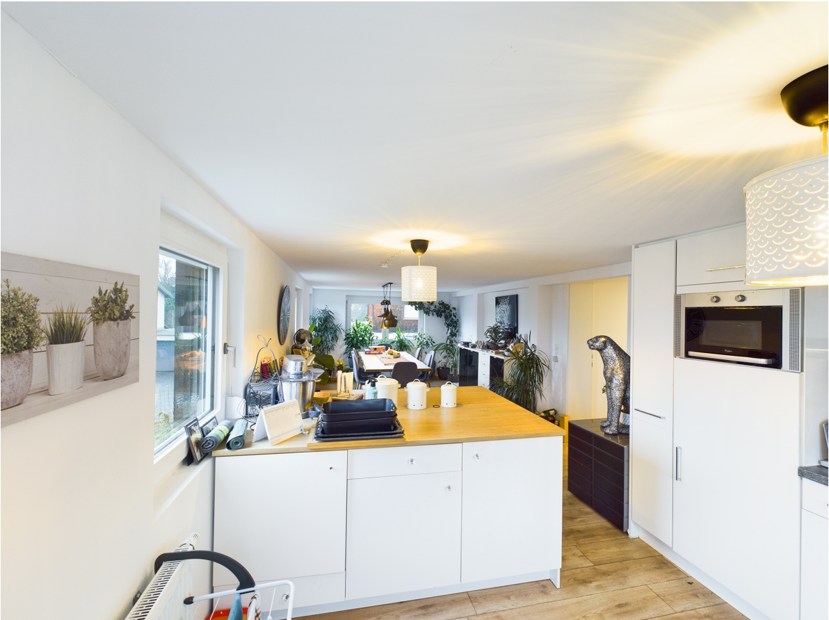
Kochen / Essen Top 2