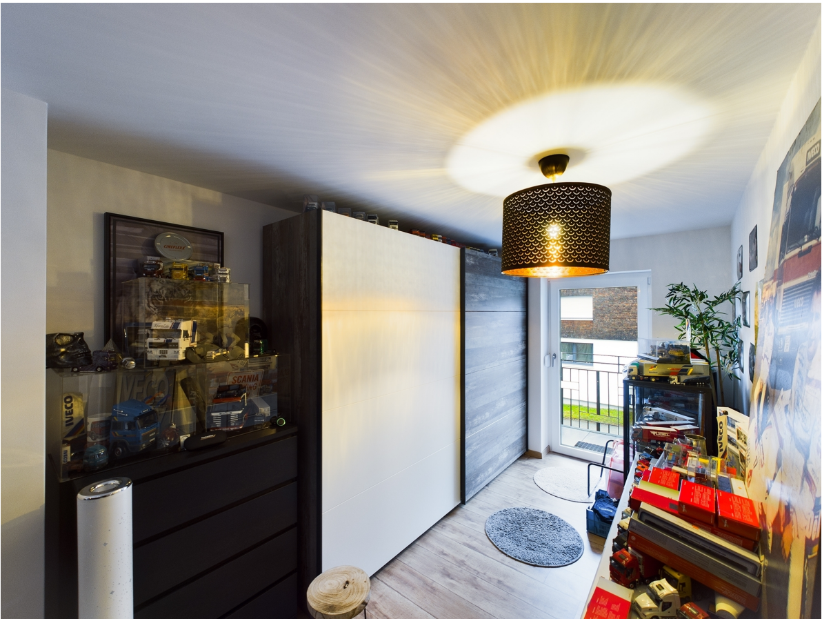
Zimmer Top 2