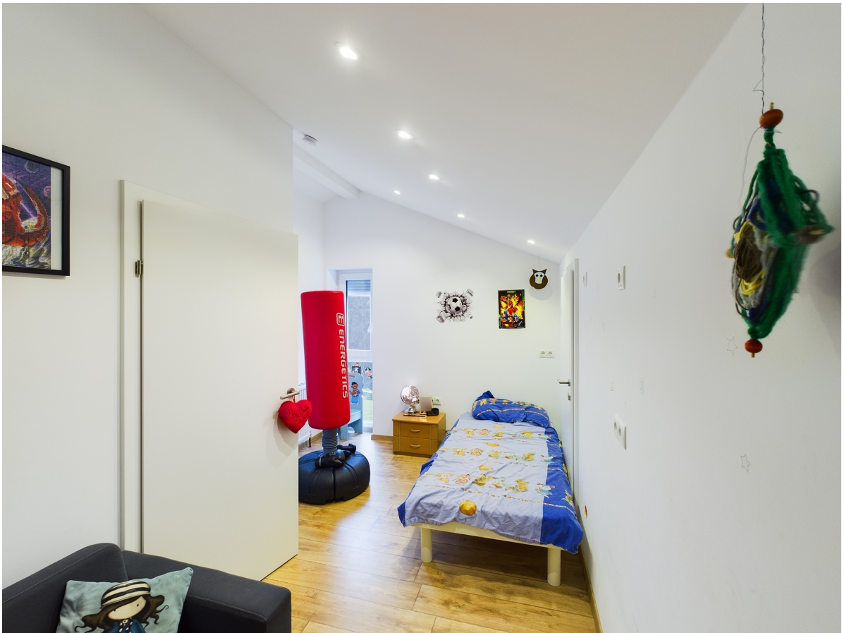
Zimmer Top 3