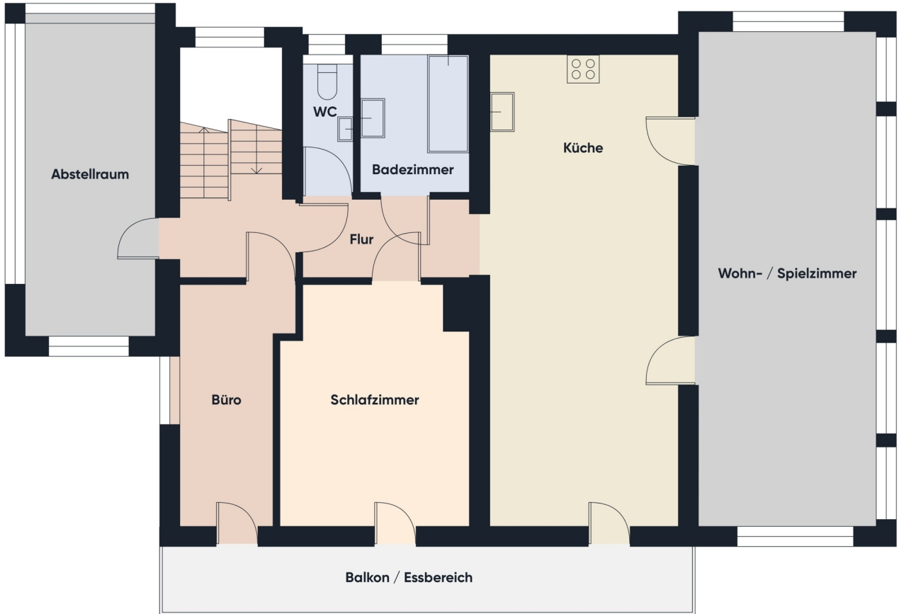
Grundriss 2. OG