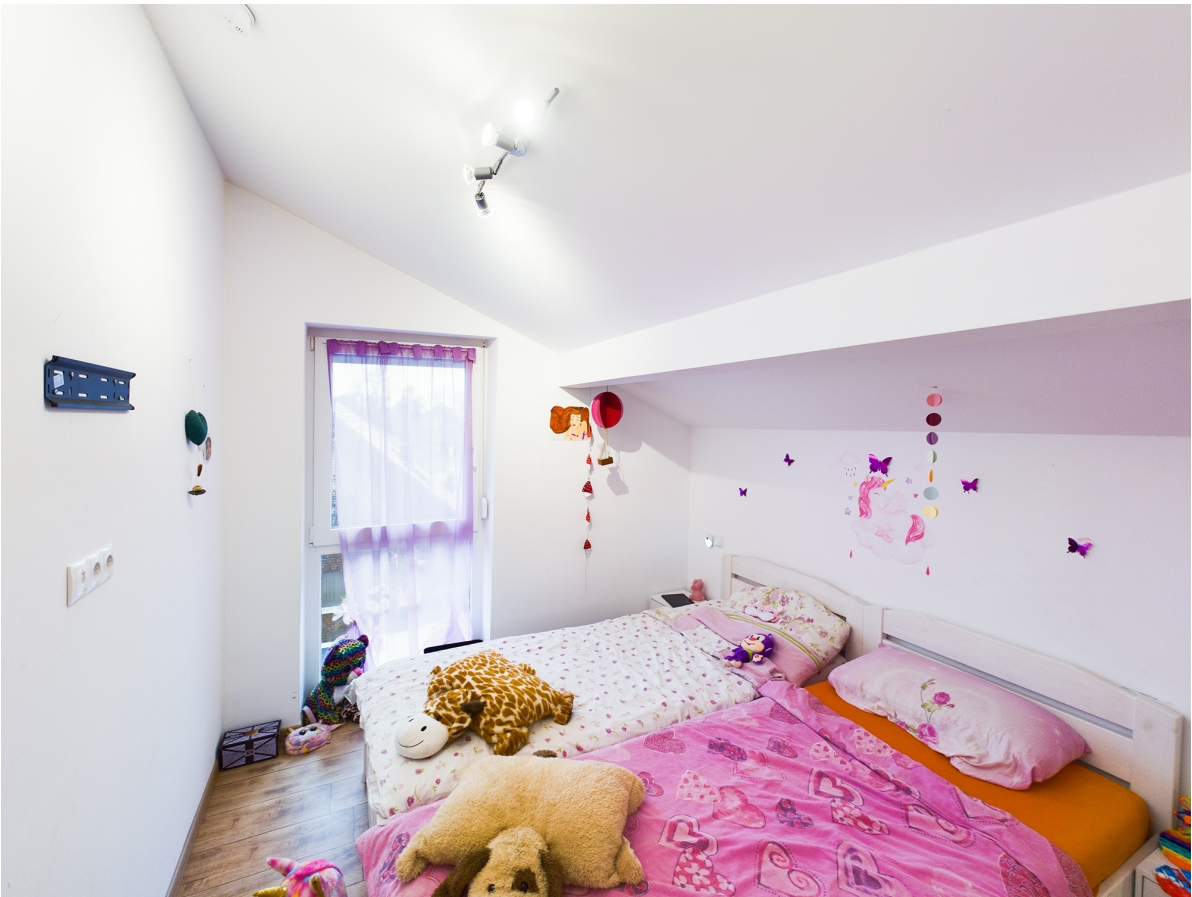
Zimmer Top 3