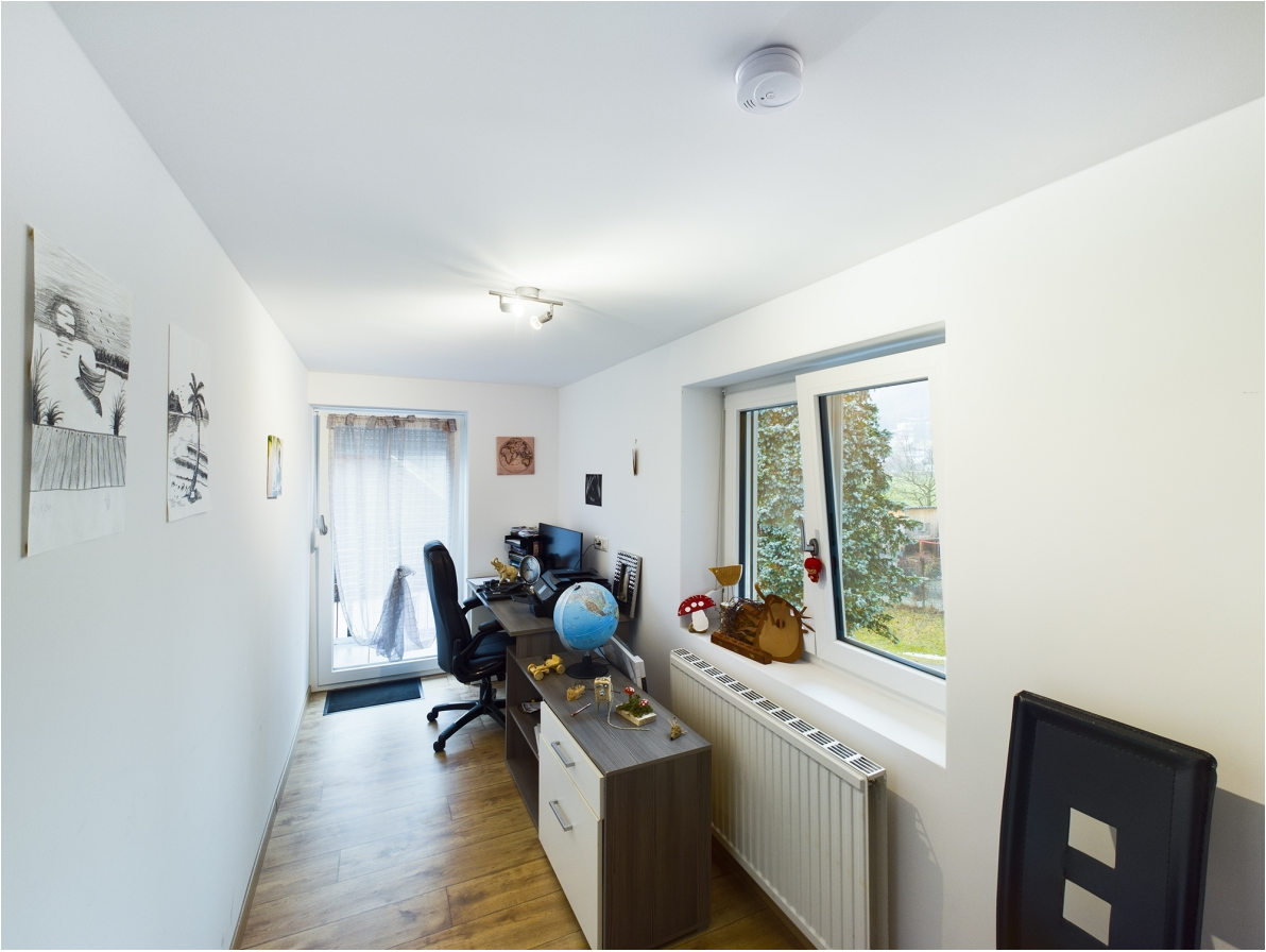
Zimmer Top 3