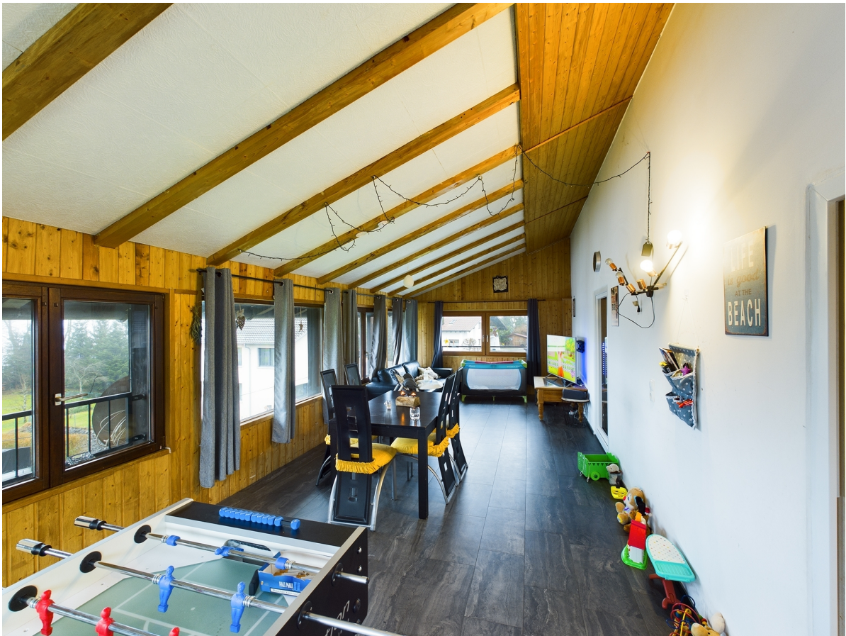
Wohn- / Spielzimmer Top 3