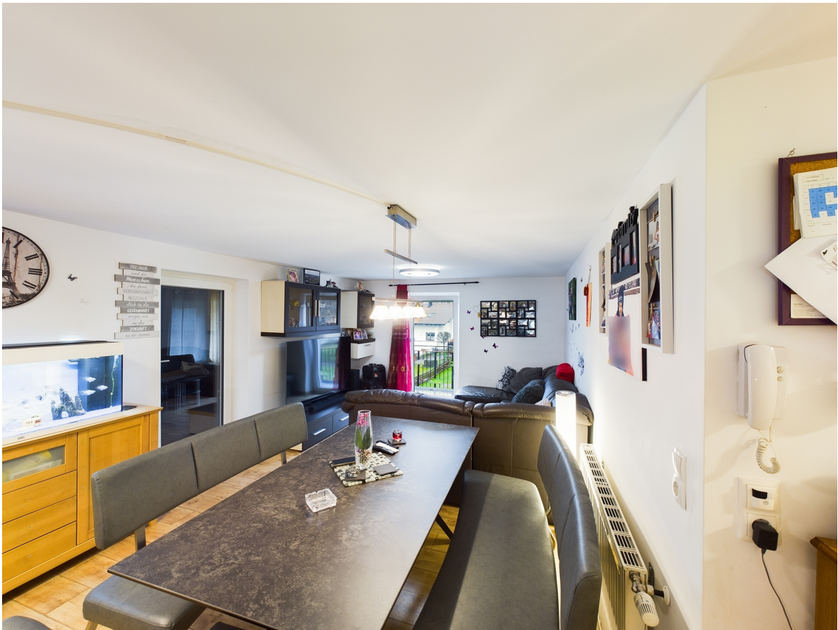
Esszimmer Top 3