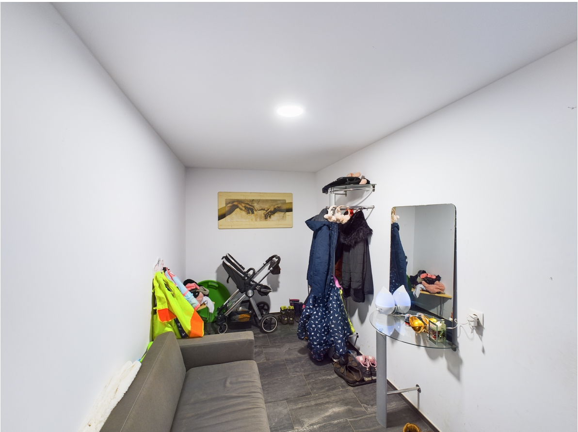
Eingangsbereich Top 3