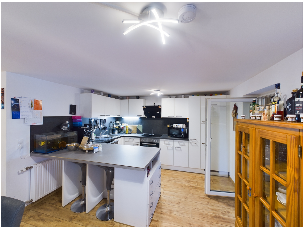
Küche Top 3