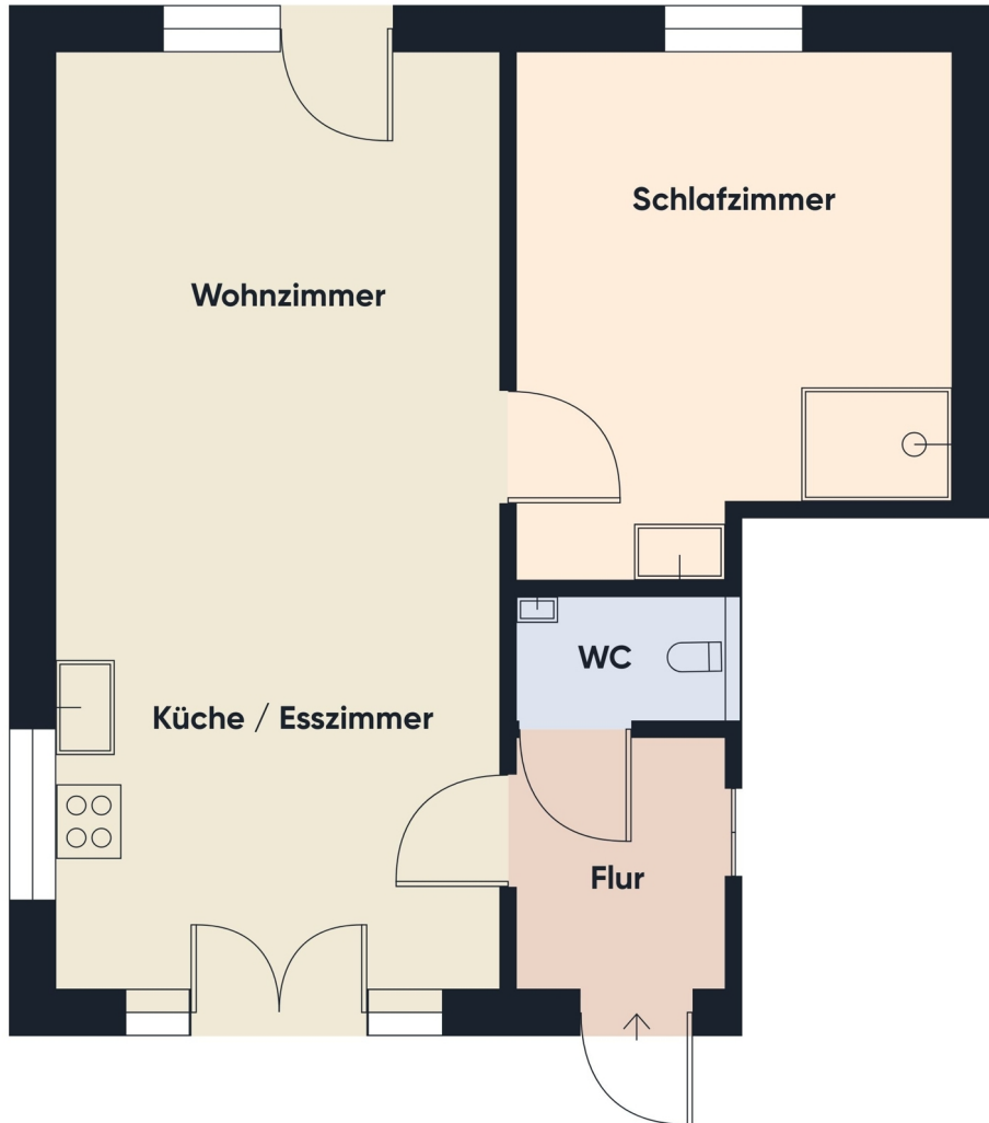
Grundriss EG Top 1