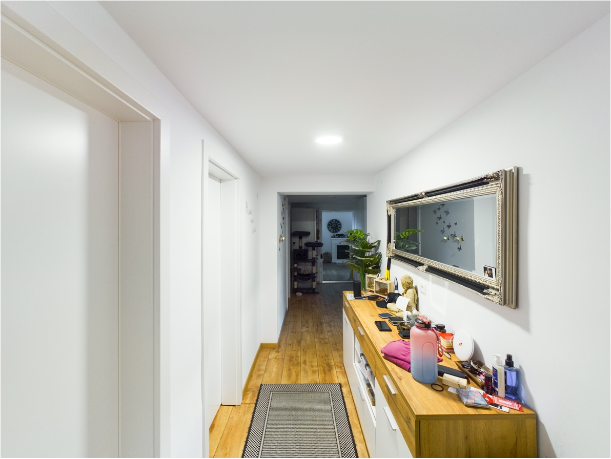
Flur Top 2