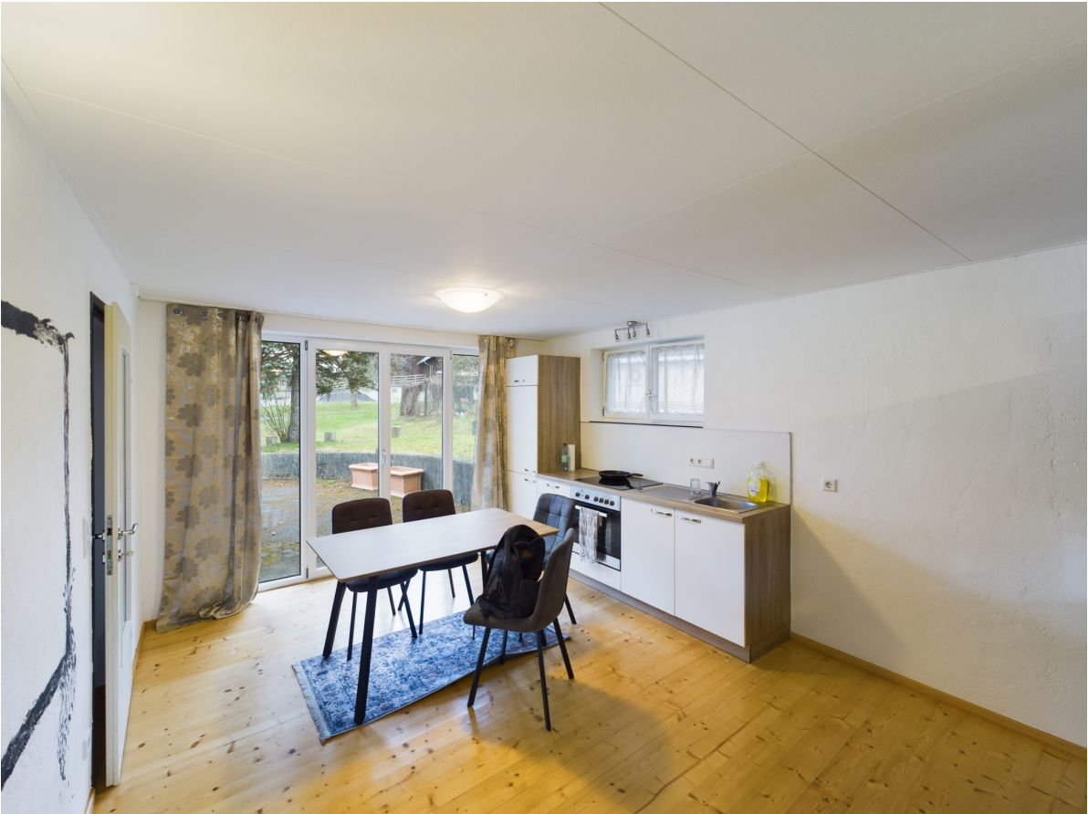
Küche Top 1