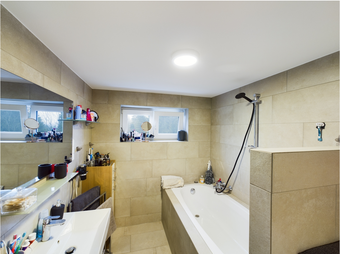
Badezimmer Top 3