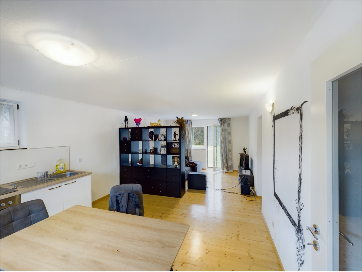
Ess- / Wohnbereich Top 1