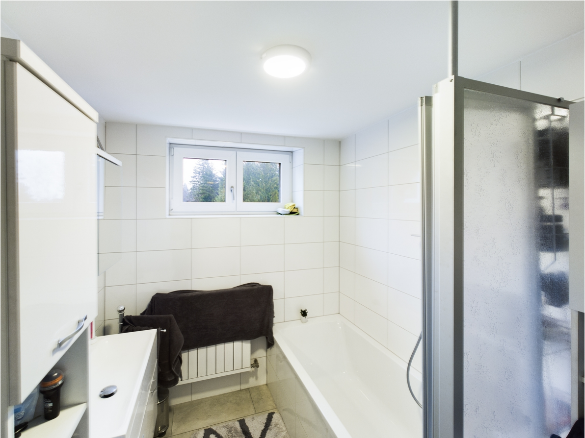
Badezimmer Top 2