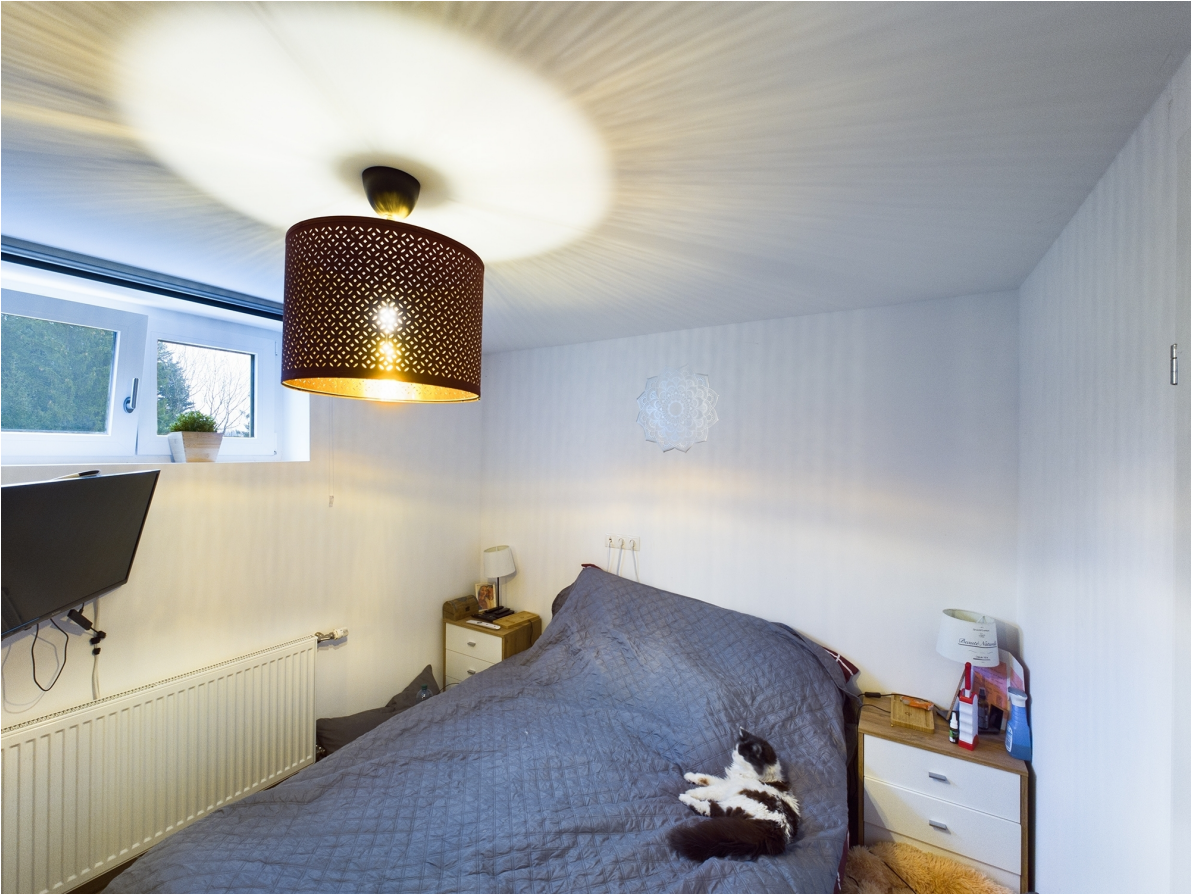
Schlafzimmer Top 2