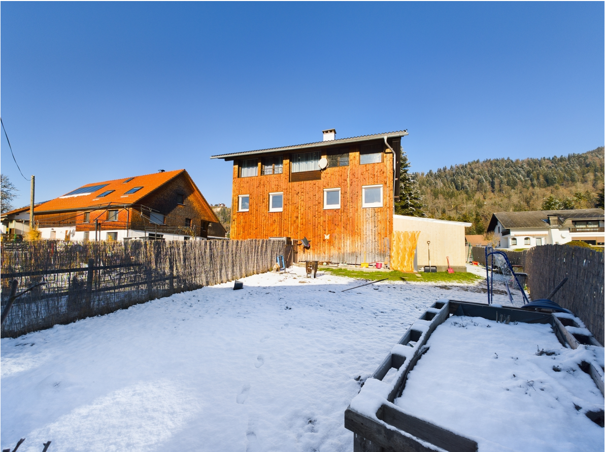
Garten Top 3