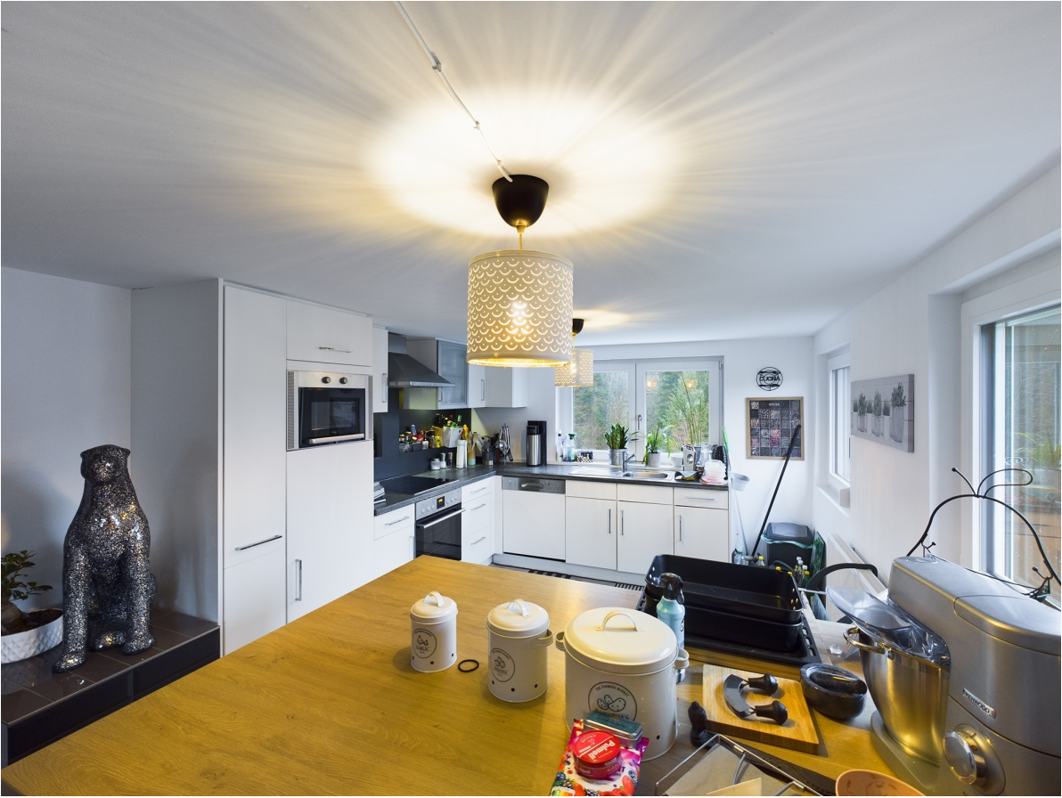
Küche Top 2