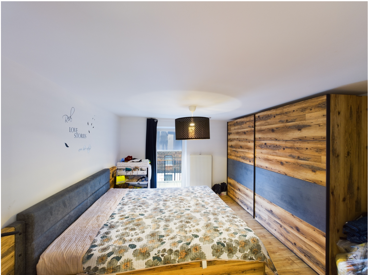
Schlafzimmer Top 3