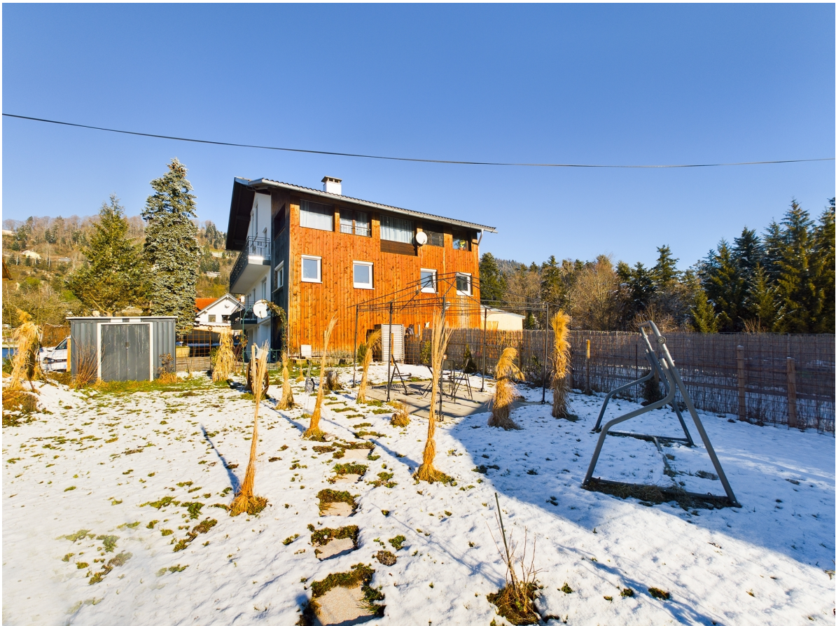
Garten Top 2