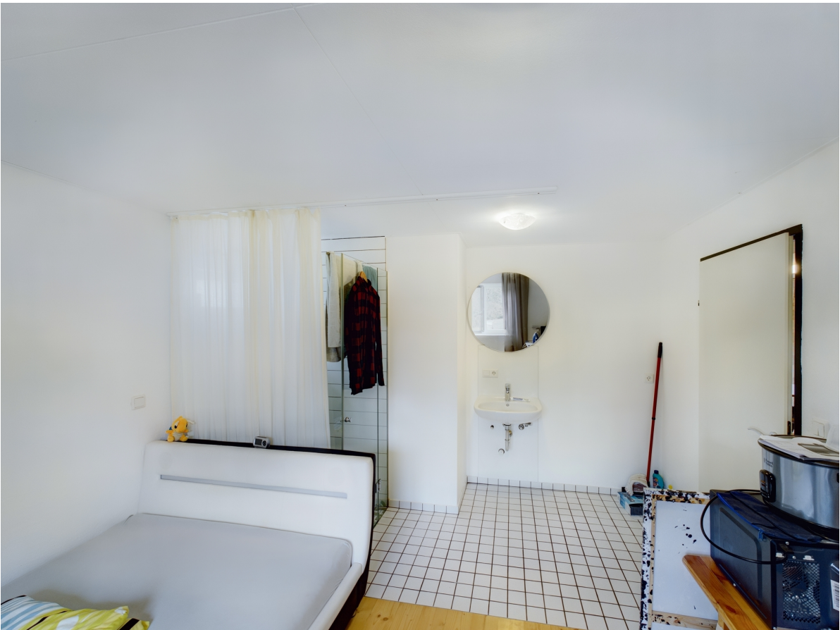
Bad Top 1