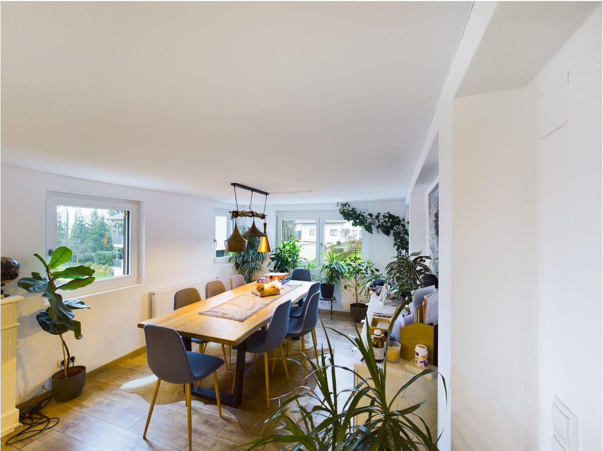
Esszimmer Top 2