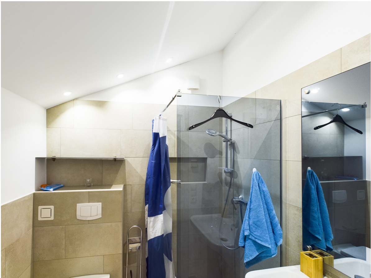
Gästebad Top 3