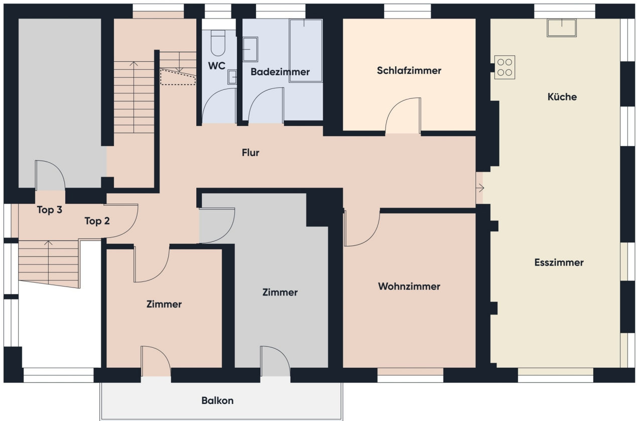
Grundriss 1. OG