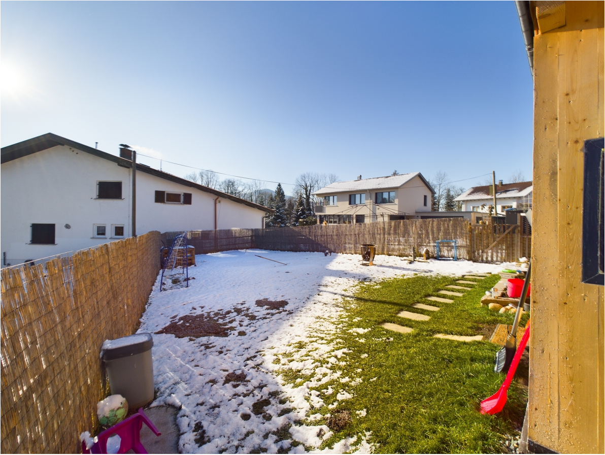
Garten Top 3