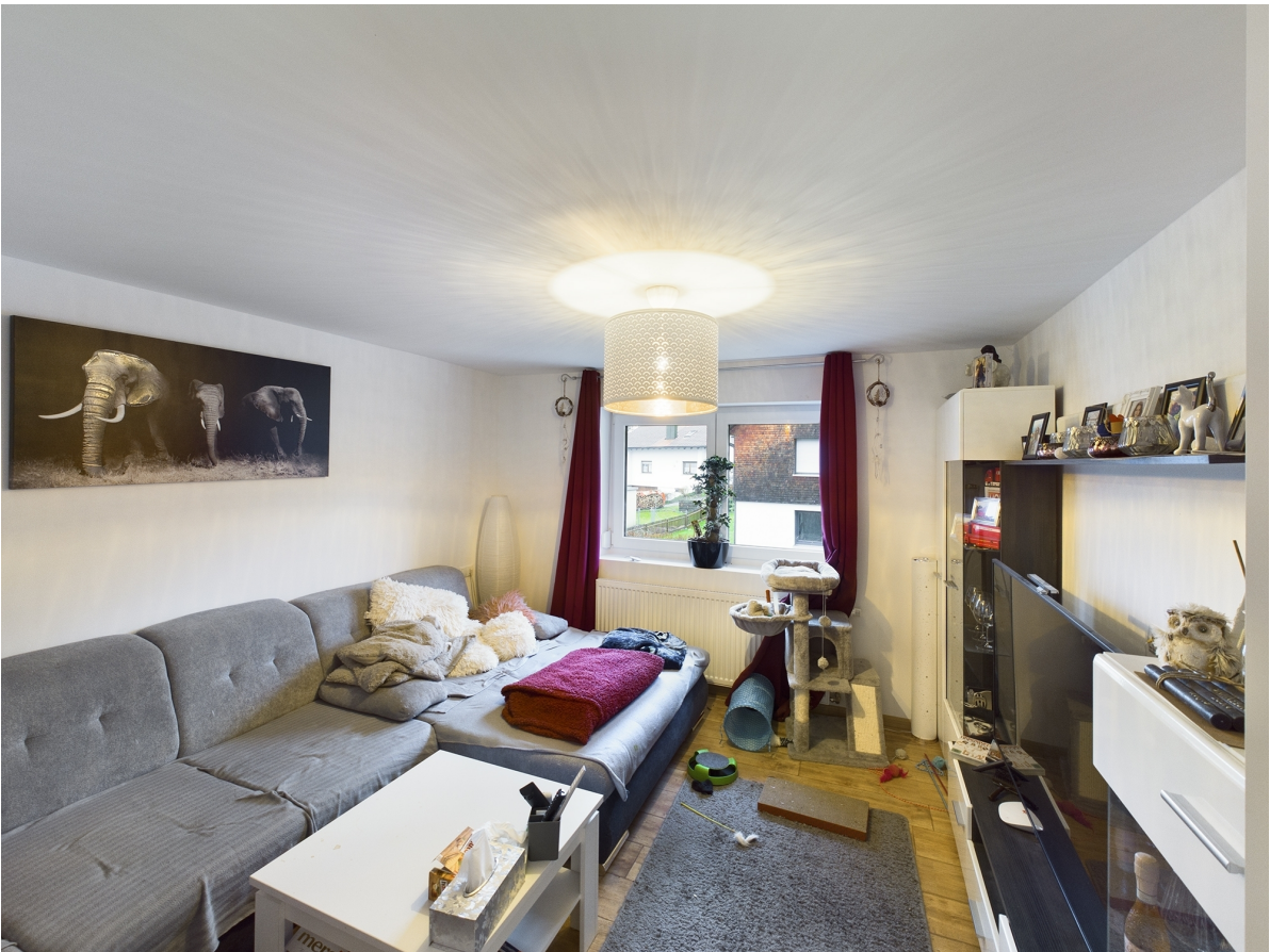
Wohnzimmer Top 2