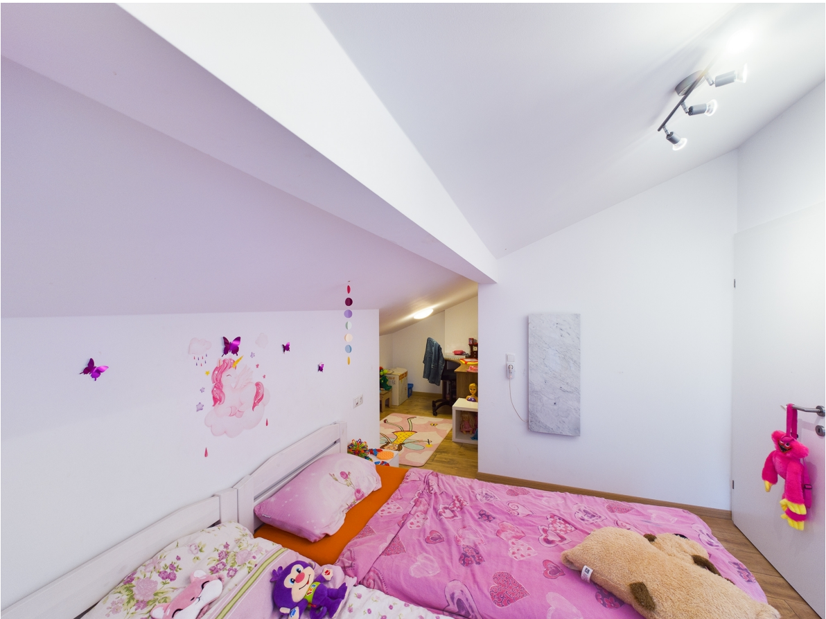
Zimmer Top 3