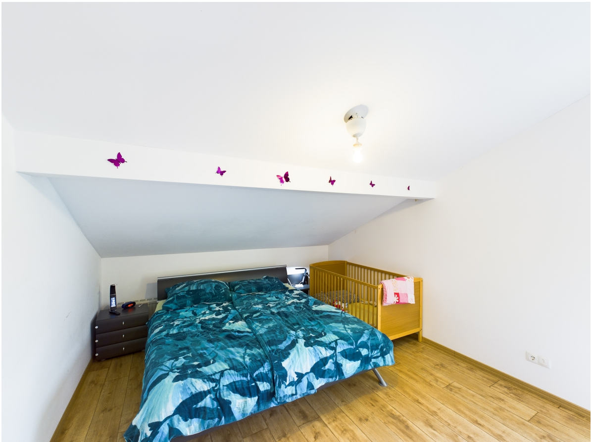
Zimmer Top 3