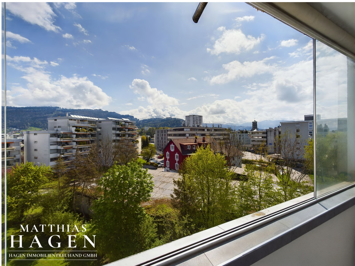
Aussicht Balkon 1