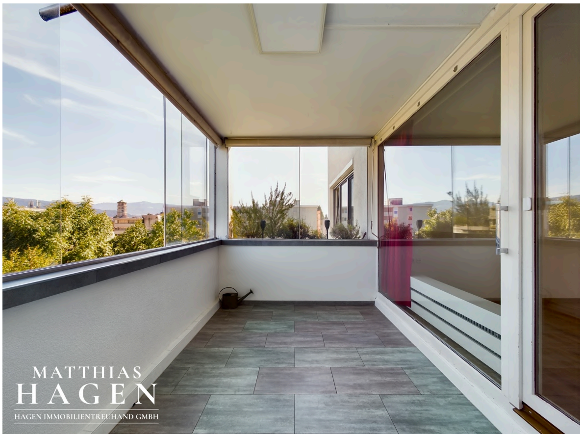
Verglaster Balkon 1