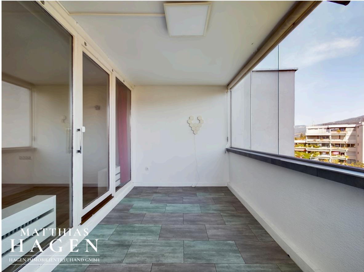
Verglaster Balkon 1