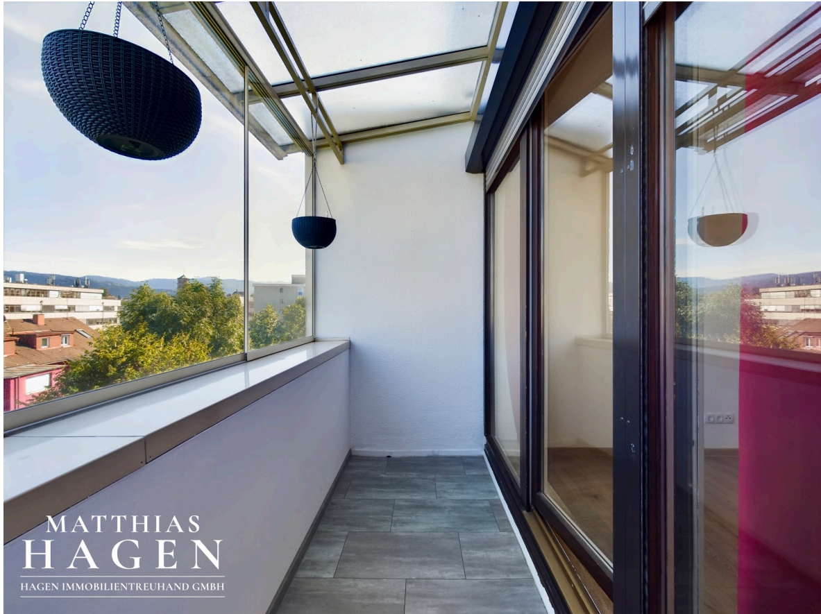
Verglaster Balkon 3