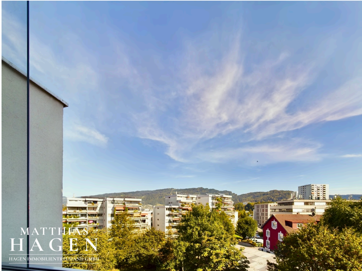
Verglaster Balkon 1 Aussicht