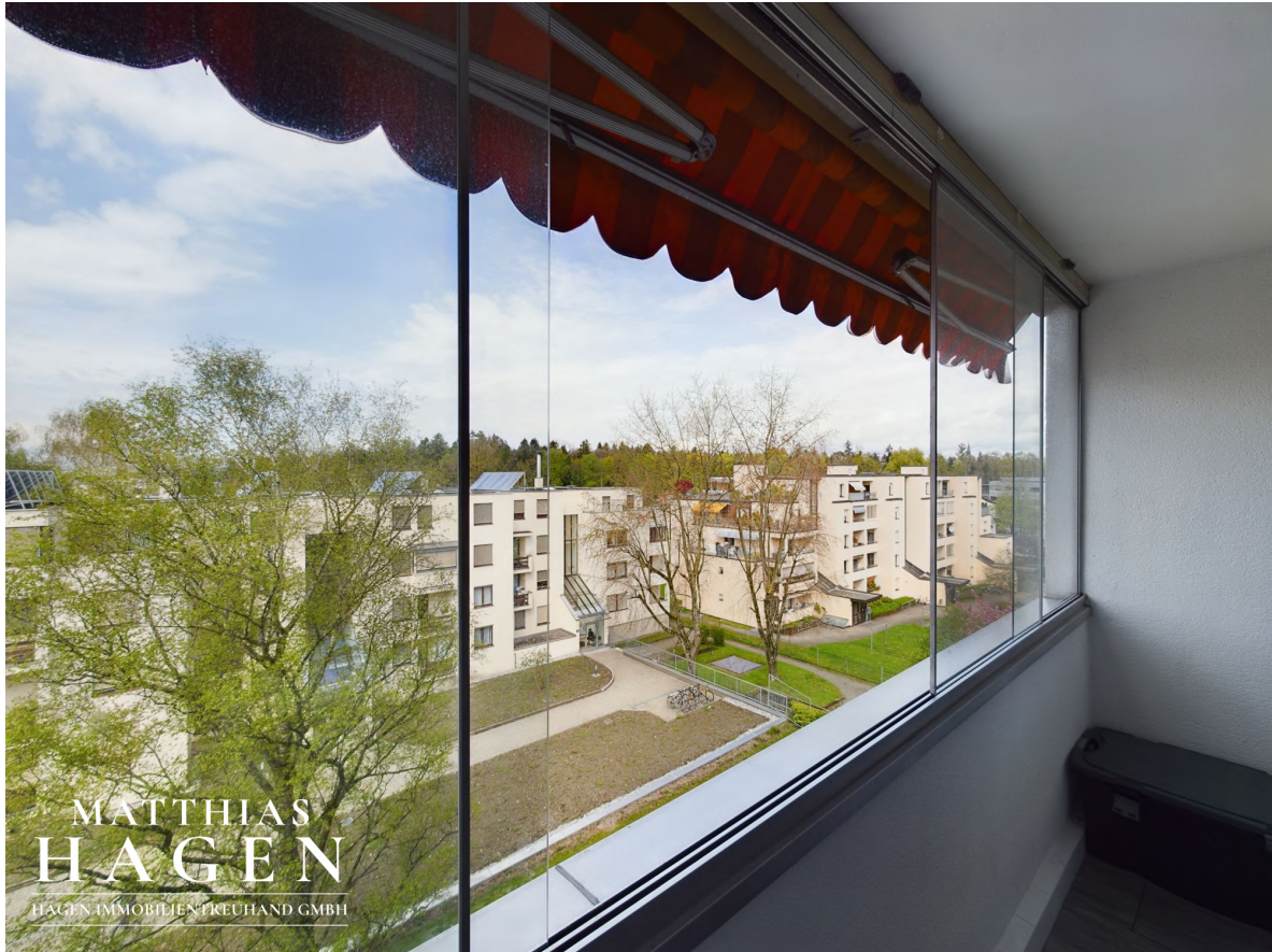
Verglaster Balkon 1