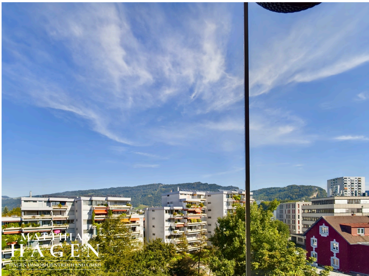
Verglaster Balkon 3 Aussicht