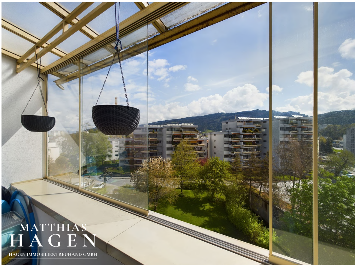
Verglaster Balkon 3