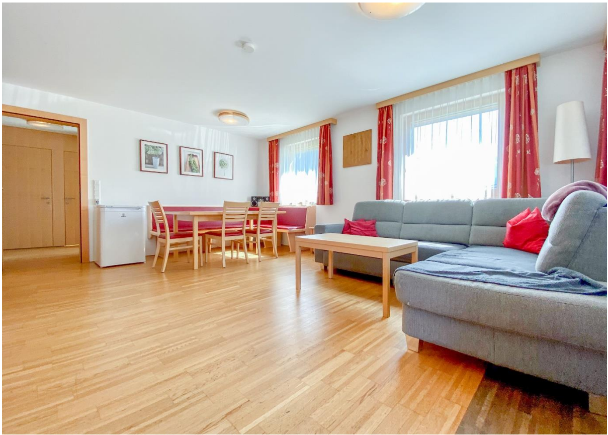
Freundliches, helles Wohnzimmer