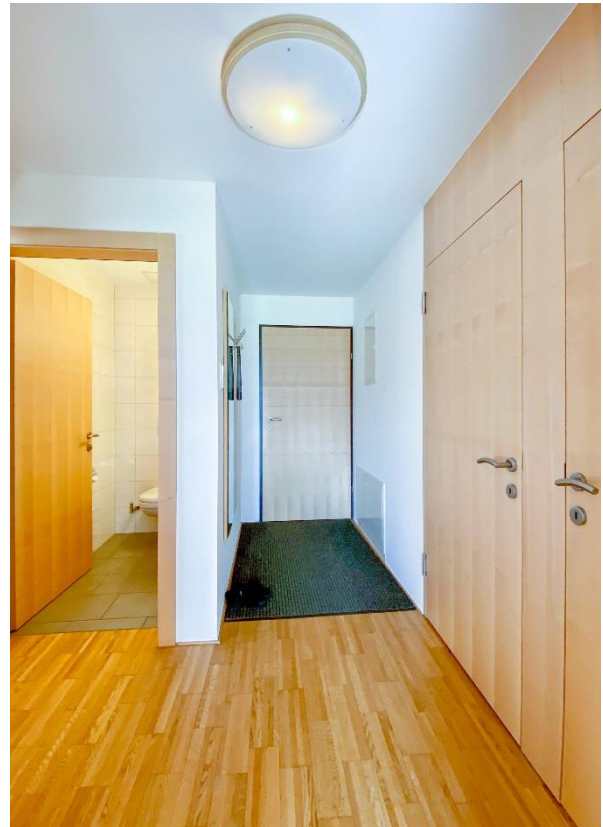
Flur / WC