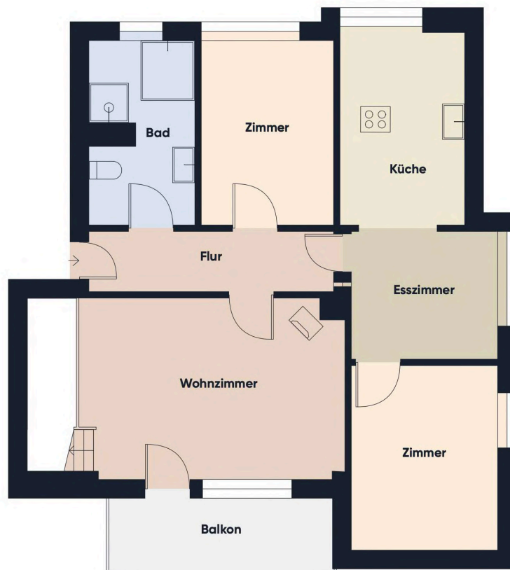
Grundrissplan ohne Maßstab