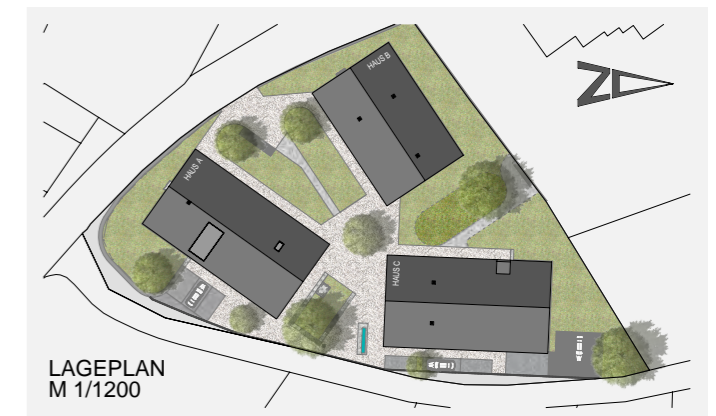
LAGEPLAN M 1/1200