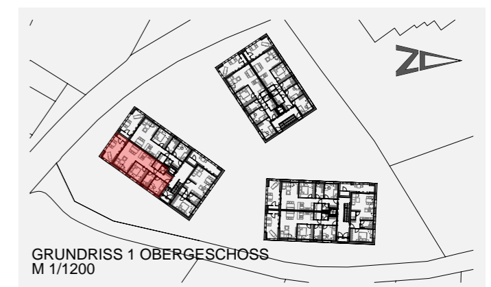
GRUNDRISS 1 OBERGESCHOSS M 1/1200