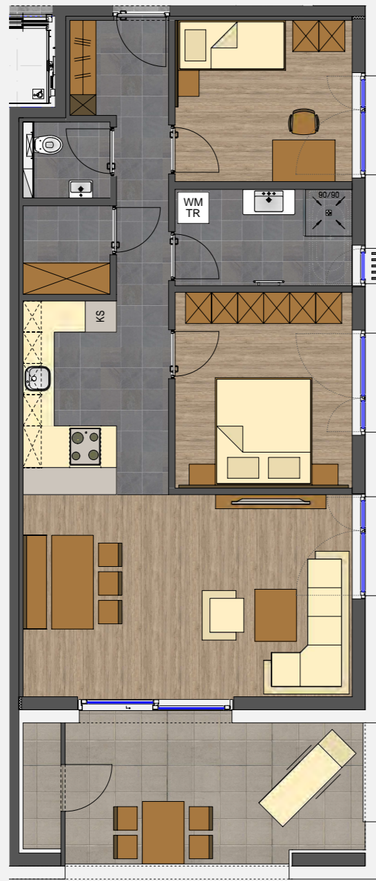
BEISPIEL M 1/100