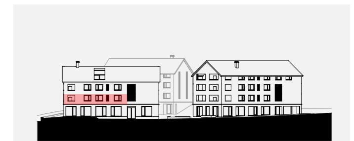
ANSICHT SÜDOST M 1/1000