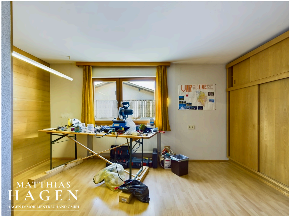
Zimmer 4 OG