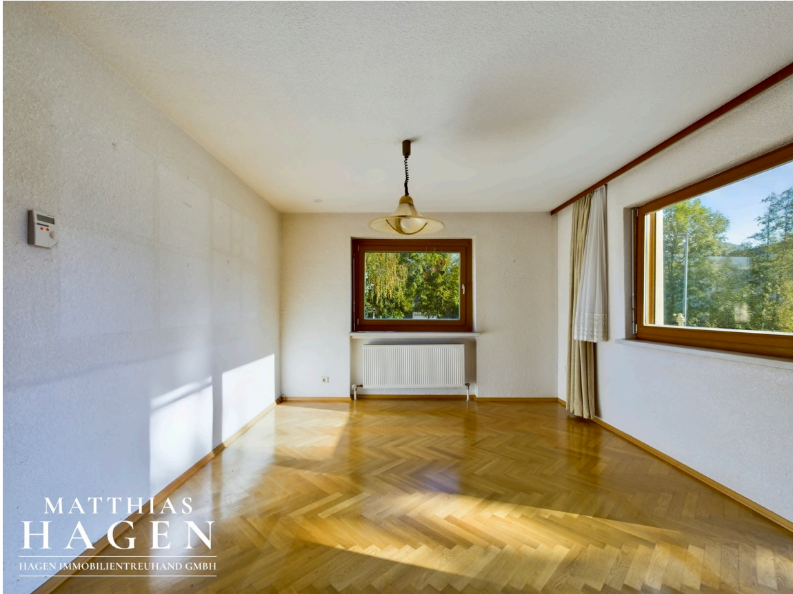
Zimmer 1 OG