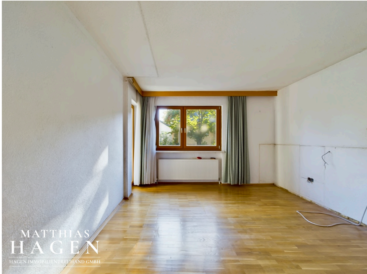
Zimmer 2 OG