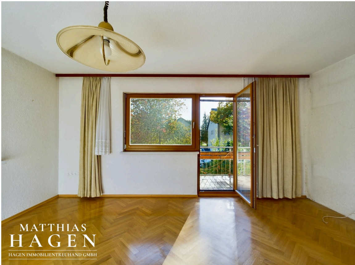
Zimmer 1 OG