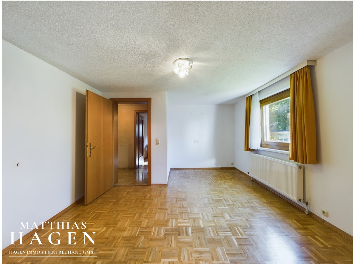
Zimmer 5 EG