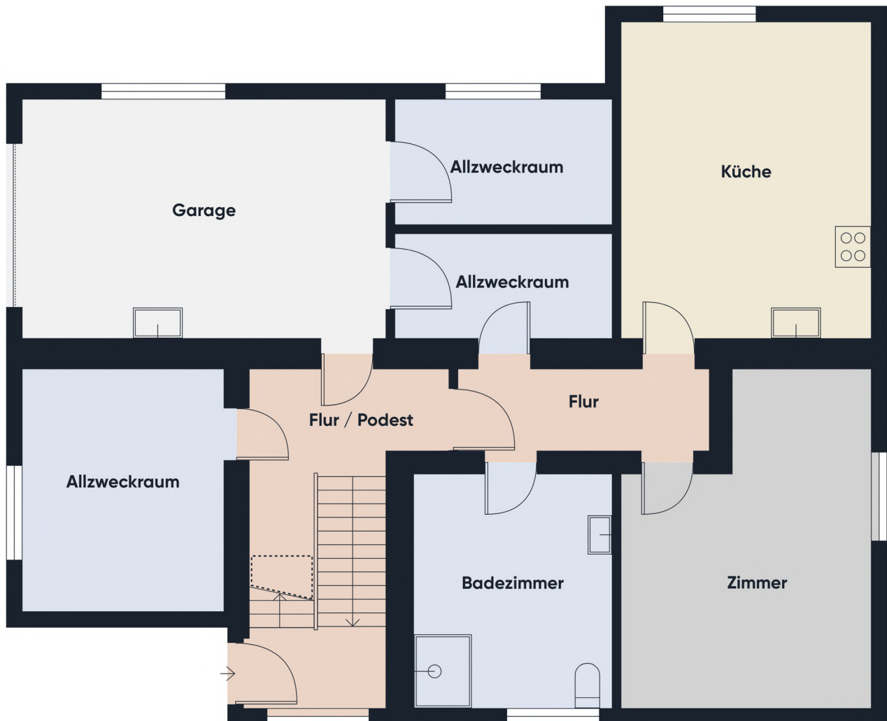
Grundrissplan ohne Maßstab EG