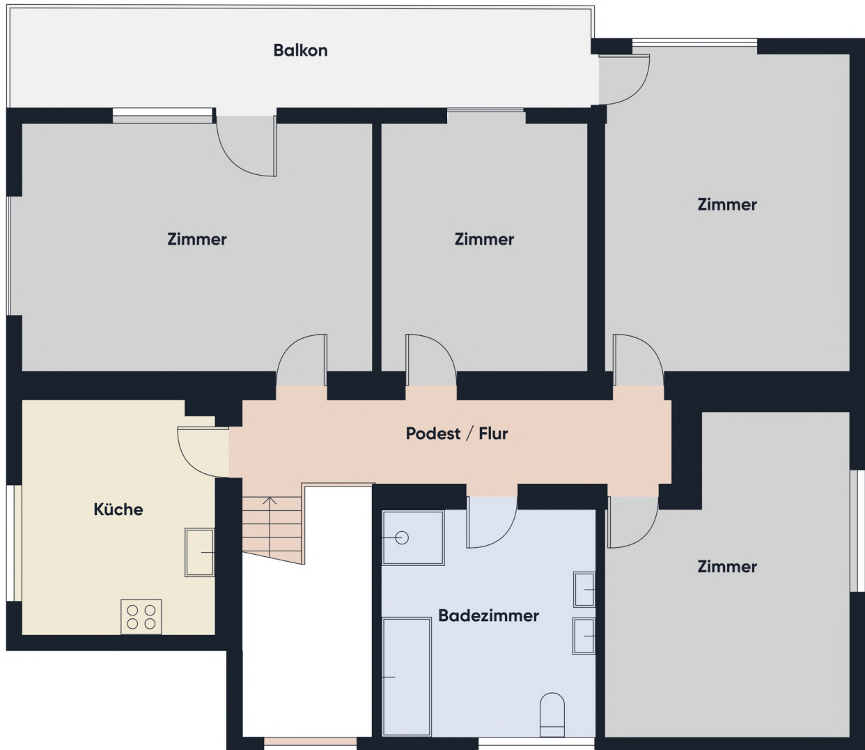
Grundrissplan ohne Maßstab OG