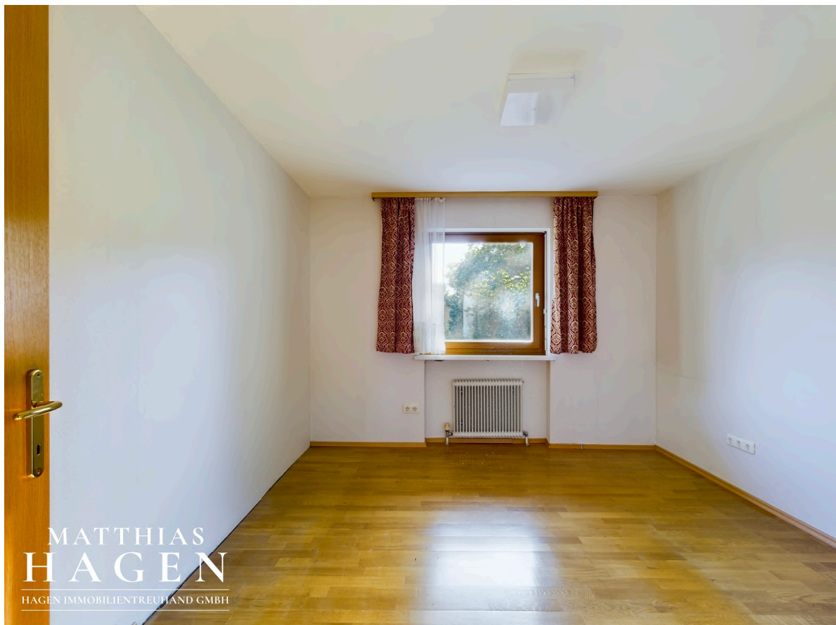
Zimmer 3 OG