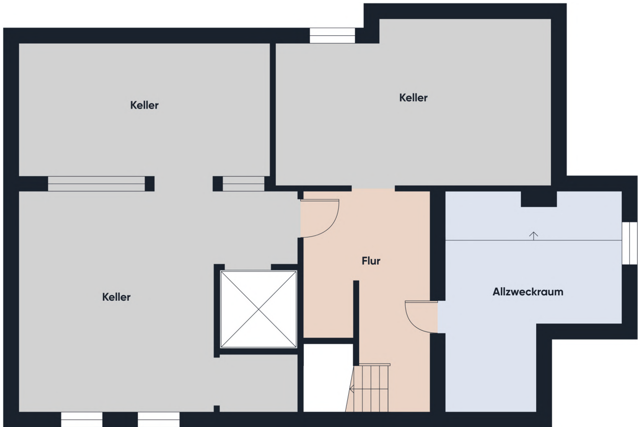
Grundrissplan ohne Maßstab KG