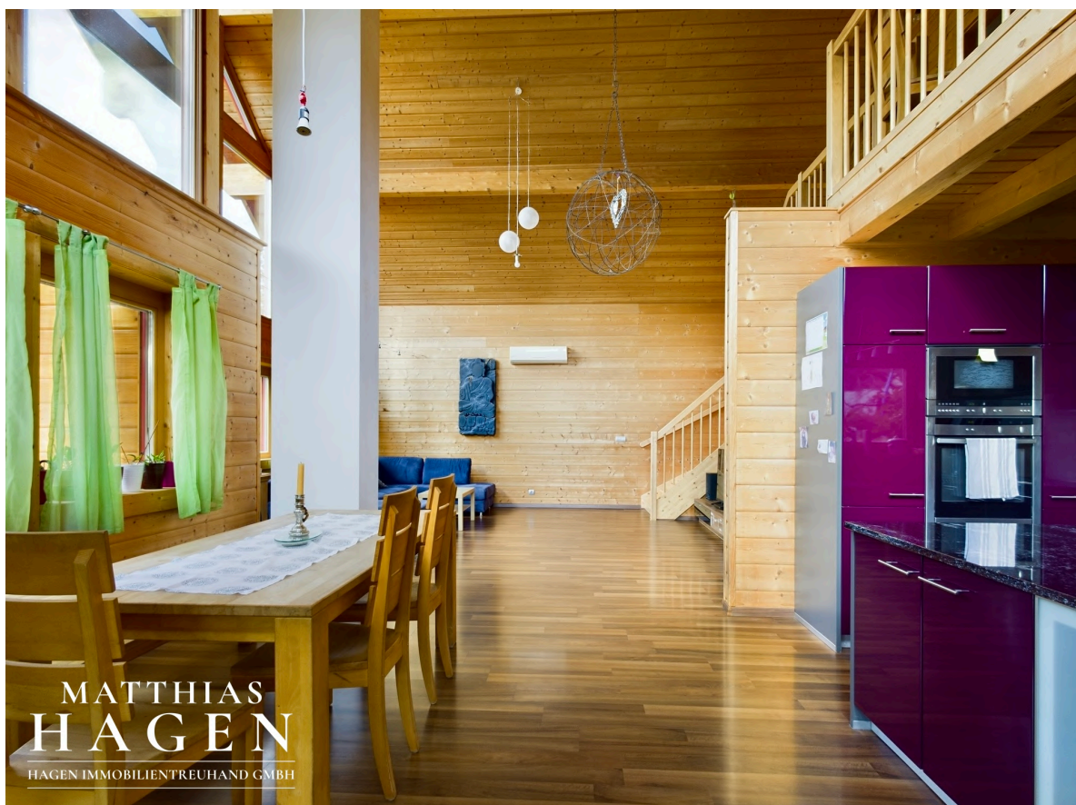
Wohnbereich mit Küche