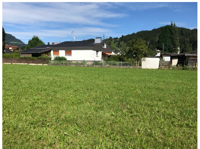
Blick nach Osten