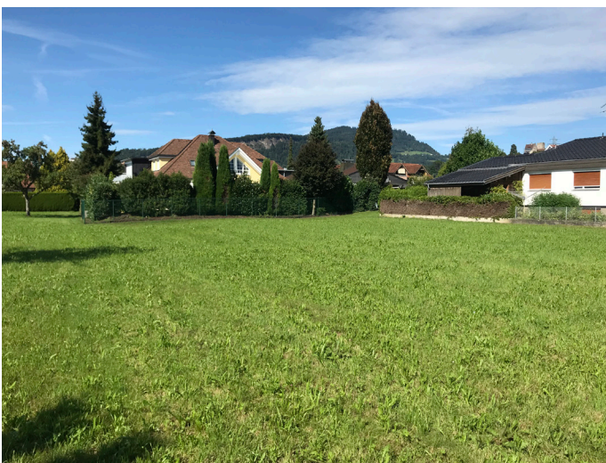
Blick nach Norden