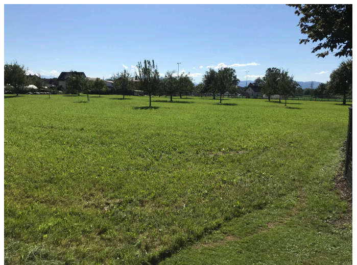
Blick nach Westen