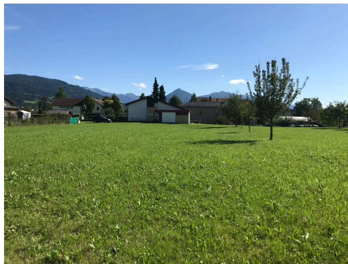
Blick nach Süden