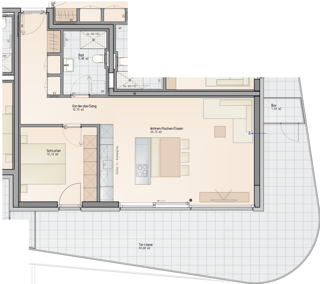
Grundrissplan ohne Maßstab

Wohnfläche: 62.61m 2 / Terrasse: 42.93m 2 / Box: 1.91m 2