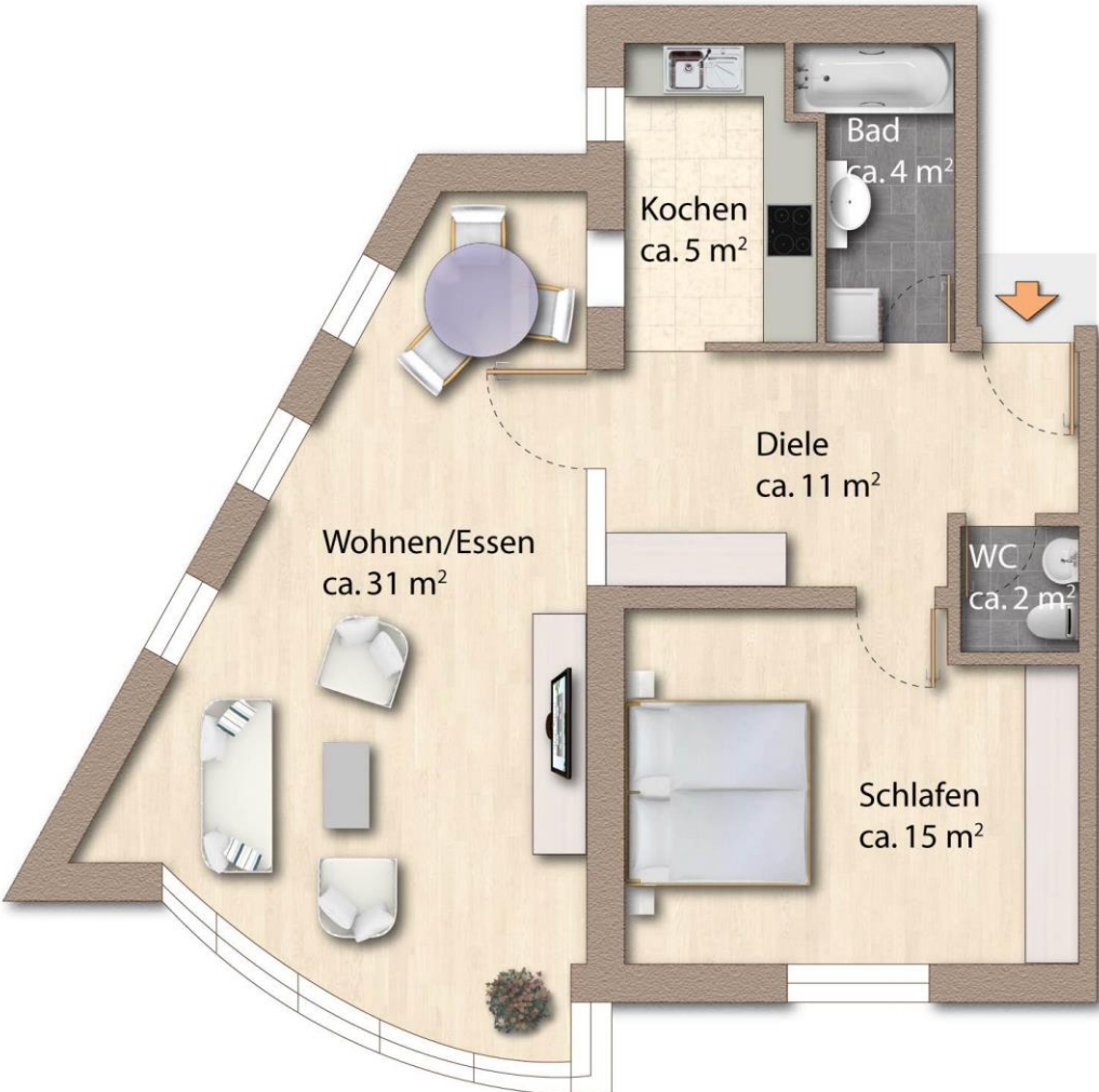
Grundriss mit ca. Maßangaben