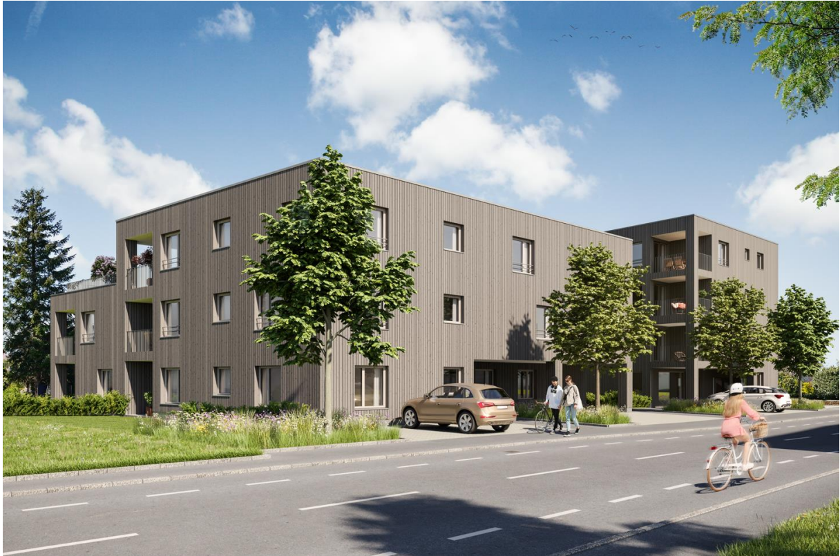
Haus B links, Haus A rechts Hadeldorfstraße 17