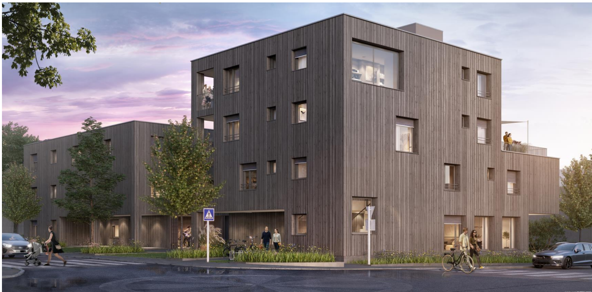
Haus B links, Haus A rechts, Ecke Hadeldorfstraße/Landammanngasse

Ein Neubau zum Wohlfühlen in zentraler Wohnlage, mit schönen Sonnenterrassen, Privatgärten, hochwertige Ausstattung, schlüsselfertige Ausführung, alle Wohnungen sind barrierefrei, alters- und behindertengerecht natürlich mit Lift.