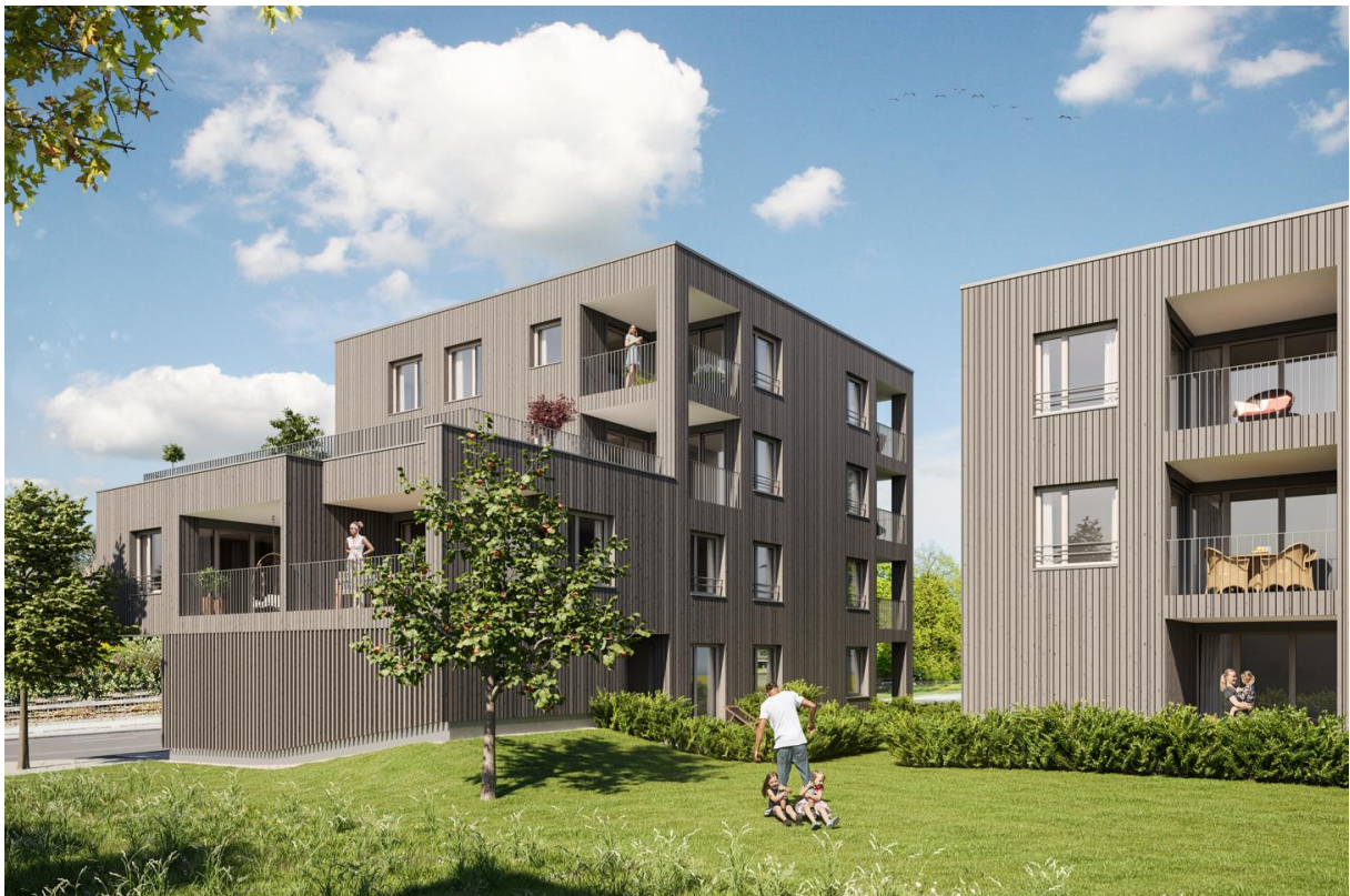
Haus A links, Haus B rechts