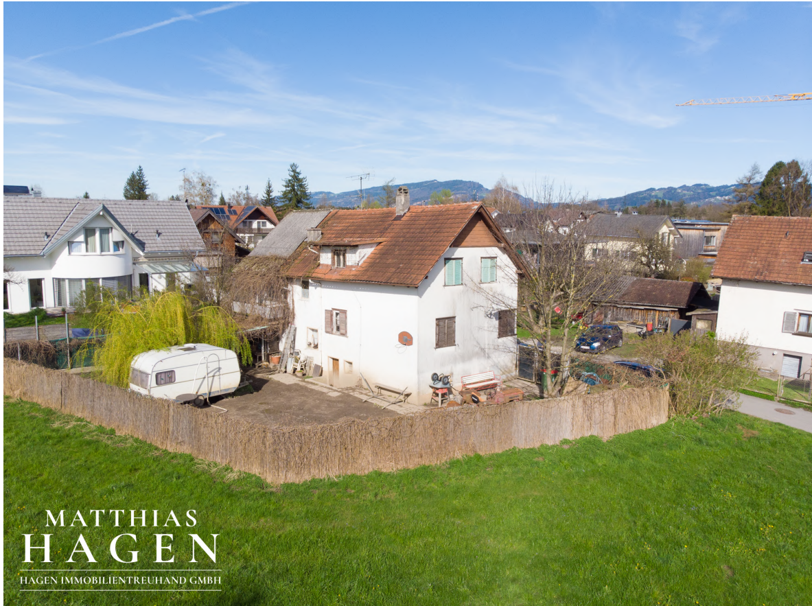
Grundstück mit Altbestand