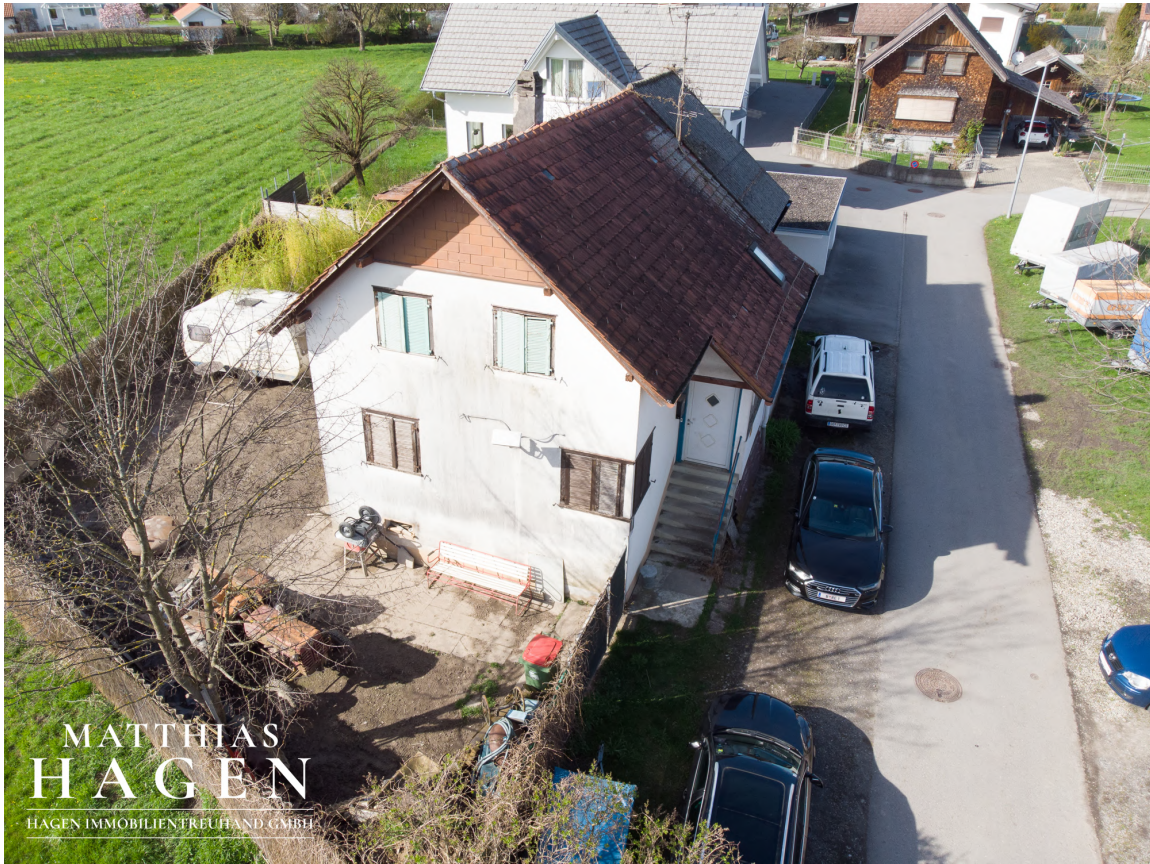
Grundstück mit Altbestand