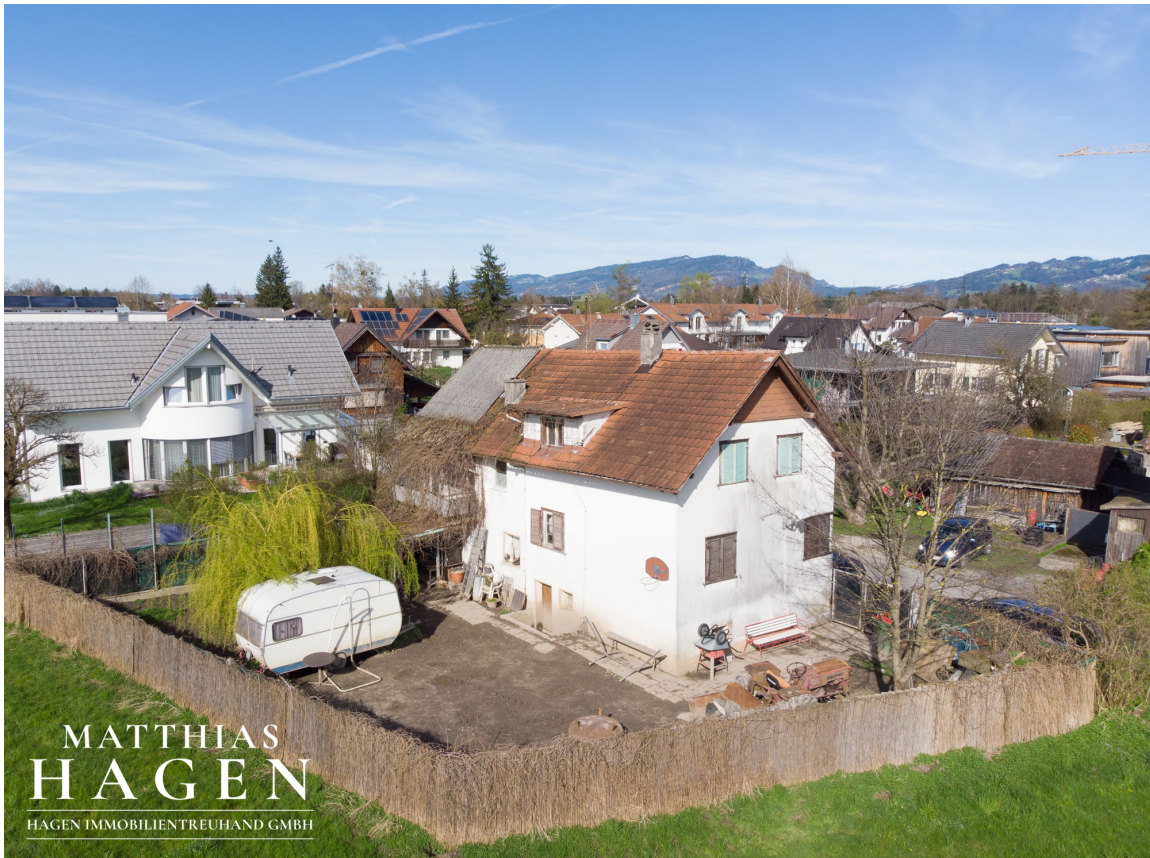
Grundstück mit Altbestand