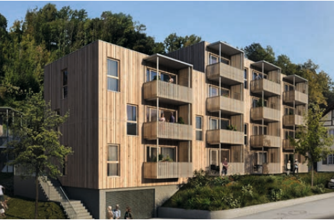
↓ Müllerstraße, Dornbirn