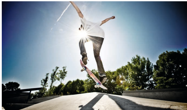
← Finnenbahn (links) und Skatepark Oberau