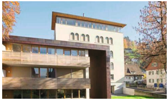
↑ Magazin Oberdorf, Dornbirn