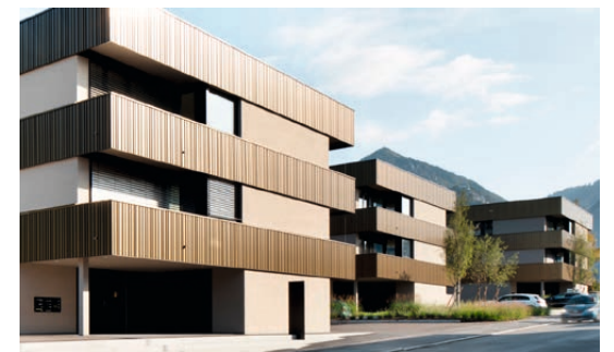
↑ Quartier Bündlitten, Dornbirn