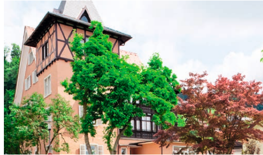
↓ Zanzenberggasse, Dornbirn