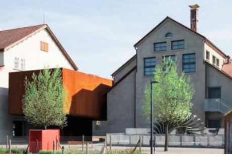
↑ Inatura, Dornbirn