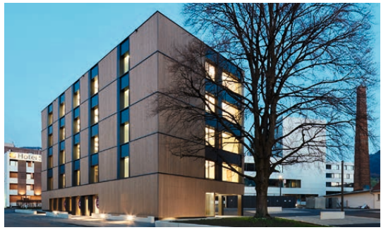
↑ Sägen, Dornbirn