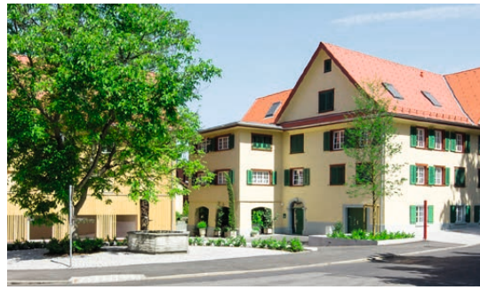
↑ Kirchgasse, Dornbirn