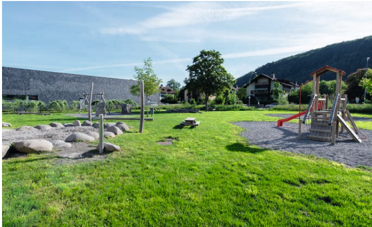
Waldbad Feldkirch →