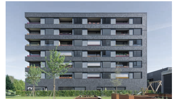
↓ Hämmerlestraße, Feldkirch

In allen Projekten, Geschäftsbeziehungen und Begegnungen unserer Mitarbeiter:innen mit Kund:innen und Partnern liegt Herzblut und Begeisterung für die Sache. Der persönliche Kontakt und der partnerschaftliche Umgang zu unseren Mieter:innen liegen uns sehr am Herzen. Überzeugen Sie sich selbst!