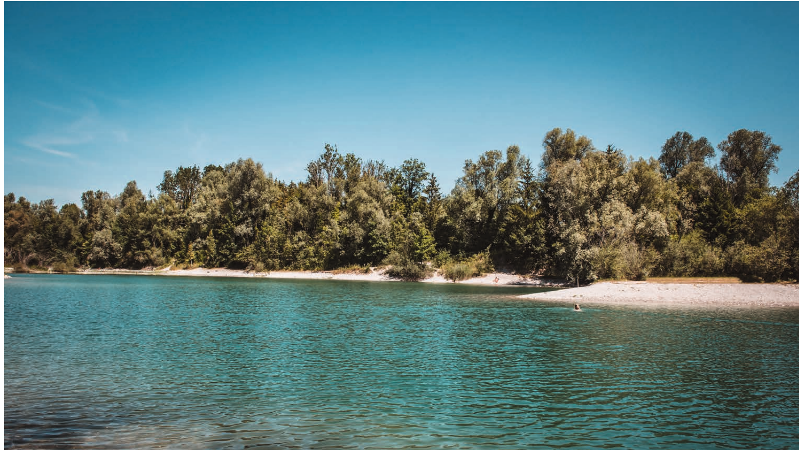
↑ Naturbadeseen Rüttenen (Baggerlöcher)