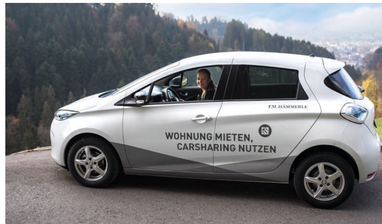
Caruso Carsharing →