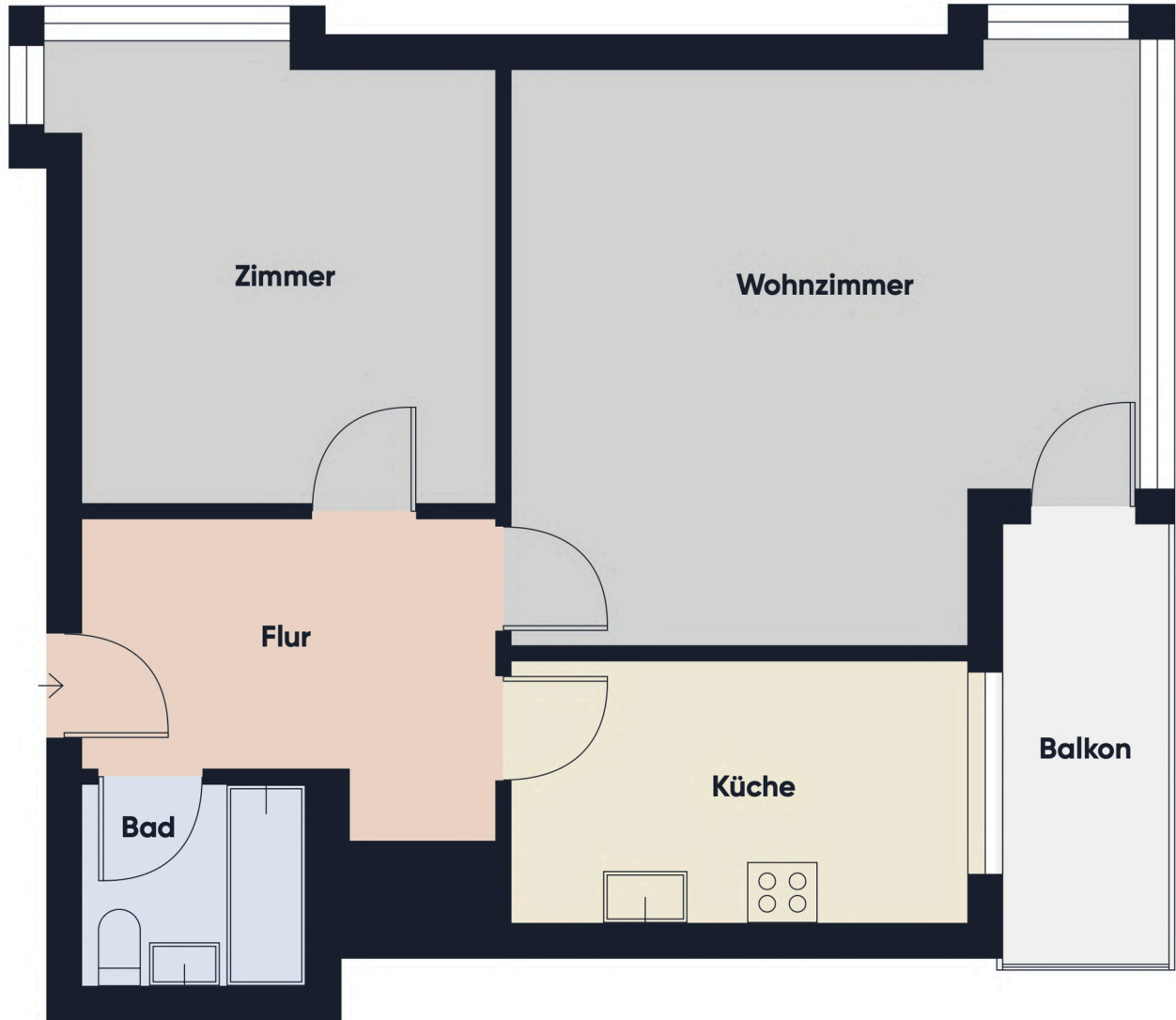
Grundrissplan ohne Maßstab