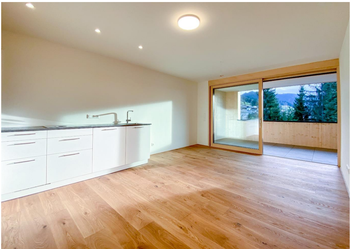
Zugang zur Terrasse