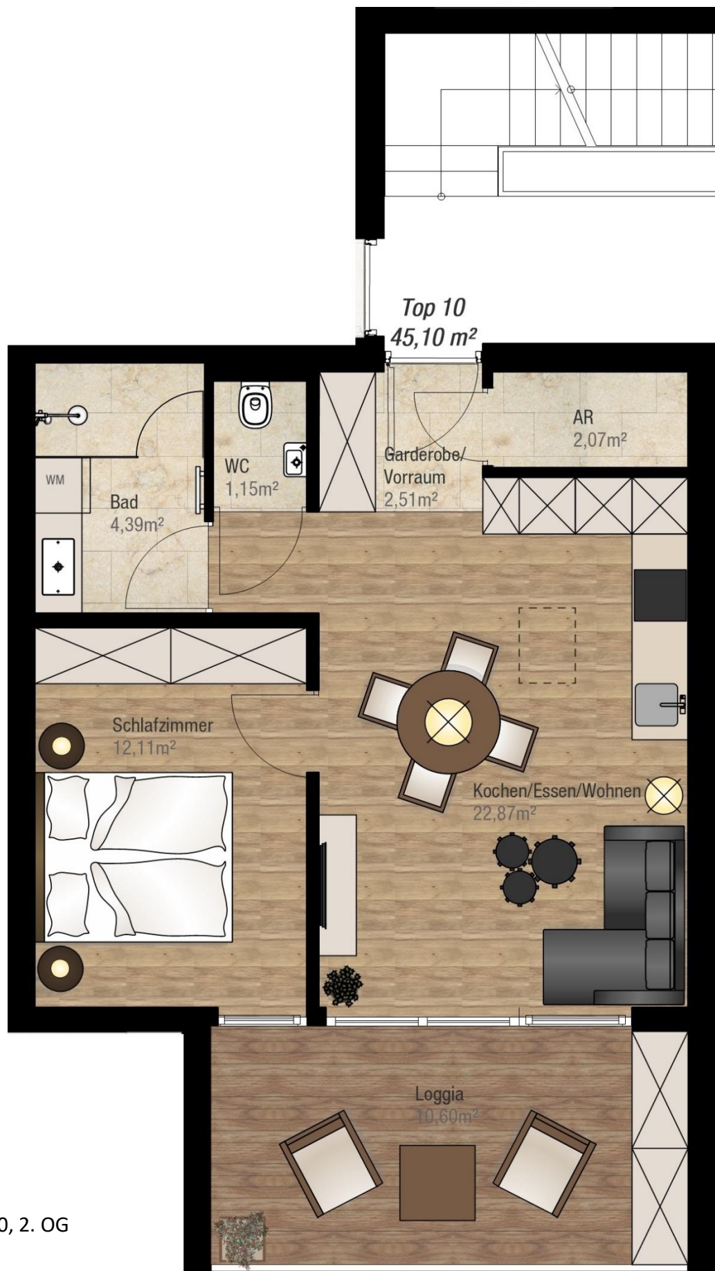
Grundriss Top 10, 2. OG