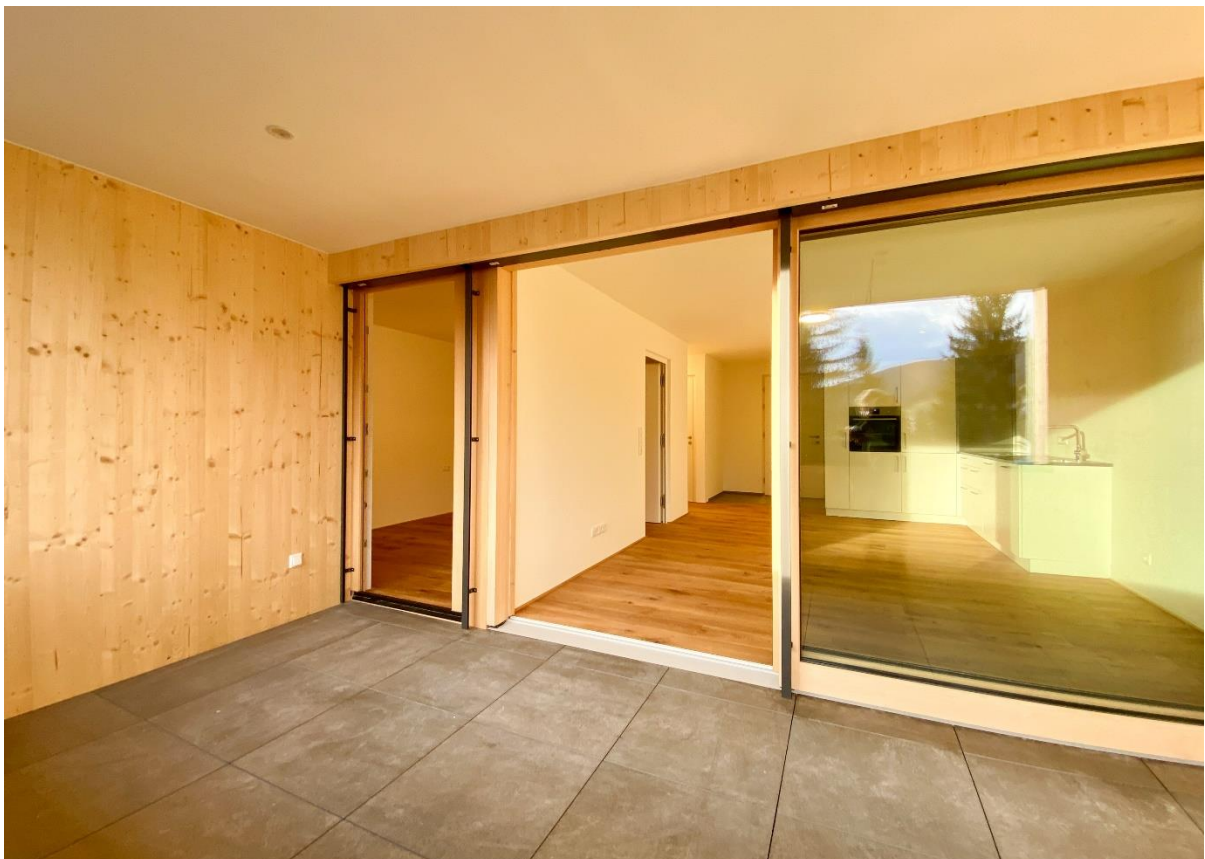
Zugang Wohnung / Loggia