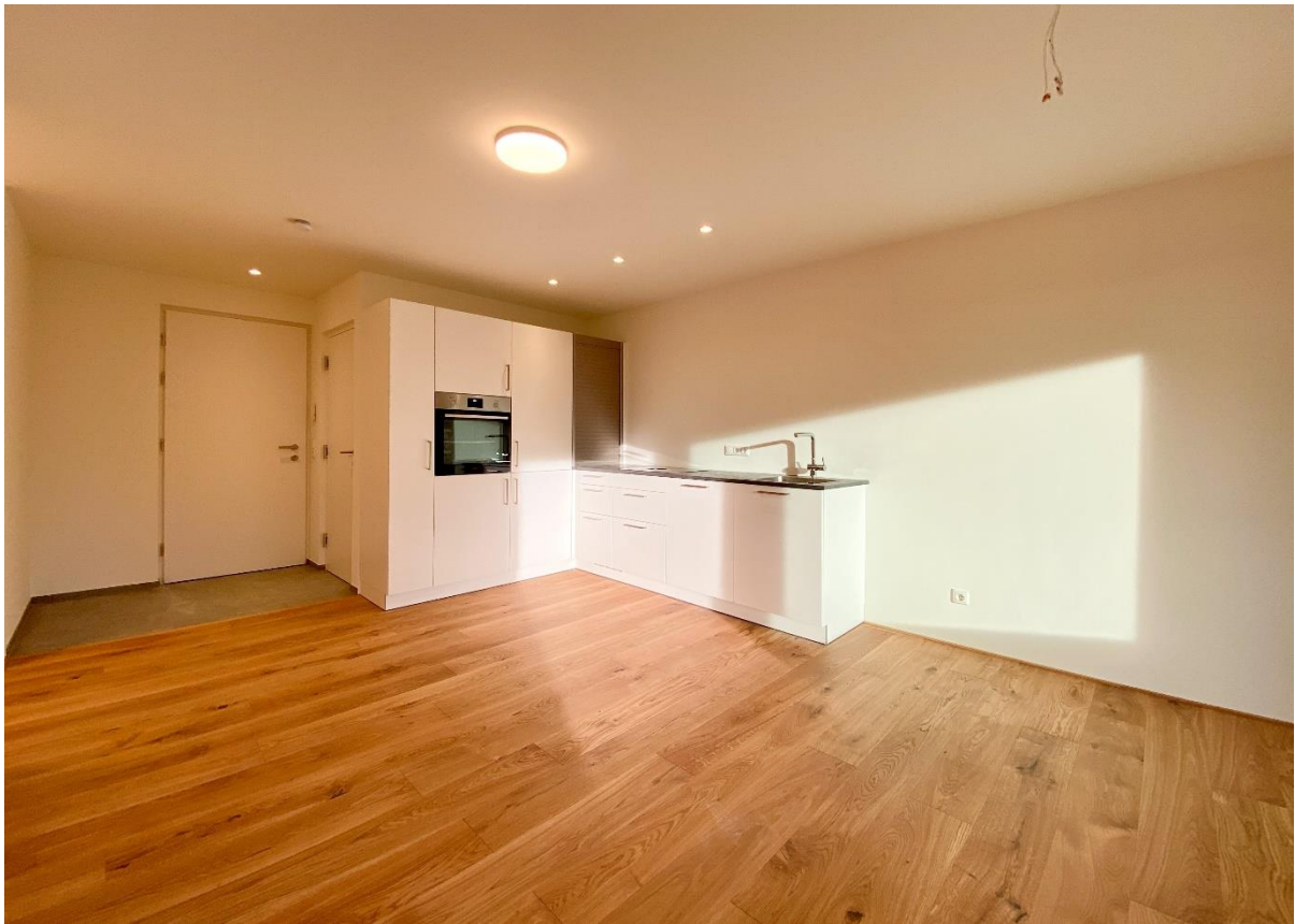
Küche mit Abstellraum dahinter