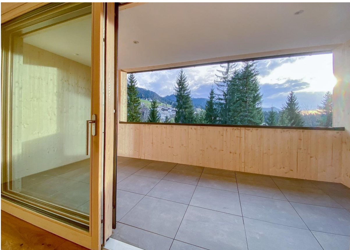
Loggia mit Ausblick