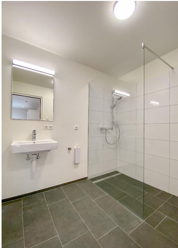
Badezimmer mit walk-in Dusche