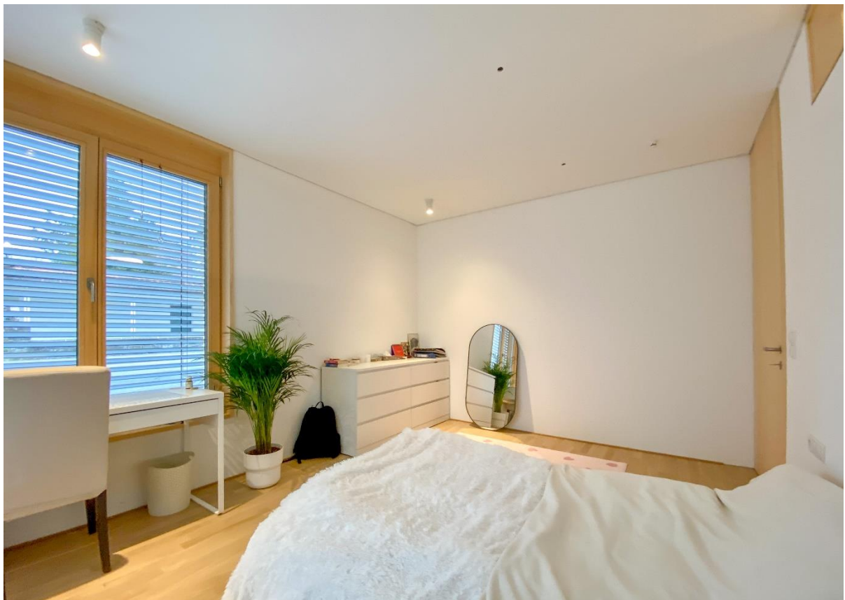
Zimmer 3 – sehr gut als Büro geeignet