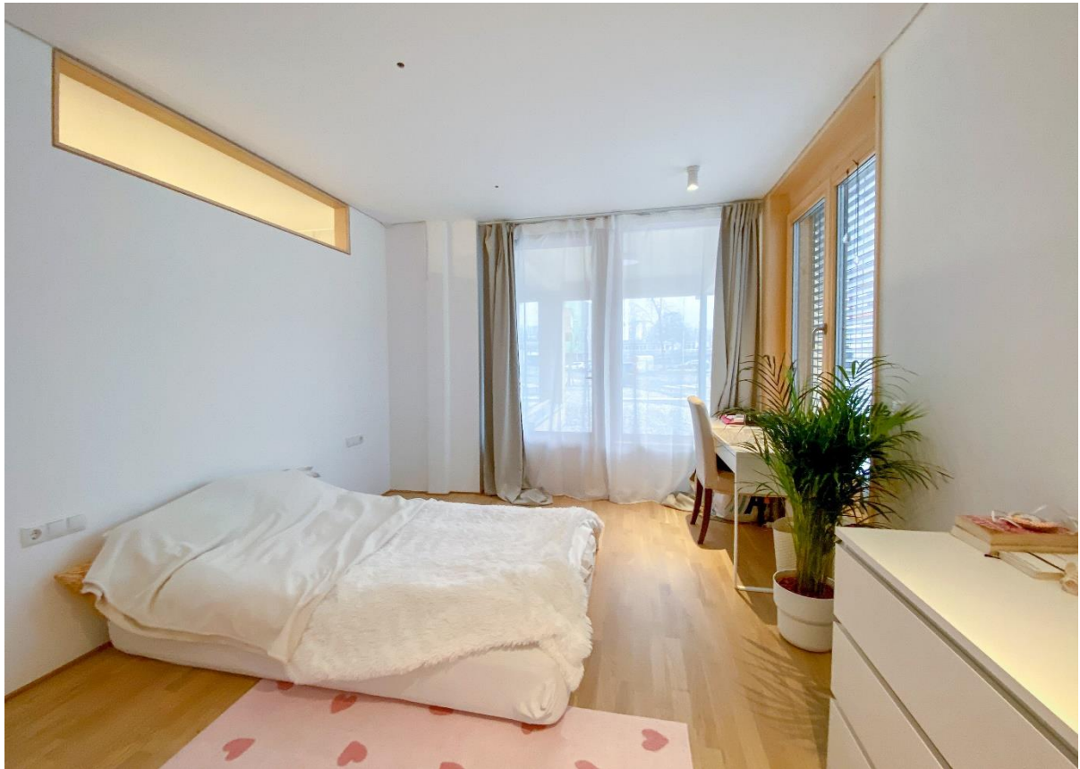
Zimmer 3 – Ostseite mit separatem Eingang; Oberlicht zum Bad