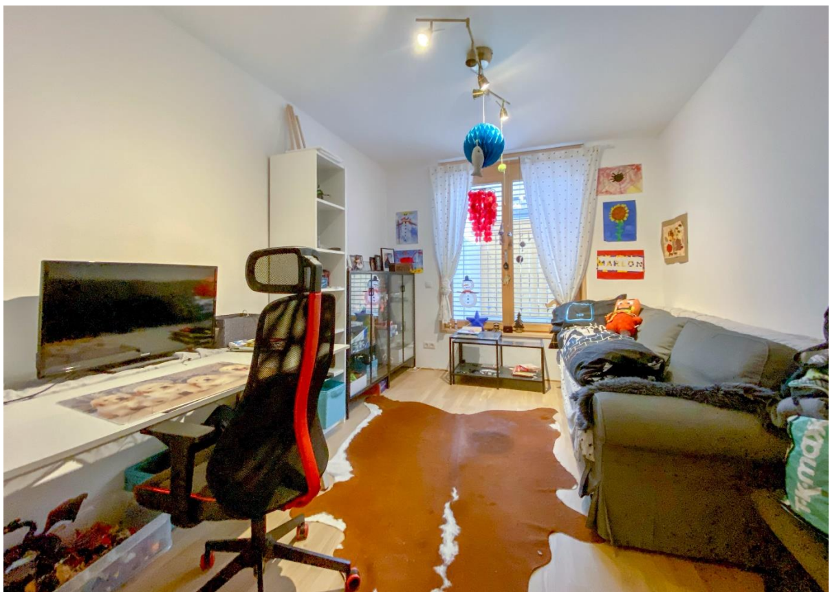
Schlafzimmer 2 / Kinderzimmer