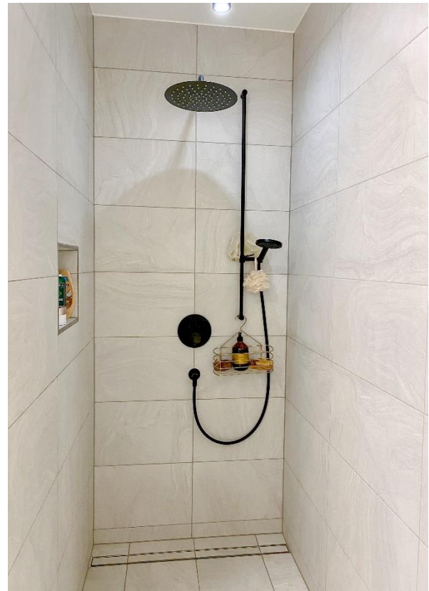
walk in Dusche in Bad 1