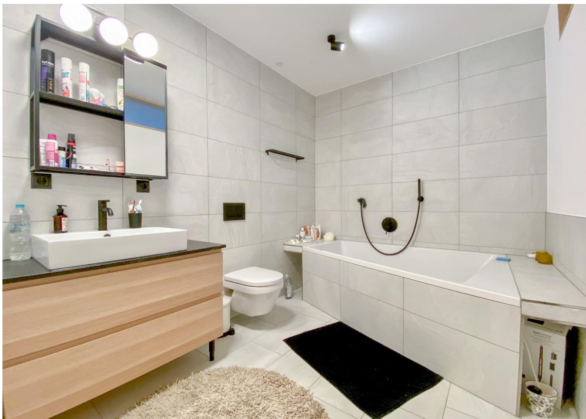
Waschtisch, WC und große Badewann in Bad 2