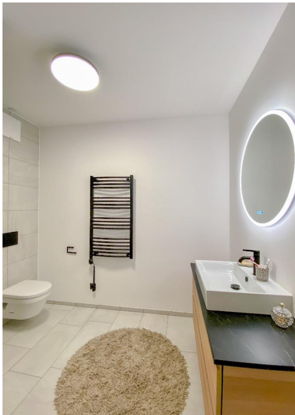
Waschtisch, WC und