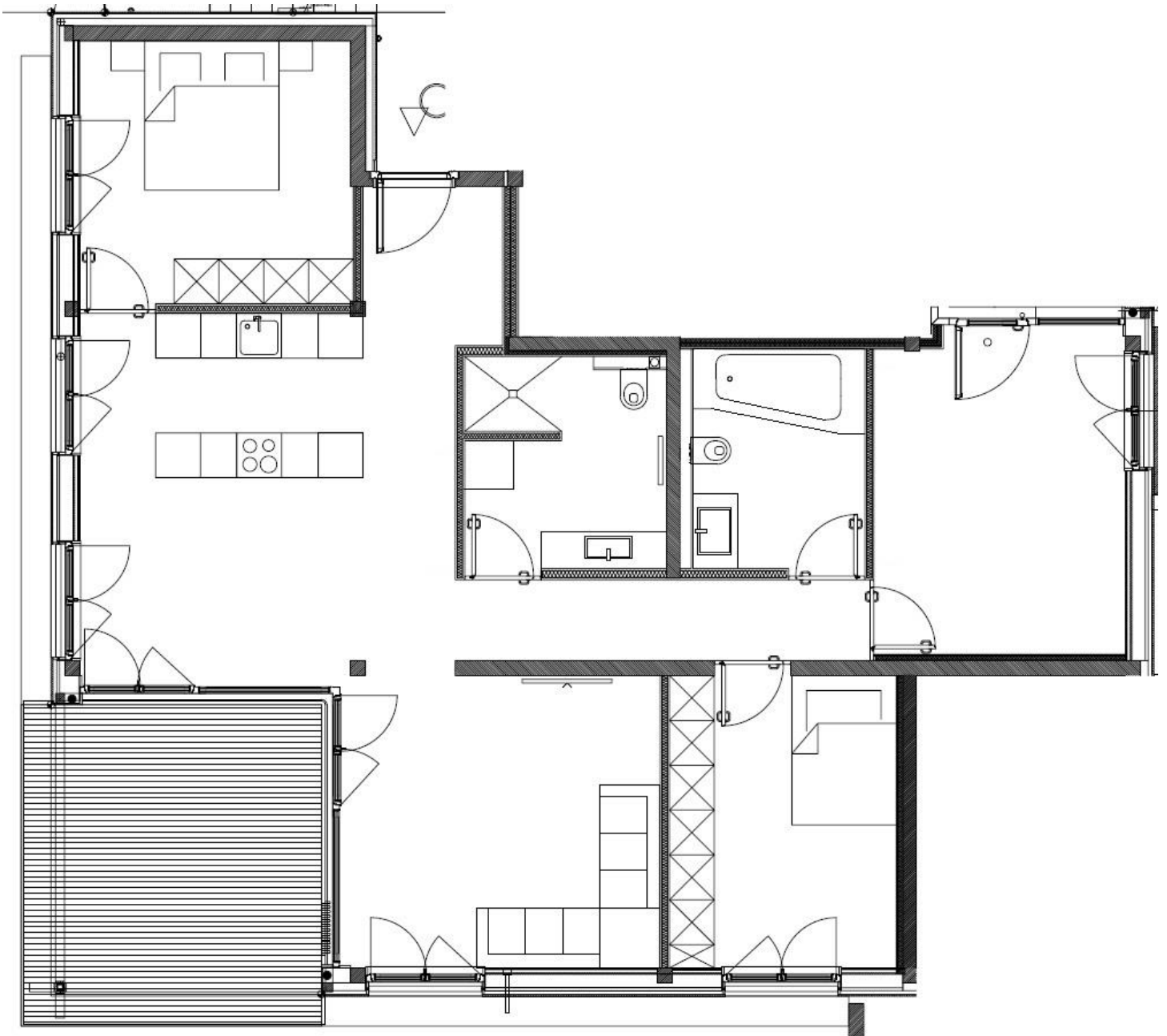
Grundriss (ohne Garten) Top 1, EG,