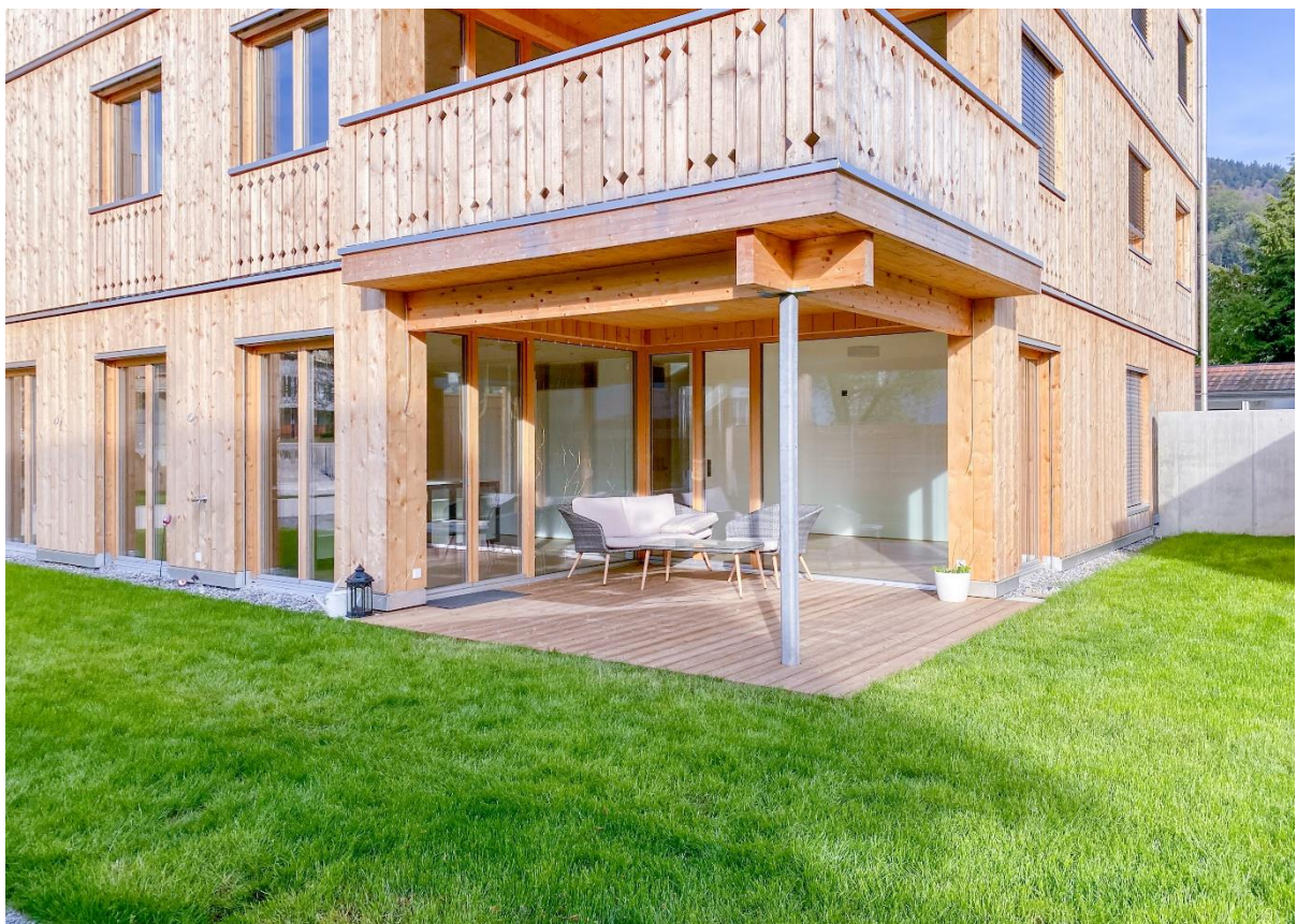
Rasenfläche & Terrasse nach Süd / West