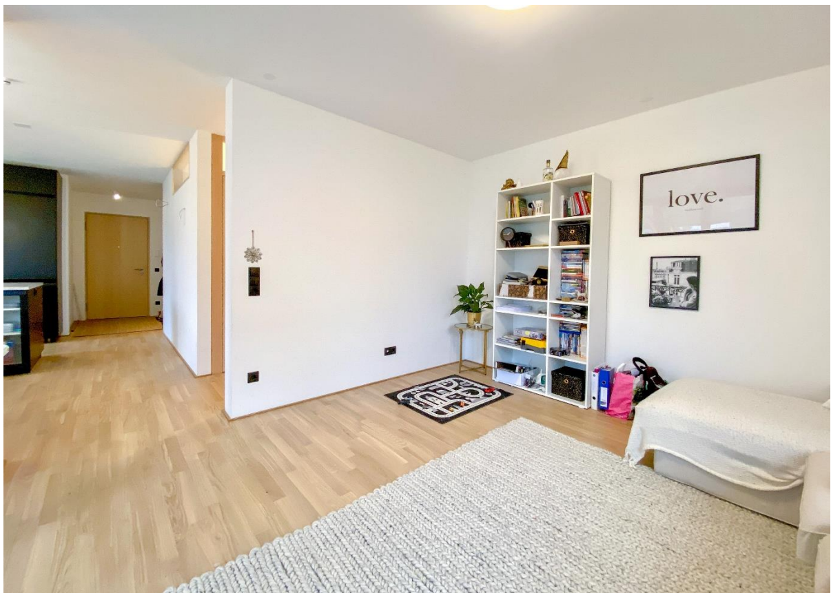
Offener Durchgang – Kochen / Essen zu Wohnen