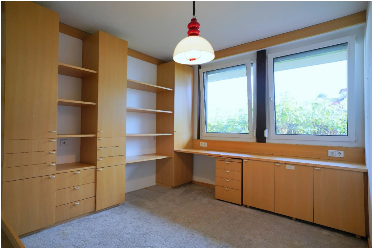
Kinderzimmer2 / Büro2: