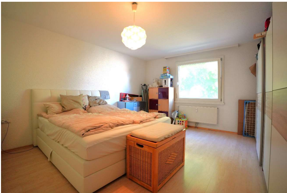
Kinderzimmer / Büro: