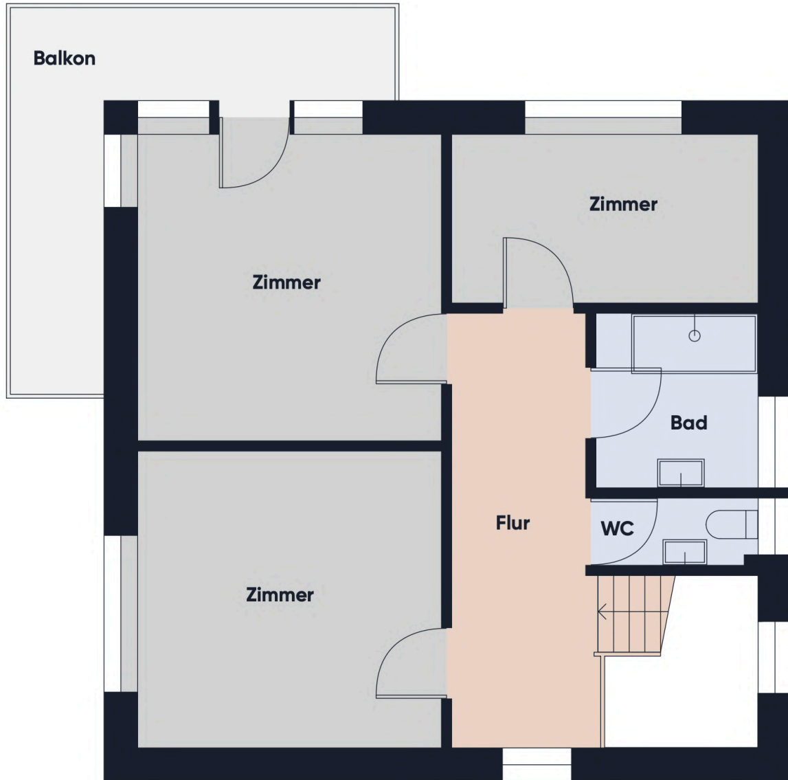
Grundrissplan ohne Maßstab OG