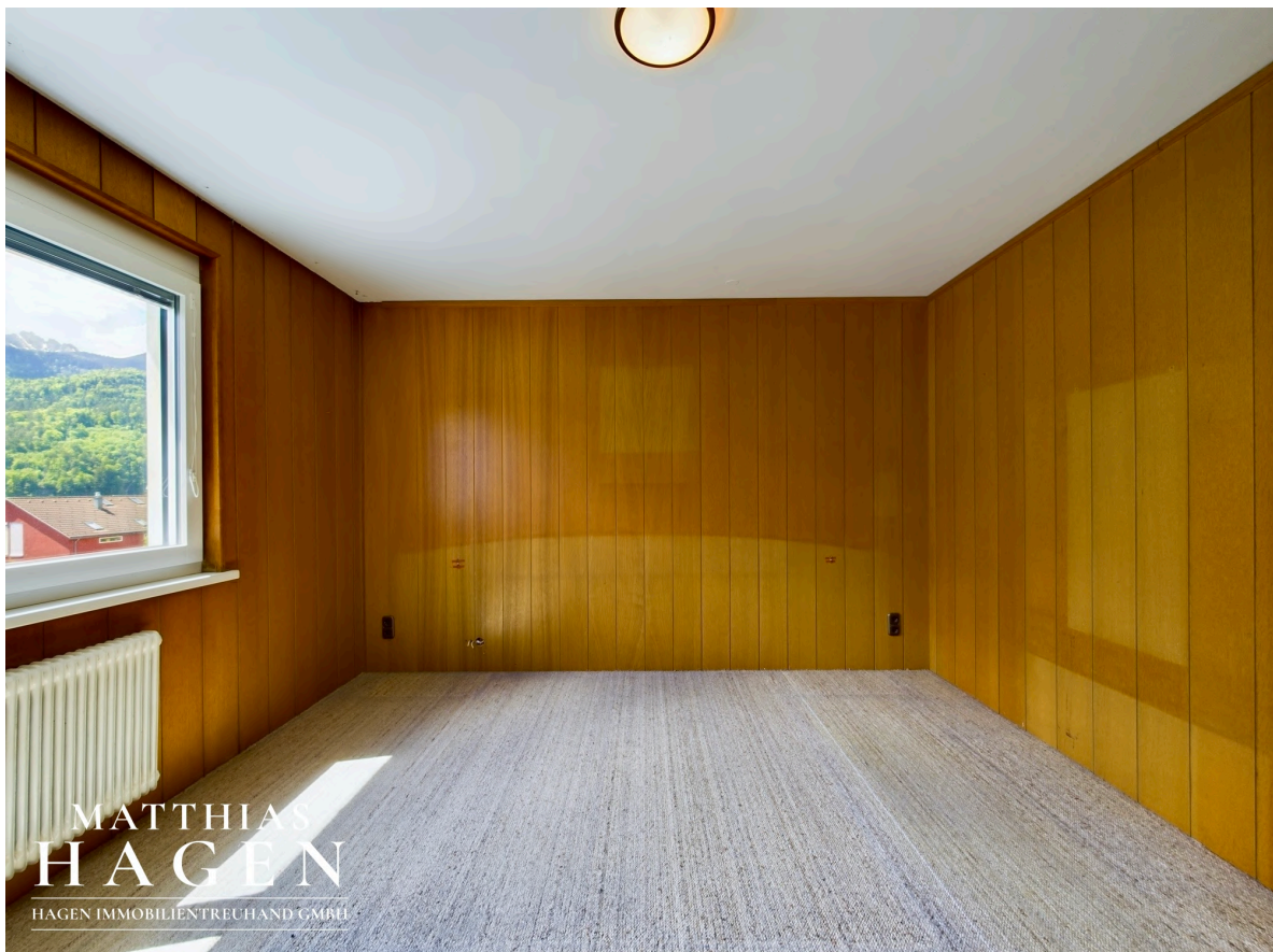
Zimmer 2 Aussicht