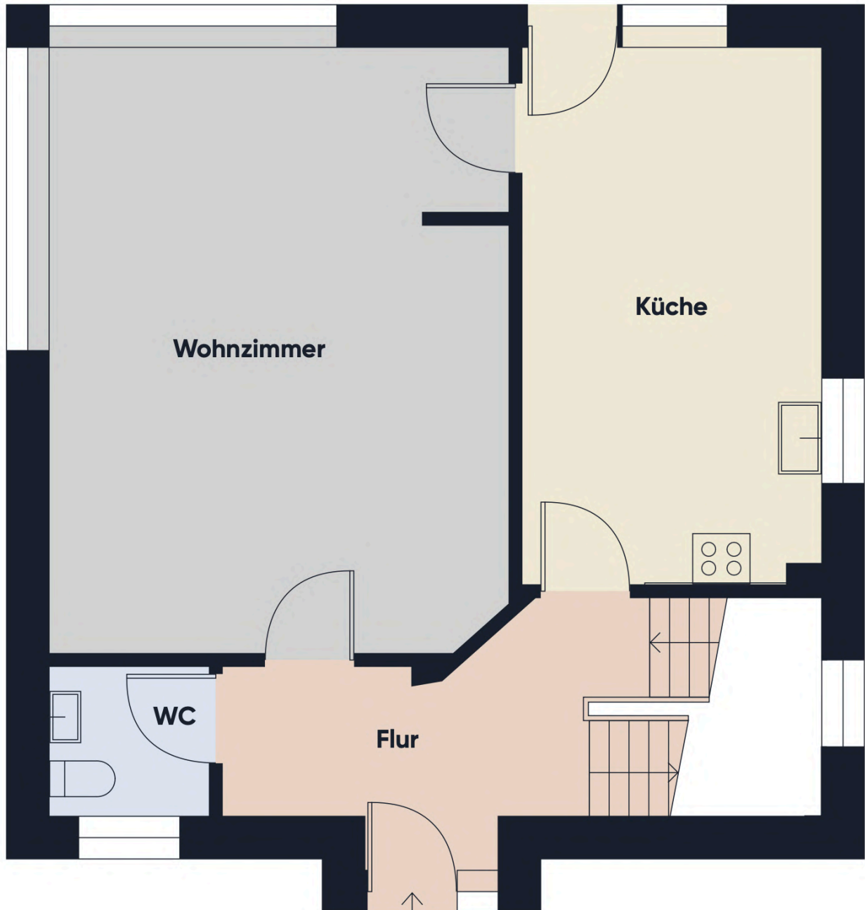
Grundrissplan ohne Maßstab EG