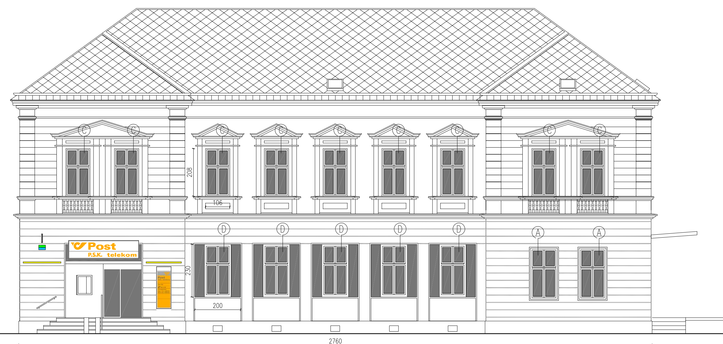
ANSICHT SÜD-WEST BADNER STRASSE