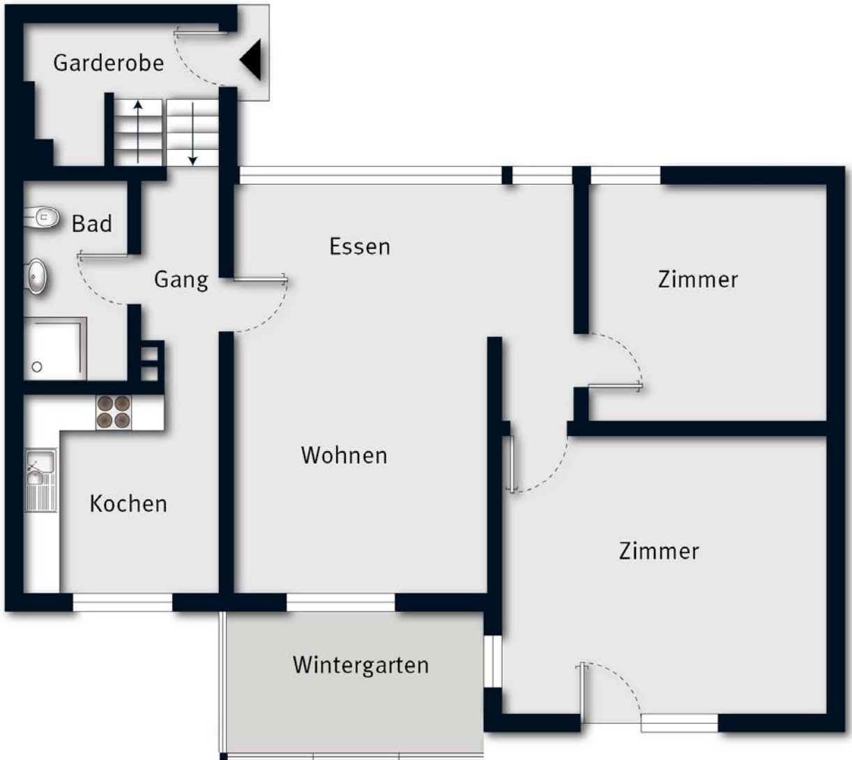
Grundriss ohne Maßstab