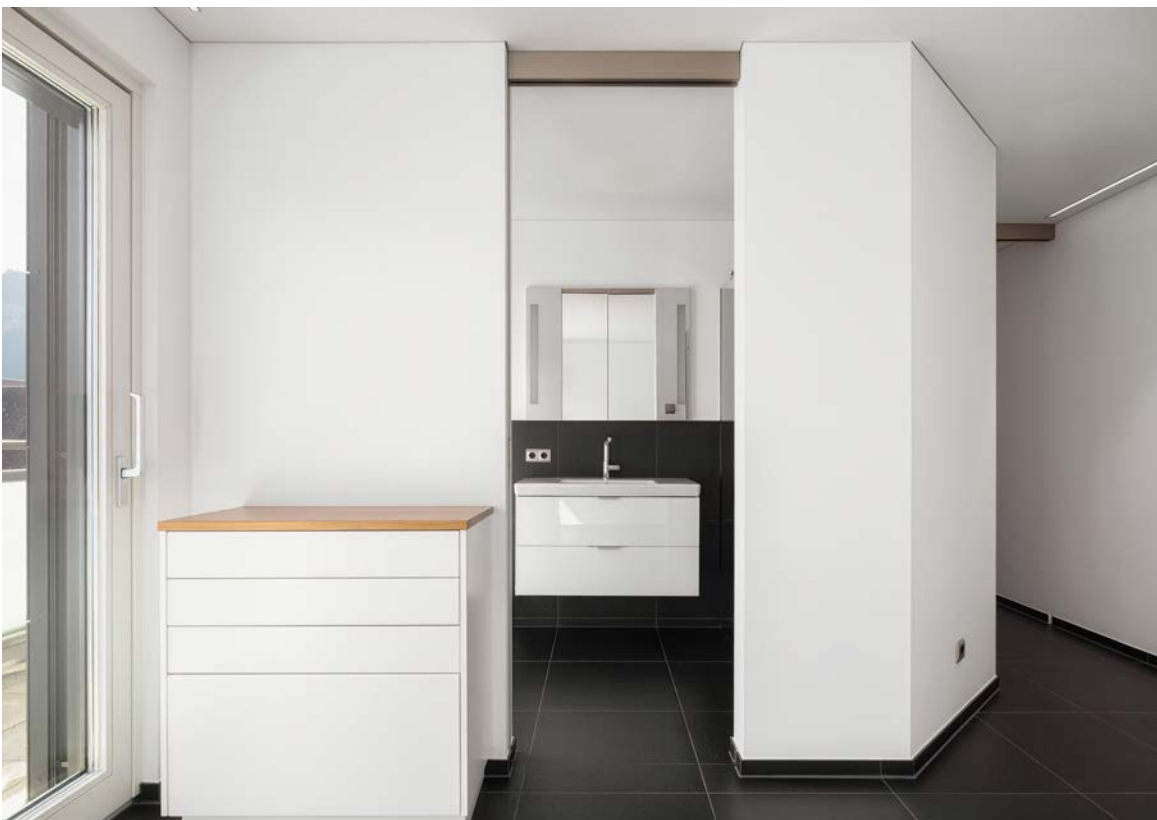
Zimmer_Zugang zu Bad I