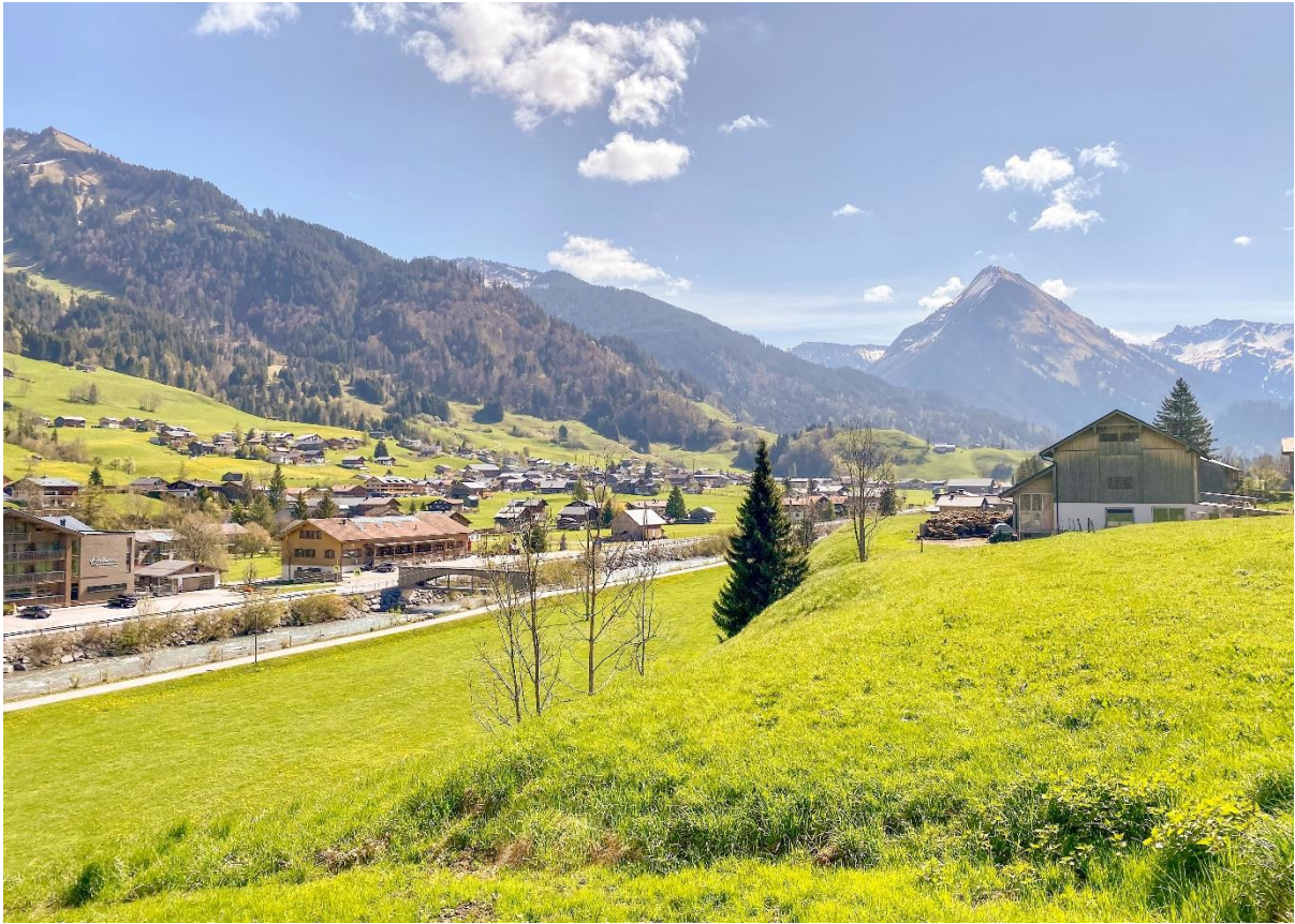
Ausblick nach Osten