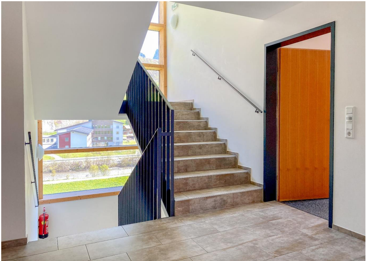
Helles Stiegenhaus - Wohnungseingang