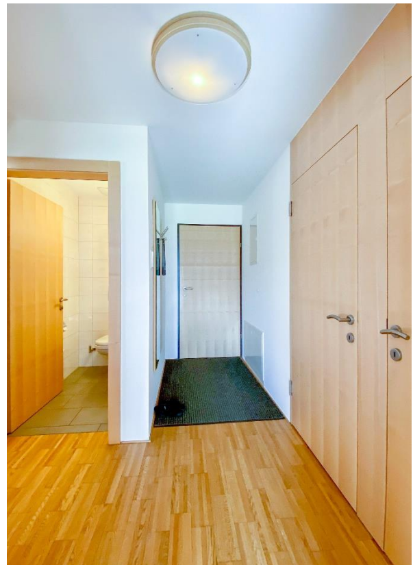
Flur / WC