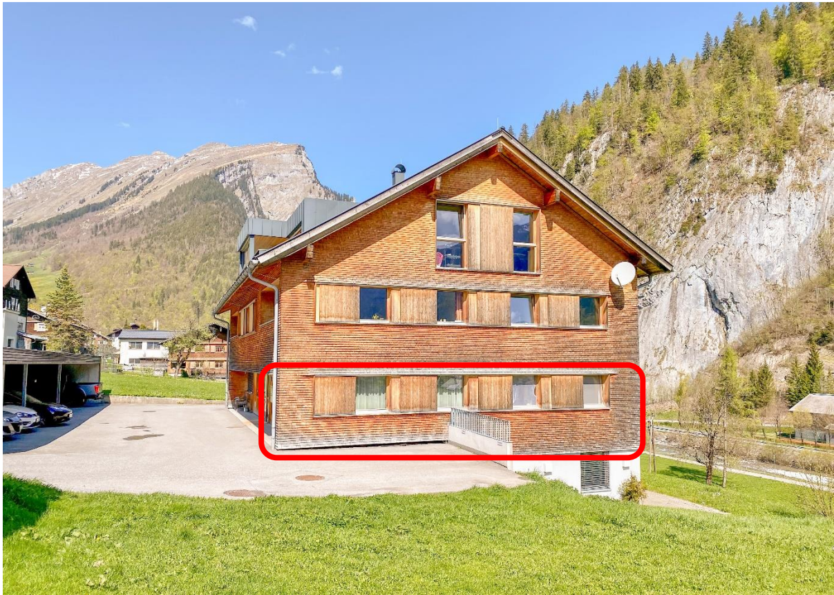
Ansicht Osten – Wohnung im EG