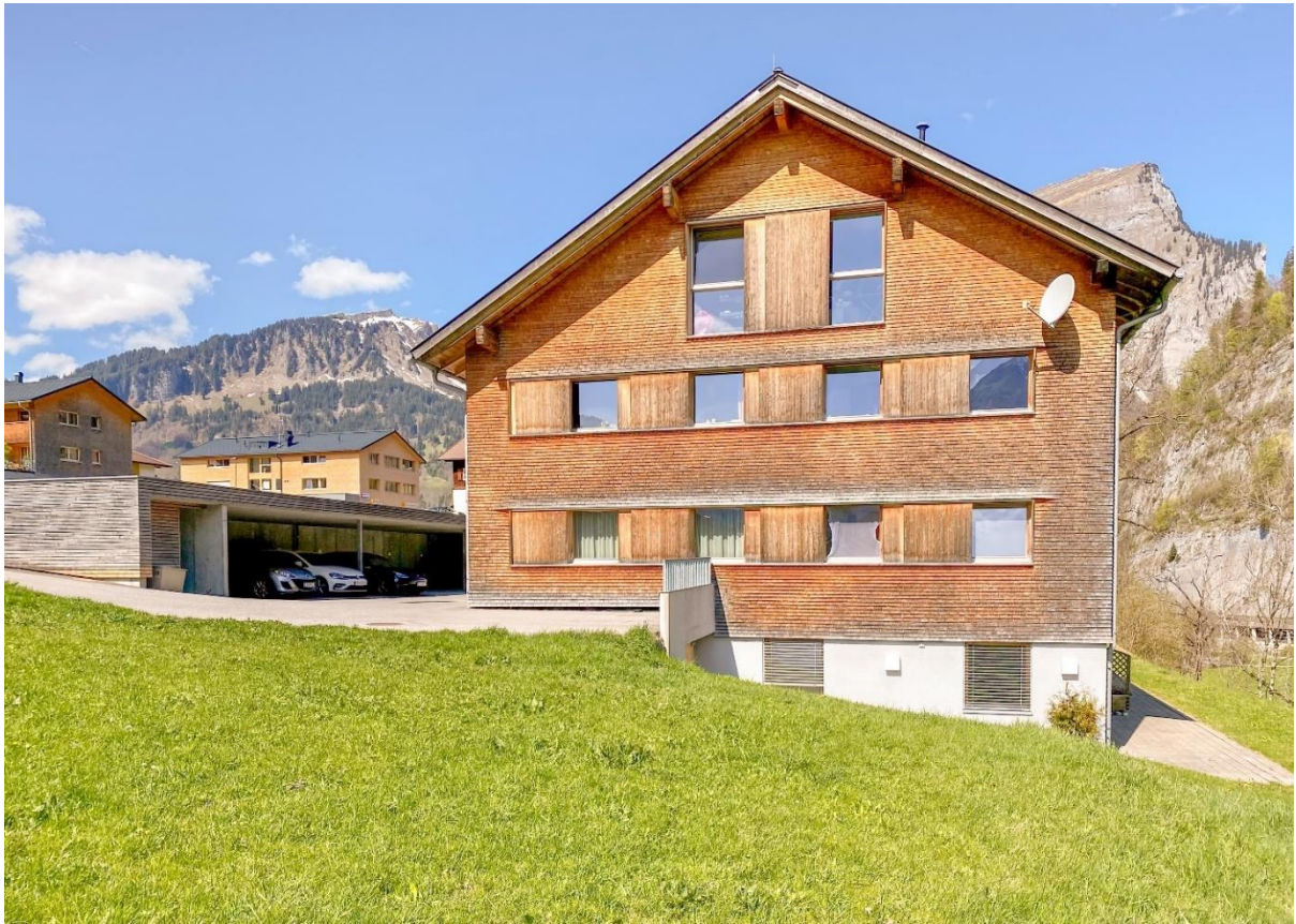
Die Morgensonne genießen.....