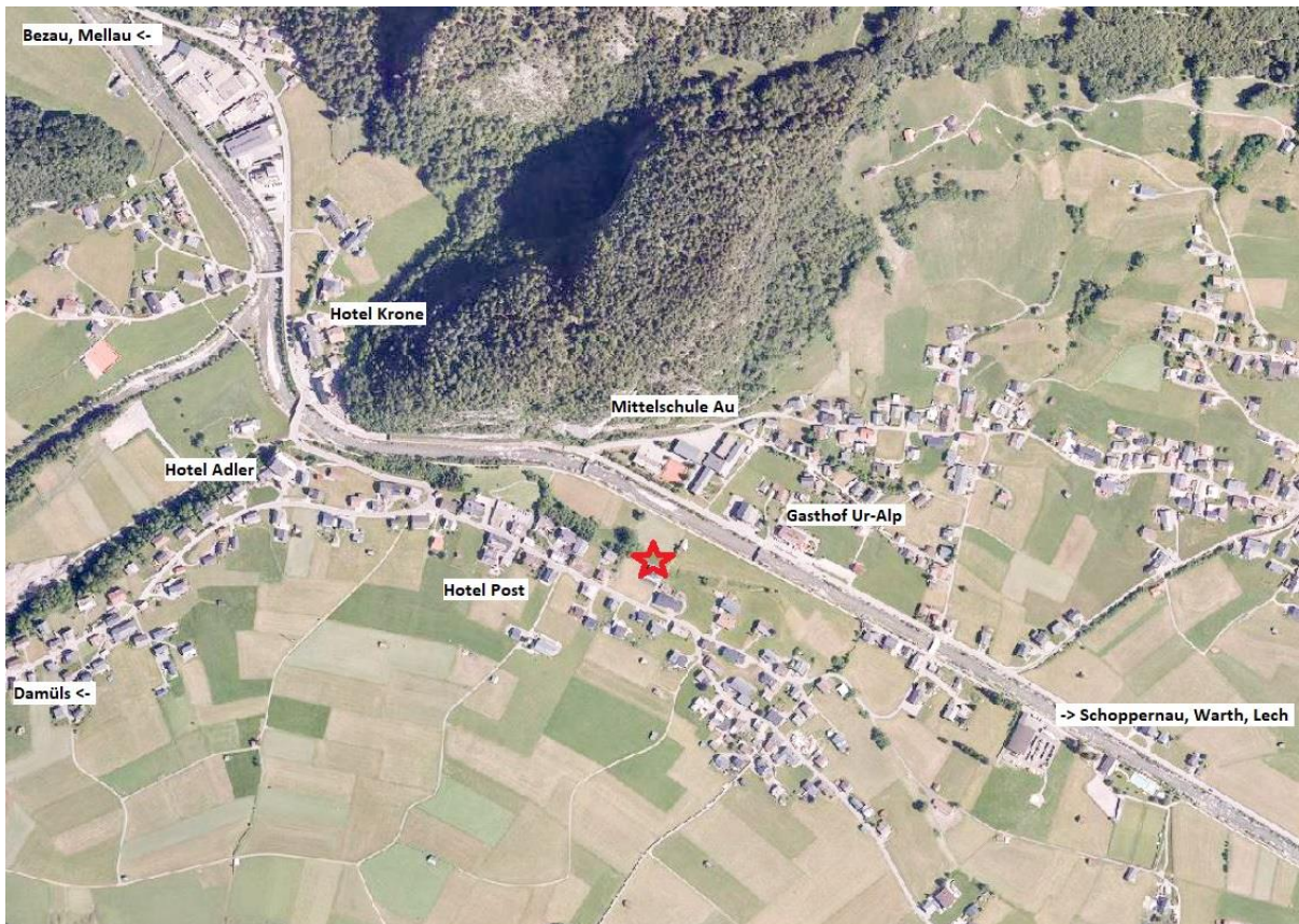
Lageplan / Anfahrt