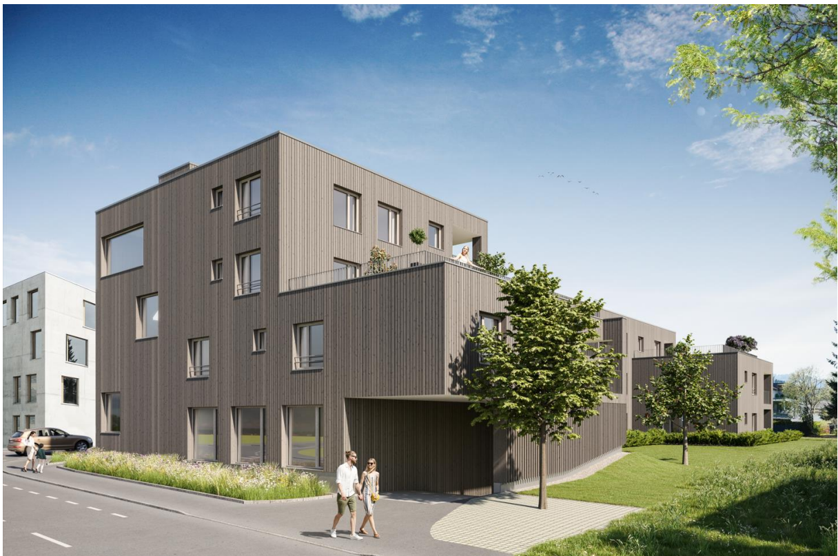
Haus A mit Ansicht Tiefgaragenabfahrt Landammanngasse