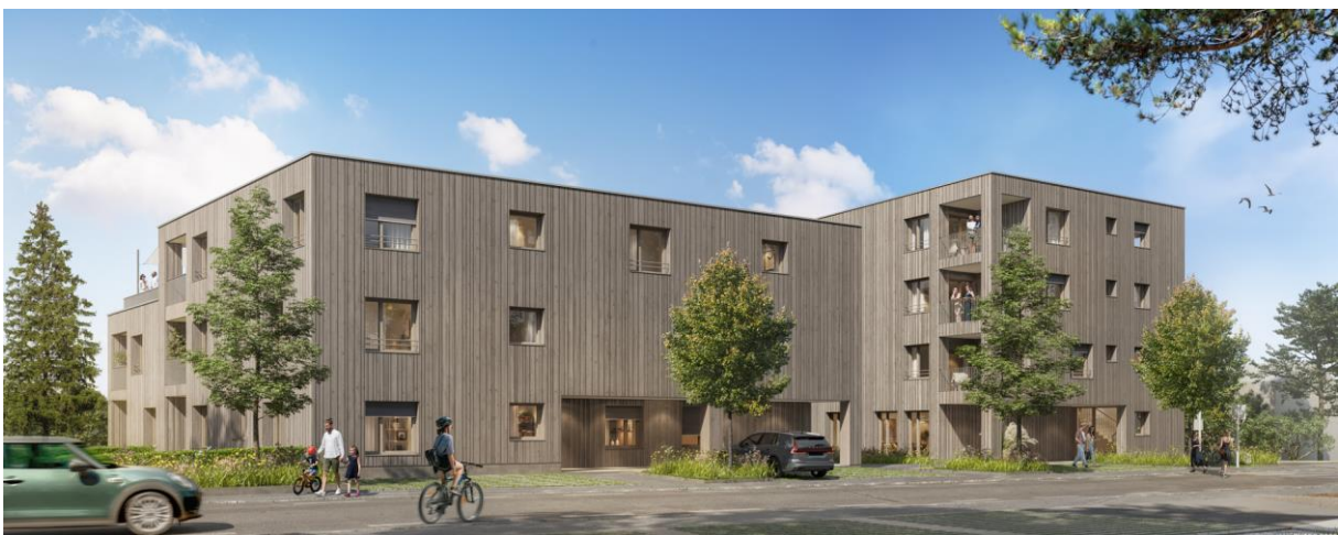
Haus B links, Haus A rechts Ecke Hadeldorfstraße/Landamanngasse