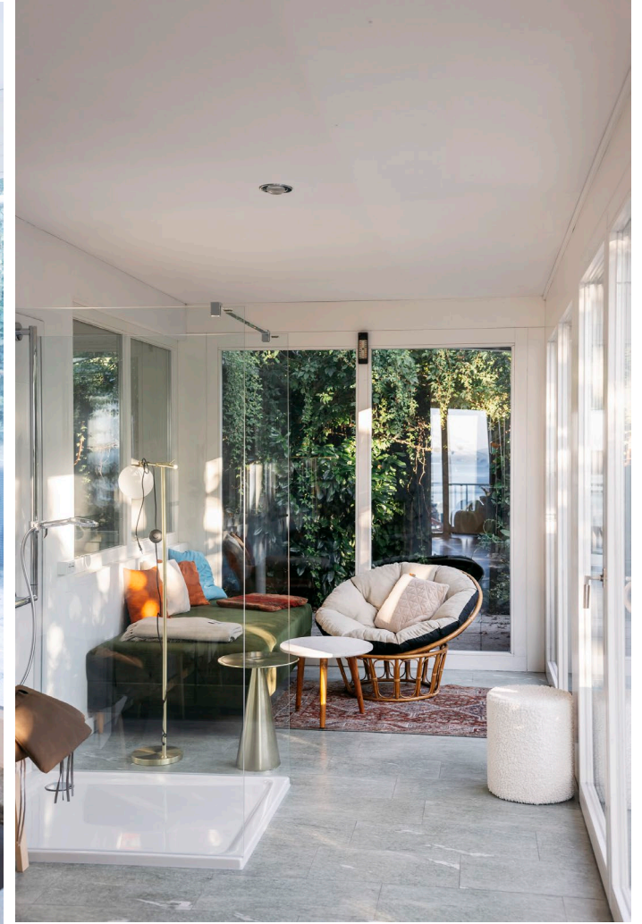
Küche & Wintergarten