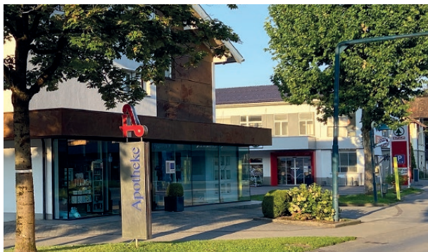
Apotheke & Nahversorgung

Altach ist abwechslungsreich und vielseitig. Die Freizeit lässt sich mit gemütlichen Spaziergängen, beim Joggen im Parcours, beim Radfahren oder Schwimmen genießen. Zudem ist eine Vielzahl an Sport- und Freizeiteinrichtungen und ein aktives Vereinsleben geboten. Hier ist für jeden etwas dabei.