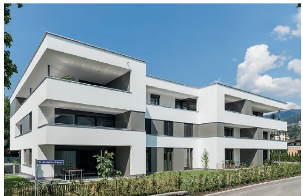
Wohnanlage Montfortstraße, Rankweil