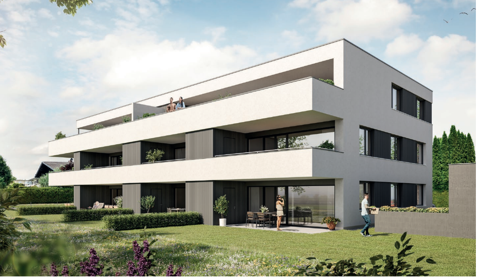
VISUALISIERUNG - AUSSENANSICHT