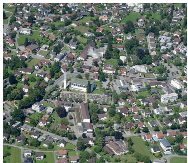
Luftaufnahme von Altach

Die gefragte Wohngemeinde in der Kummenbergregion hat vieles zu bieten. Die aufstrebende Gemeinde mit ca. 7.000 Einwohnern verfügt über eine gute Infrastruktur und sehr gute Verkehrsanbindungen in das Vorarlberger Ober- und Unterland sowie durch die Grenznähe in das benachbarte Ausland. Mit seinen Sport- und Freizeiteinrichtungen ist Altach ein idealer Wohnort für Familien, Jugendliche und Senioren.