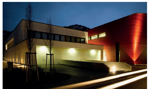
Veranstaltungszentrum KOM