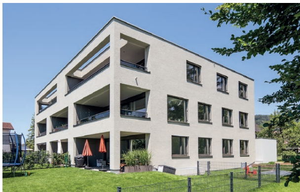
Wohnanlage Austraße II, Sulz