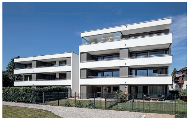
Wohnanlage Frühlingsstraße, Lustenau