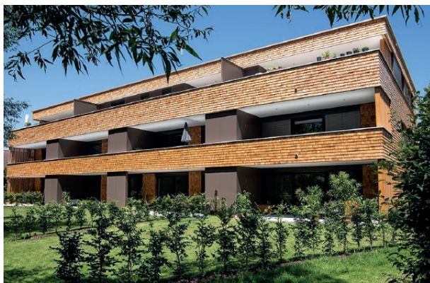
Wohnanlage Obere Härte, Dornbirn