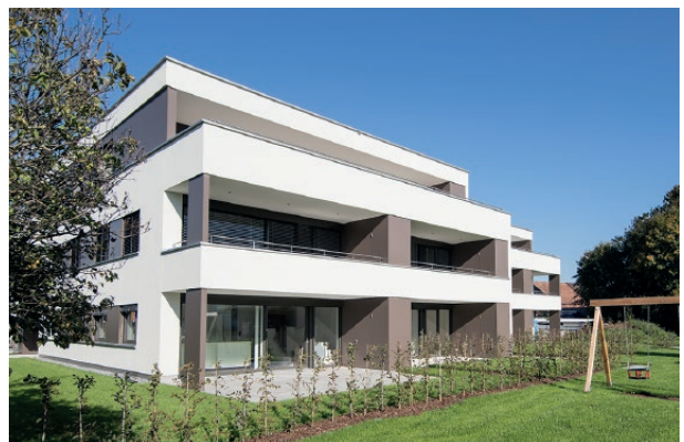
Wohnanlage Weiherstraße, Lustenau