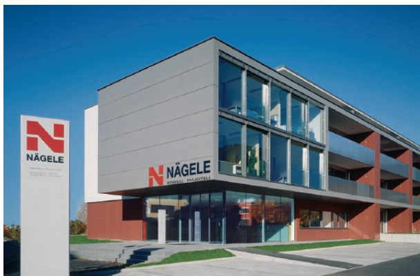
Firmenzentrale und Wohnanlage, Sulz

In den vergangenen 50 Jahren hat Nägele Wohn- und Projektbau mit rund 4000 errichteten Eigentumswohnungen einen sehr guten Ruf als Bauträger für anspruchsvolle Wohn- und Geschäftsanlagen in ganz Vorarlberg erworben. Hier sehen Sie ein paar Gründe dafür.