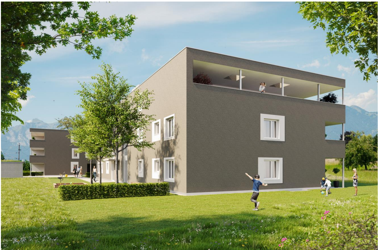
Haus A links, Haus B rechts