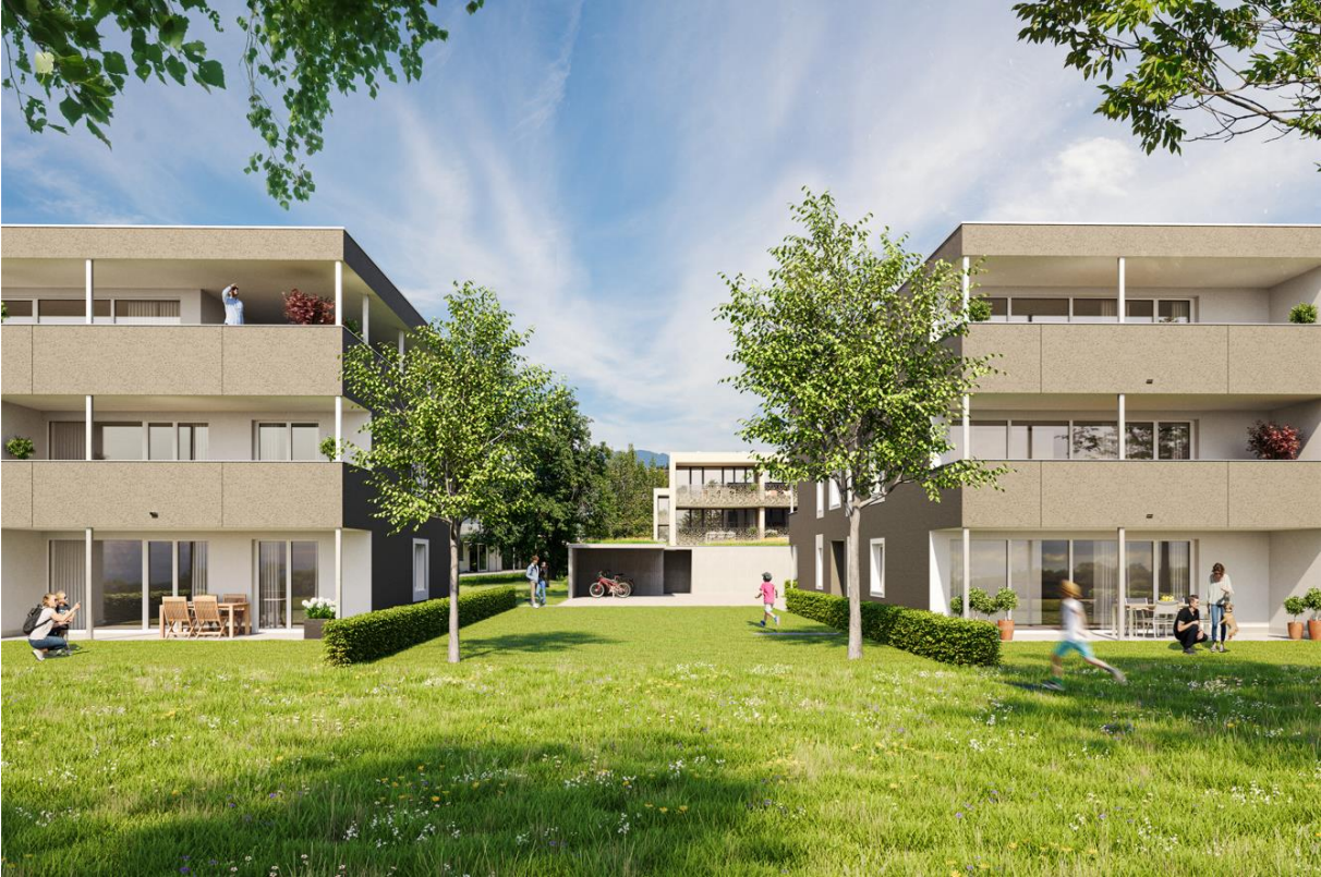
Haus A rechts, Haus B links