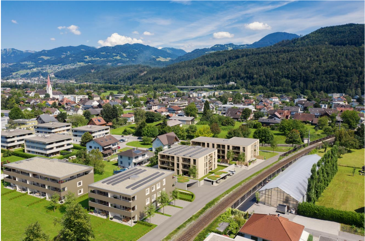
Haus A rechts, Haus B links