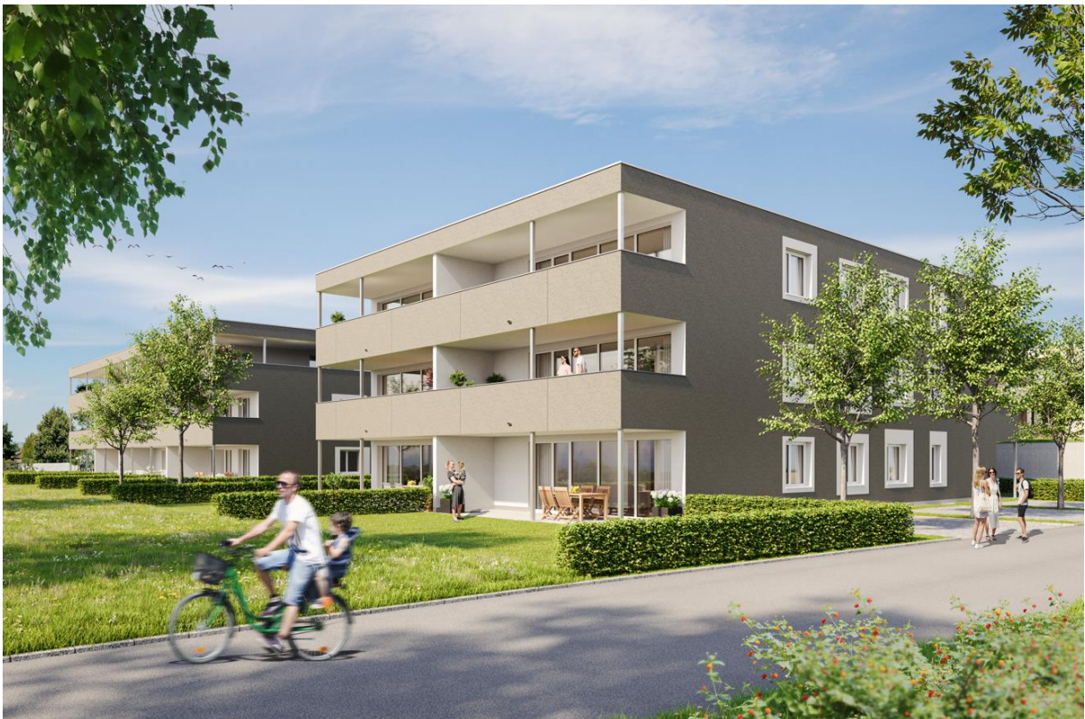
Haus A rechts, Haus B links