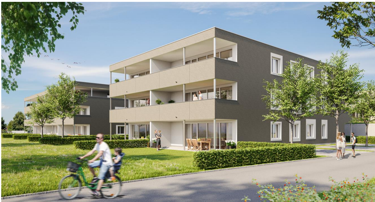
Haus A rechts, Haus B links

Sichern Sie sich jetzt die hohe Wohnbauförderung vom Land Vorarlberg: