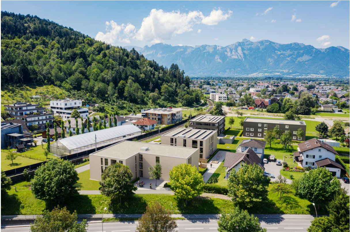
Haus A links, Haus B rechts