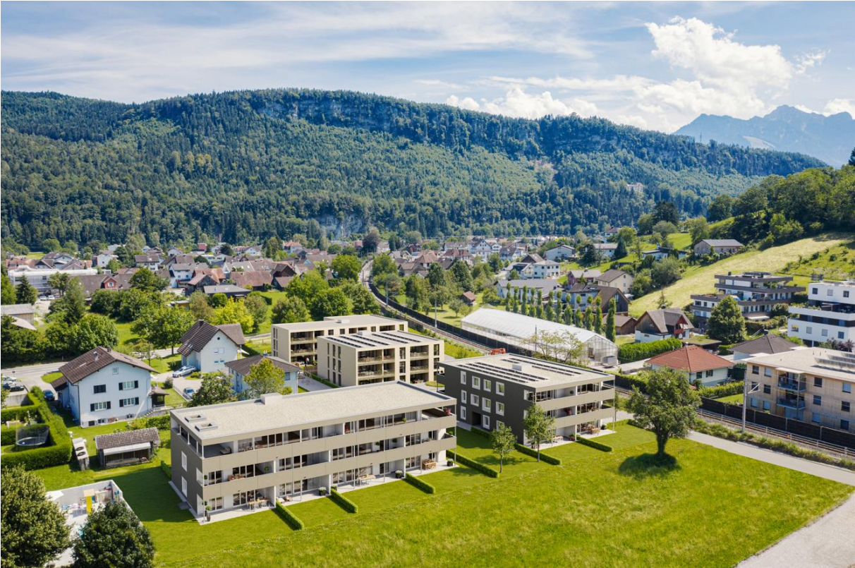
Haus A rechts, Haus B links