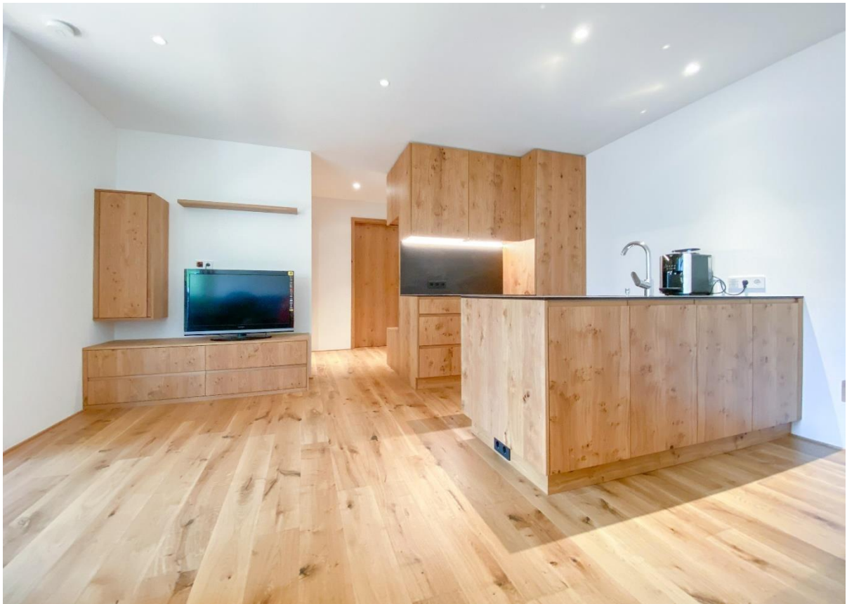
Beispiel: Kochen / Wohnen