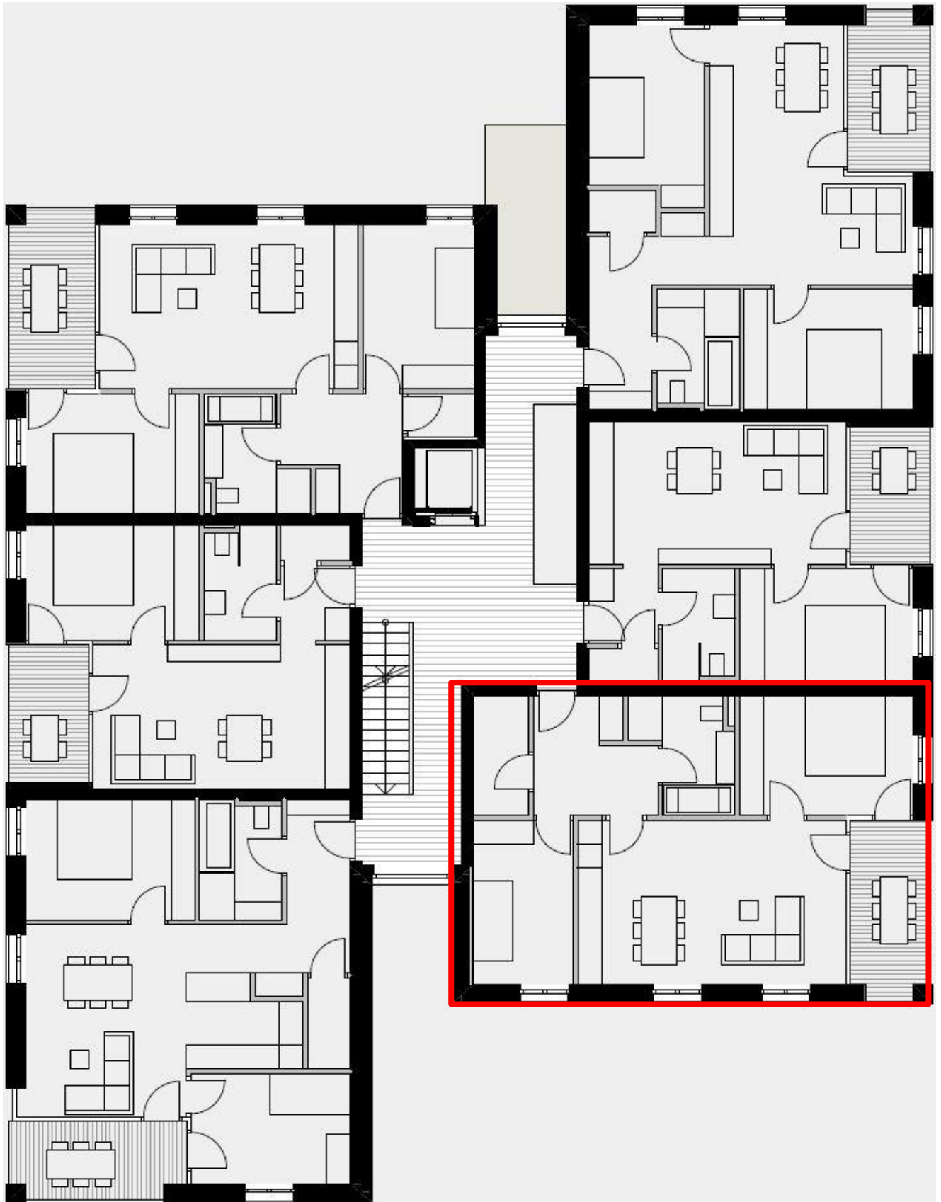
Stockplan 1. OG