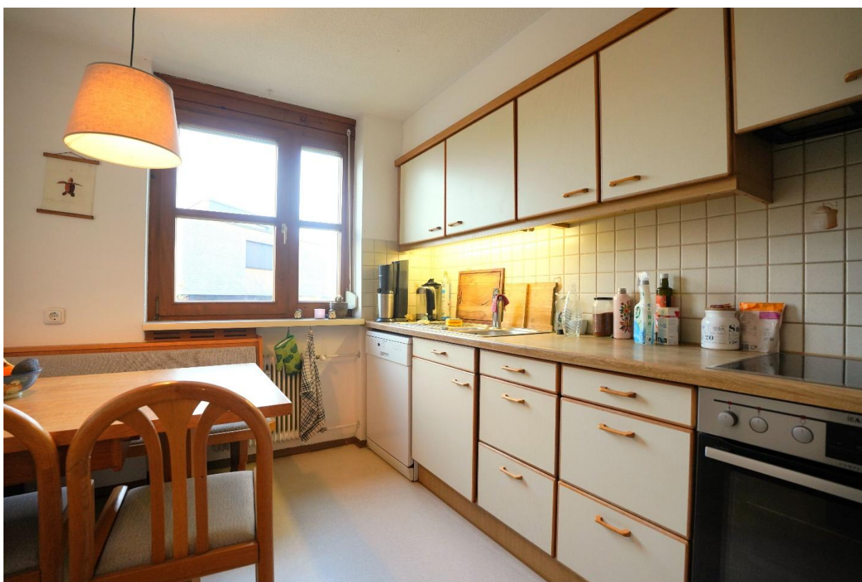
Küche mit Essbereich