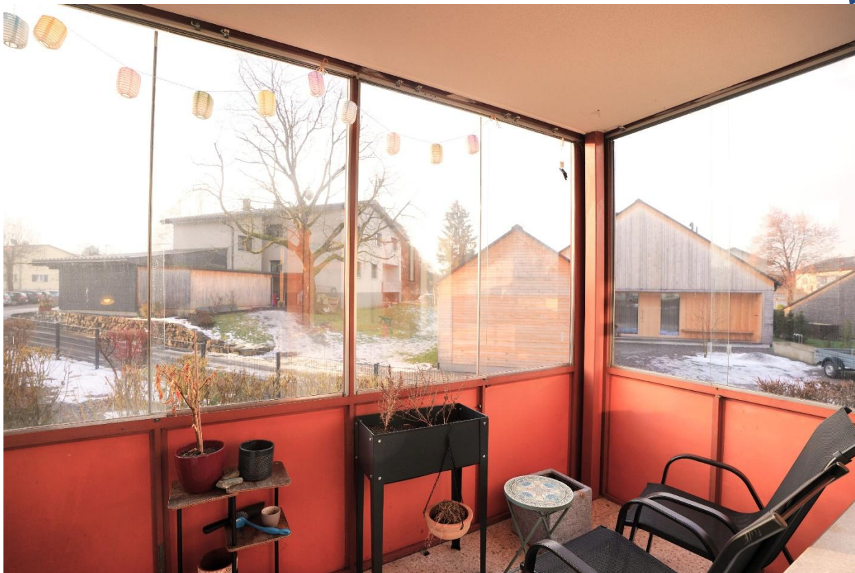
Balkon 1, verglast (Zugang vom Wohnzimmer)