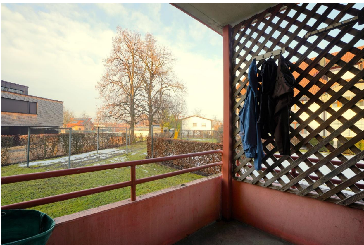
Balkon 2 (Zugang vom Schlafzimmer)