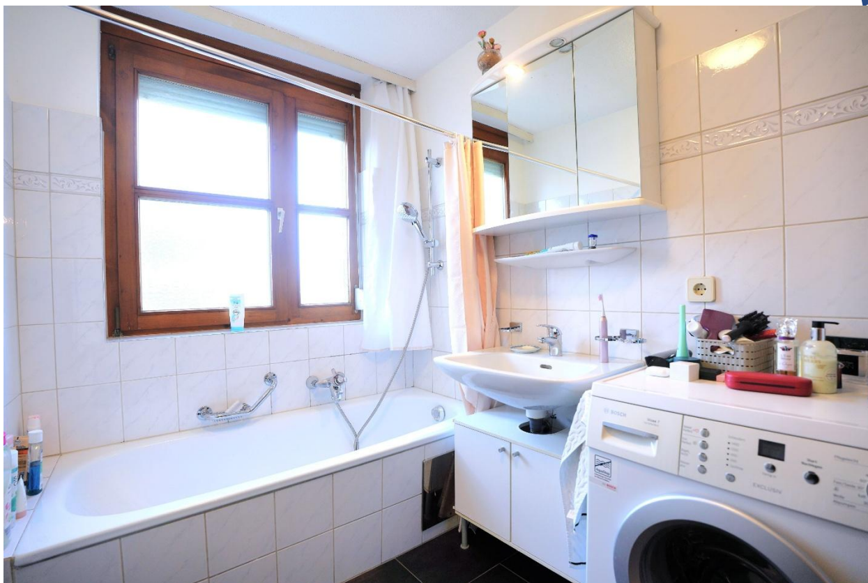
Badezimmer mit Badewanne und WC