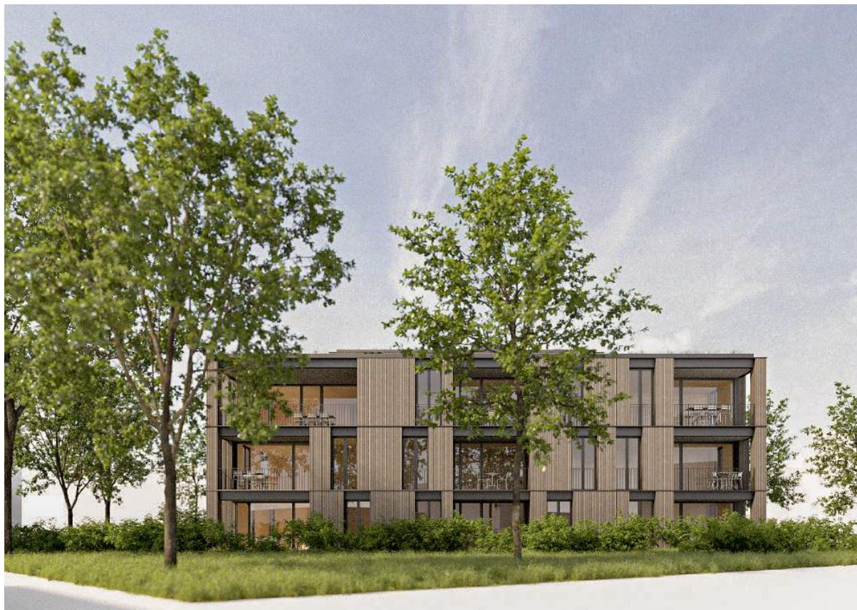
Ansicht Süd Ost