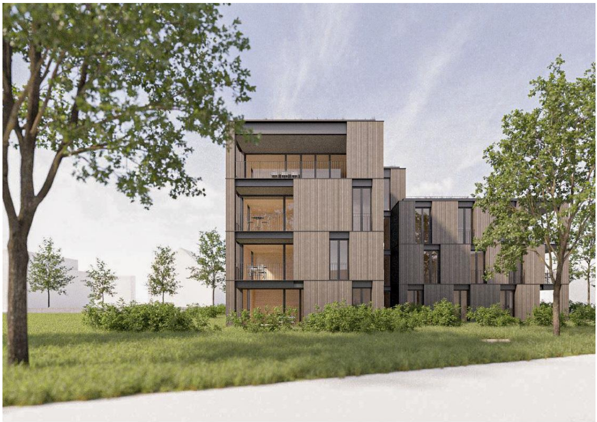
Ansicht Süd West