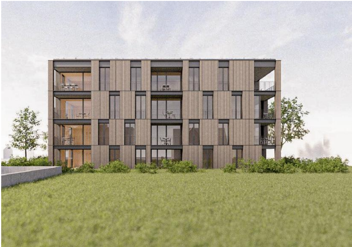
Ansicht Nord West