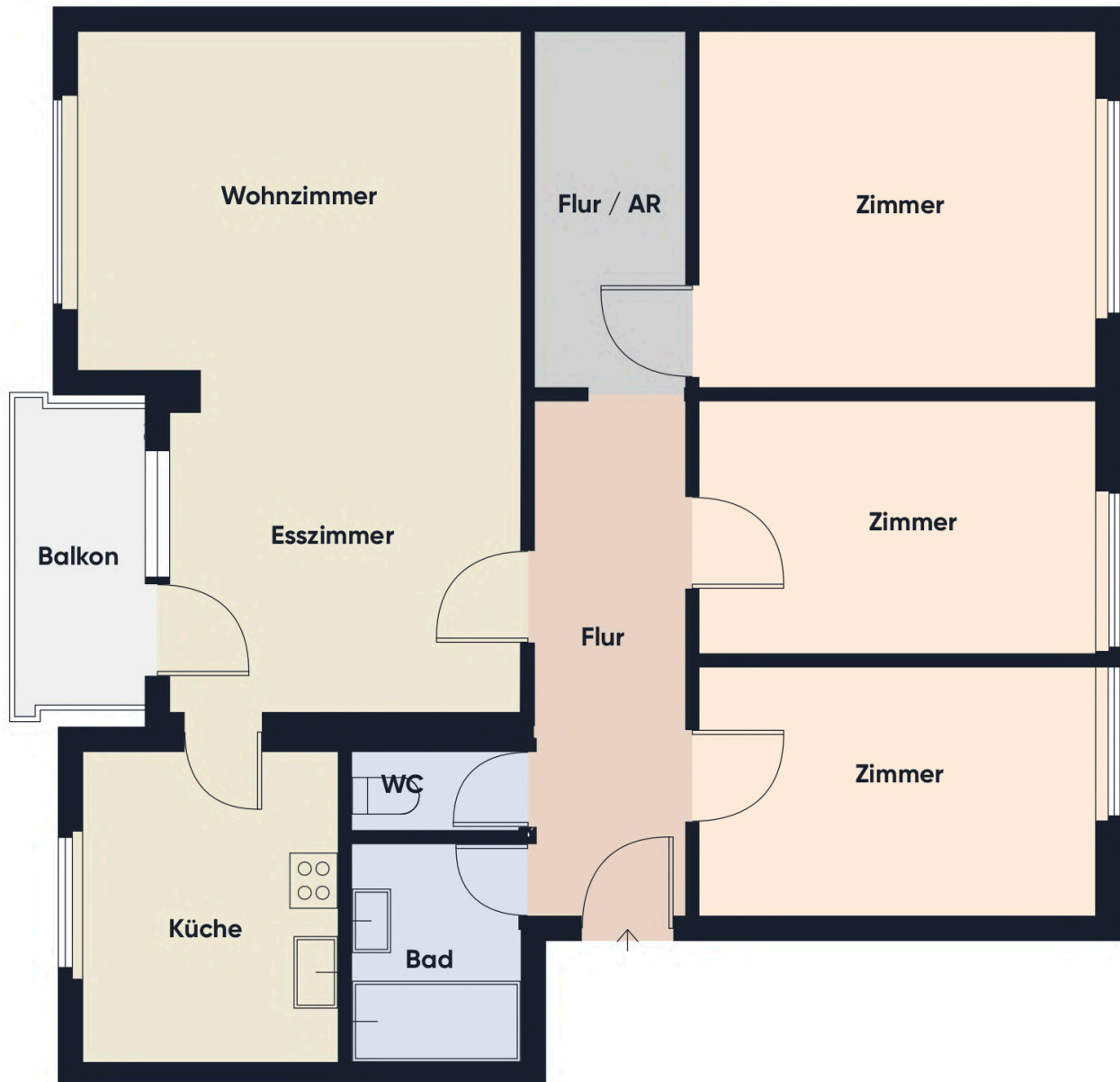
Grundrissplan ohne Maßstab