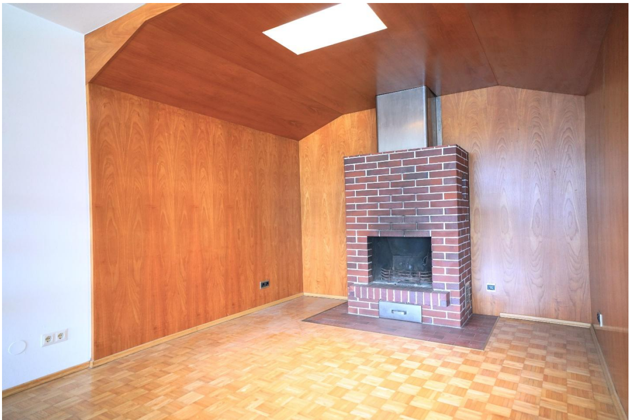
Offener Kamin im Wohnzimmer