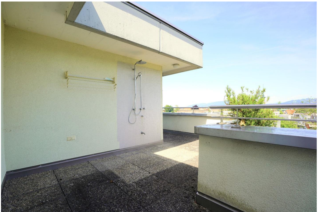
Outdoordusche auf der Terrasse