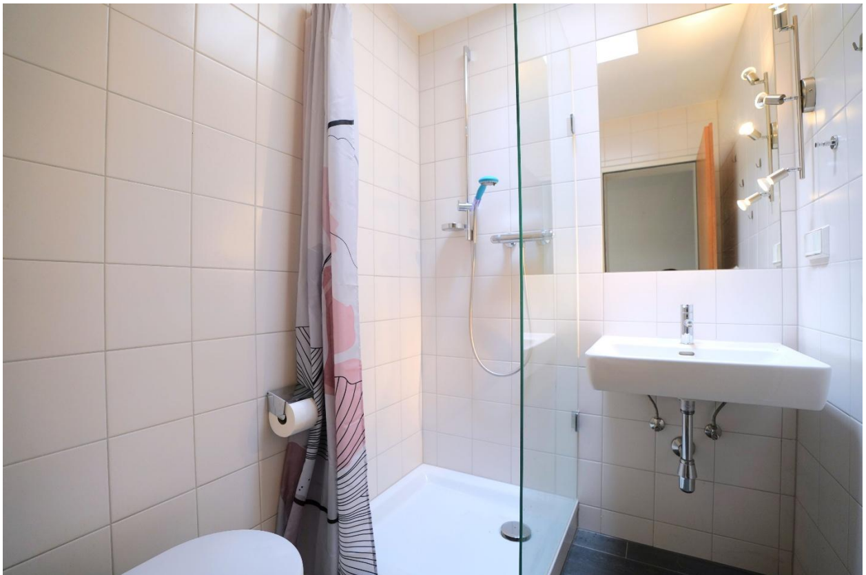
En-Suite-Badezimmer (direkt an das Schlafzimmer angrenzend) mit Dusche und WC