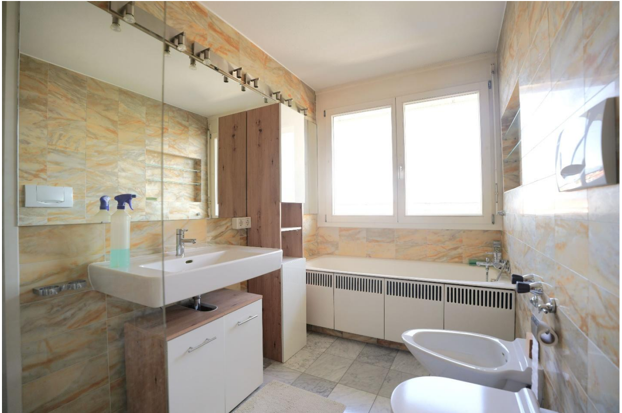
Marmorbadezimmer mit Badewanne, Dusche, WC und Bidet