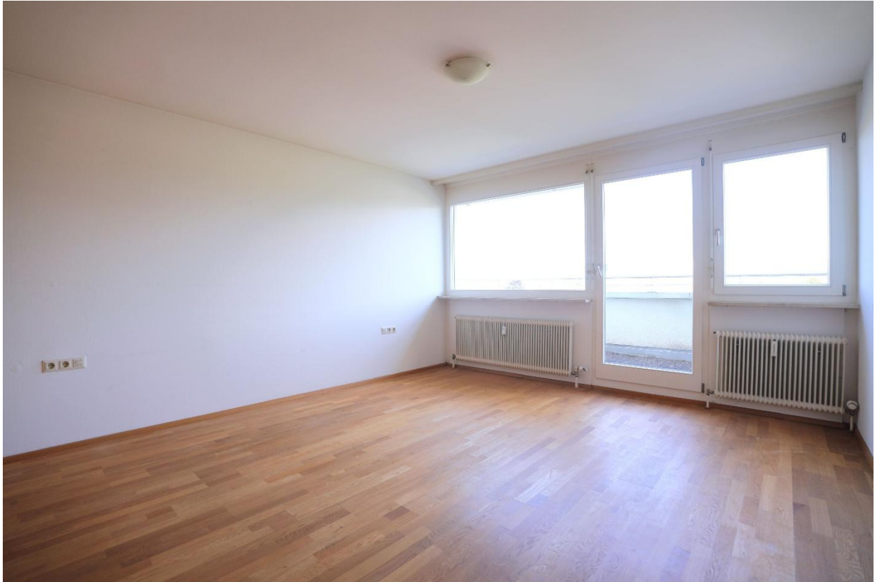
Schlafzimmer mit Zugang zur Terrasse