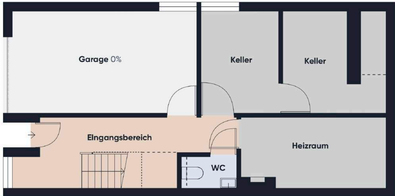
Grundrissplan ohne Maßstab EG