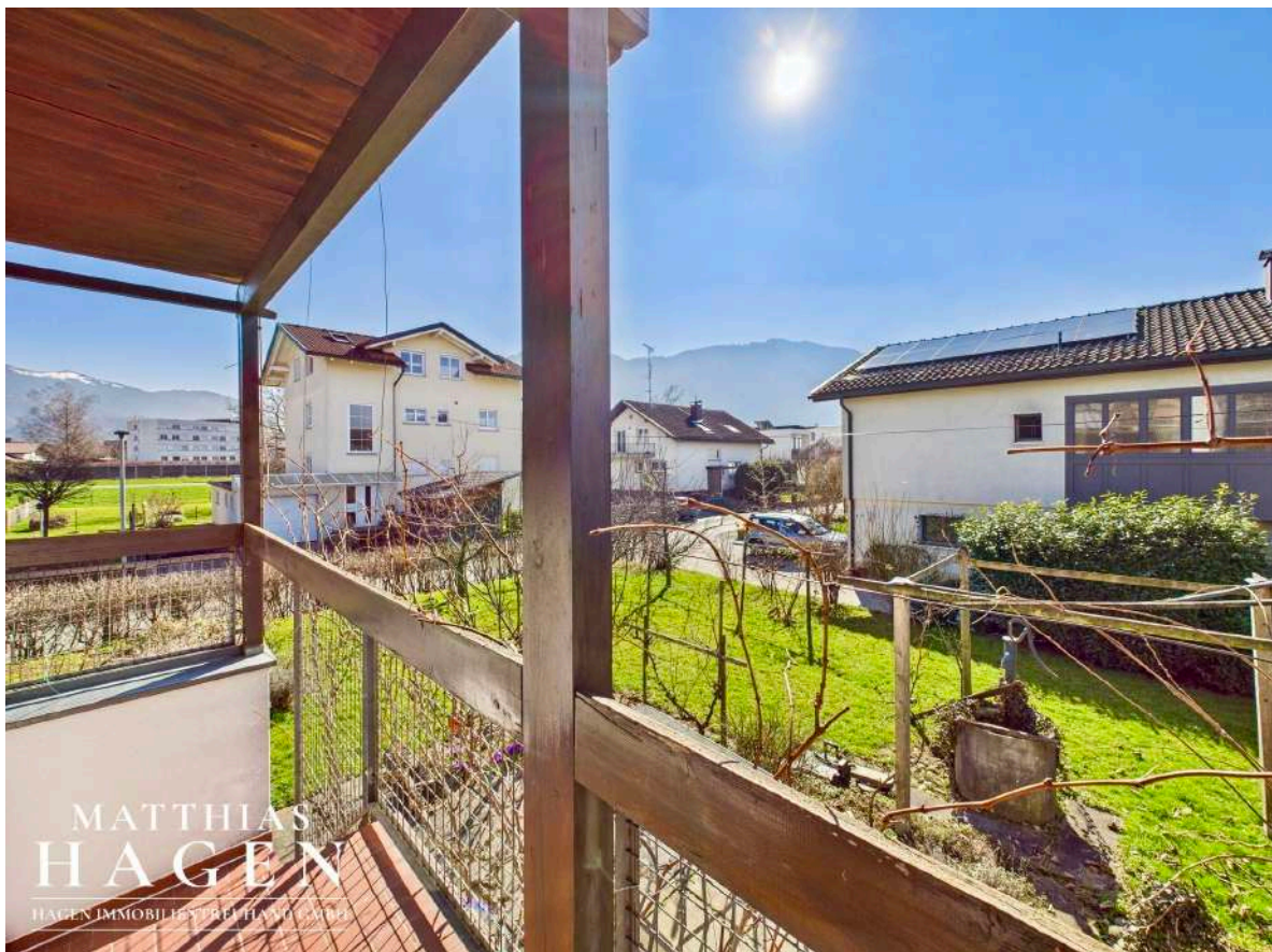
Treppe in den Garten