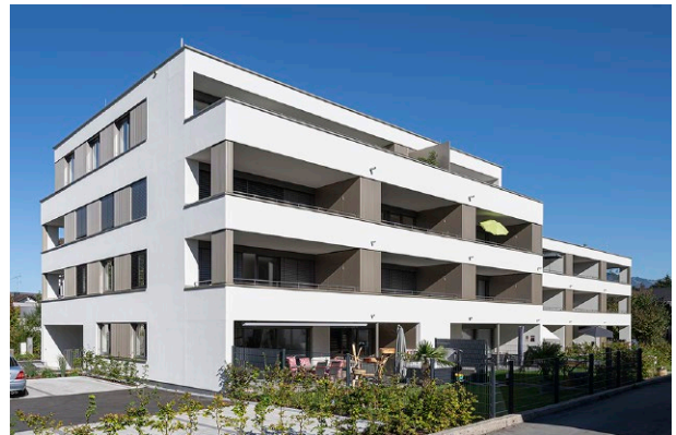
Wohnanlage Staldenstraße, Lustenau