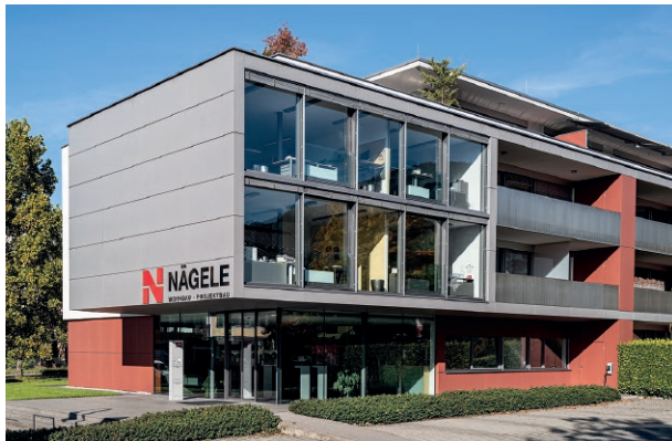
Firmenzentrale und Wohnanlage, Sulz

In den vergangenen 50 Jahren hat Nägele Wohn- und Projektbau mit rund 4000 errichteten Eigentumswohnungen einen sehr guten Ruf als Bauträger für anspruchsvolle Wohn- und Geschäftsanlagen in ganz Vorarlberg erworben. Hier sehen Sie ein paar Gründe dafür.