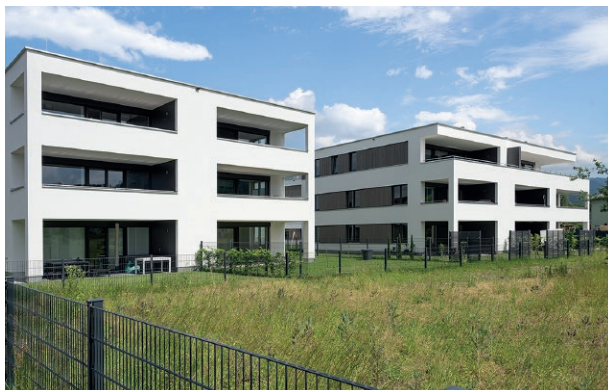
Wohnanlage Baumgarten, Mäder