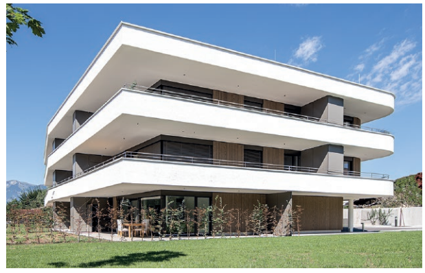
Wohnanlage Montfortstraße, Rankweil