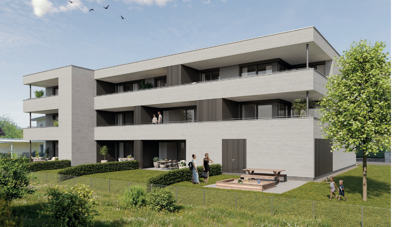
ANSICHT - VISUALISIERUNG