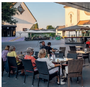
Zentrum - Blauer Platz

Die lebendige Marktgemeinde im Vorarlberger Rheintal bietet eine ideale Kombination aus naturnaher Umgebung und urbanem Lebensraum. Lustenau hat hinsichtlich ihrer Infrastruktur, Naherholungsgebieten und als attraktiver Wirtschaftsstandort vieles für eine lebenswerte Wohngemeinde vorzuweisen. Die zahlreichen sozialen und kulturellen Möglichkeiten in der Gemeinde tragen weiters zur hohen Lebensqualität bei und machen die 'Neudorfstraße' zu einem besonderen Zuhause.