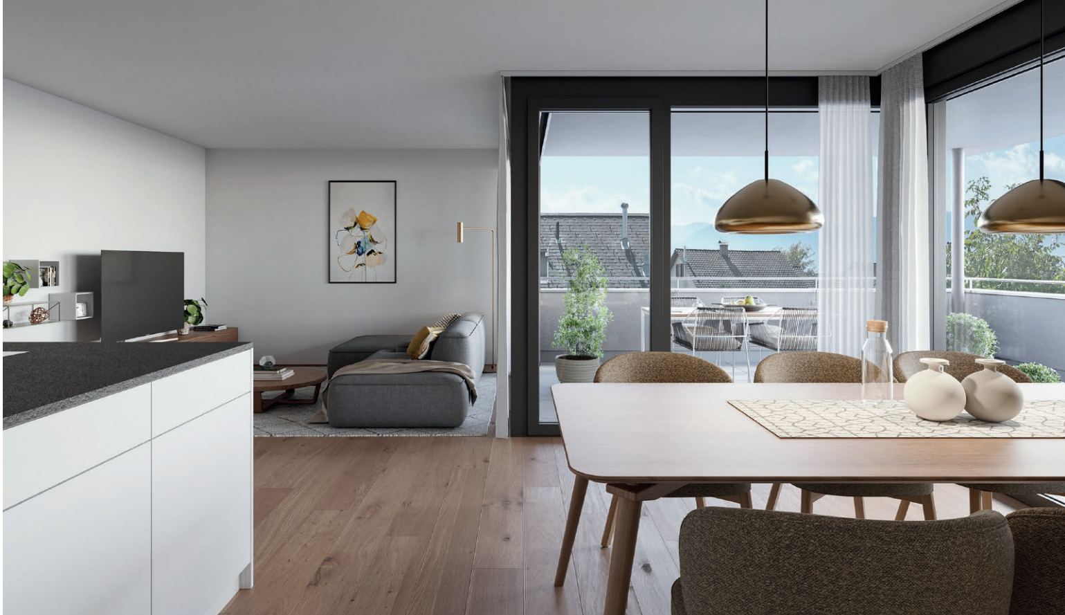
VISUALISIERUNG - INNENRAUM