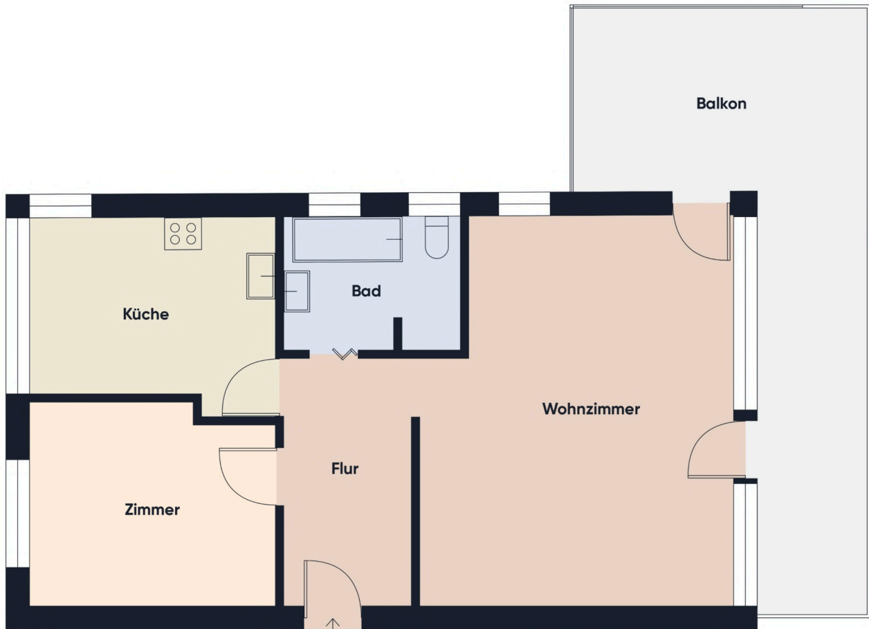
Grundrissplan ohne Maßstab